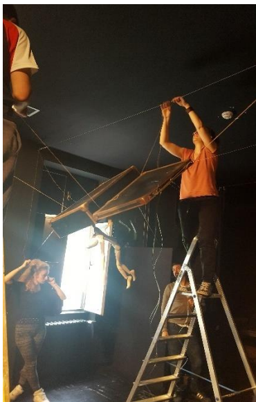
Slika 6: Namještanje lutke