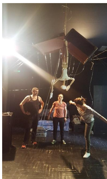
Slika 7: Isprobavanje pada