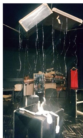
Slika 8: Lutka nakon pada

Sedma scena, ujedno i posljednja u našoj predstavi bila je rastanak od lutke. Svi animatori zajedno vodili smo lutku od ruke do ruke, prebacujući njezin križ od jednog do drugog sa velikim oprezom. Lutka je hodala po ogledalu između svijeća i svatko od nas morao ju je oprezno voditi da slučajno