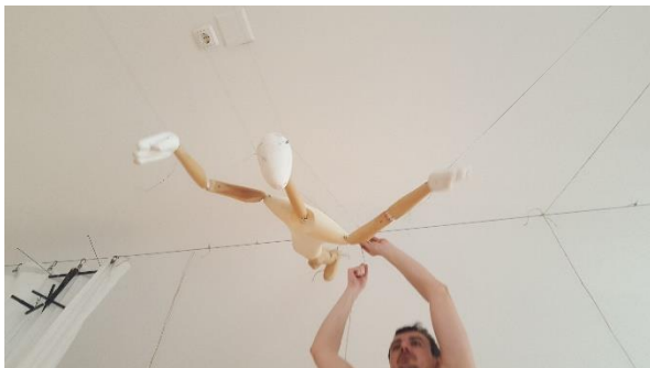
Slika 4: Namještanje lutke za pad u publiku

Šesta scena bila je tehnički najteže izvodiva. Bio je to lutkin pad iz kofera. Ovu scenu isprobavali smo puno puta, jer da bi scena bila savršena, svi i sve je moralo biti u potpunosti usklađeno. Postojalo je više zamisli kako bi se scena izvela. Počeli smo je raditi tako da lutka pada u zagrljaj nekom u publiku pa smo došli do toga da lutka ispada iz kofera. Isprobavali smo hoće li ispadati iz kofera dok on bude zatvoren pa da se otvara i tek onda da lutka ispada, do toga da kofer bude otvoren, a lutka da bude namještena već i spremna. No, tek kad smo došli u prostor, u kazalište u Cividalleu, vidjeli smo kako ćemo i šta ćemo, iako smo odlučili i prije dolaska u Italiju da će kofer biti otvoren i lutka spremna za pad. Cijeli taj pad išao je uz glazbu i poeziju docentice, Tamare Kučinović.