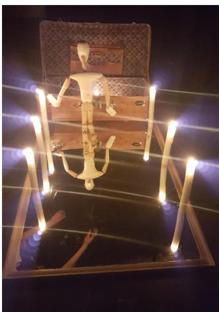
Slika 9: Marioneta pred koferom

Sedma scena, ujedno i posljednja u našoj predstavi bila je rastanak od lutke. Svi animatori zajedno vodili smo lutku od ruke do ruke, prebacujući njezin križ od jednog do drugog sa velikim oprezom. Lutka je hodala po ogledalu između svijeća i svatko od nas morao ju je oprezno voditi da slučajno