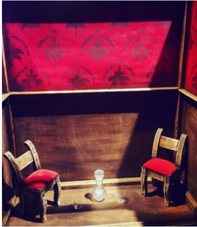
Slika 18: Pravi kovčeg u nastanku

Kovčeg za ručne lutke bio je kvadratnog oblika i iznutra je bio osmišljen kao vrsta saune. Unutar drvenog kovčega oslikano je kao da izgleda da su unutra na zidovima ljestvice, a u kutovima su postavljene suhe biljčice. Taj kovčeg je imao rupu odozdo na dužoj strani, da bi se kroz njega moglo igrati ručnim lutkama, a vrata su mu se otvarala prema publici i visjela prema dole, tako da sakrije animatore tokom igre.