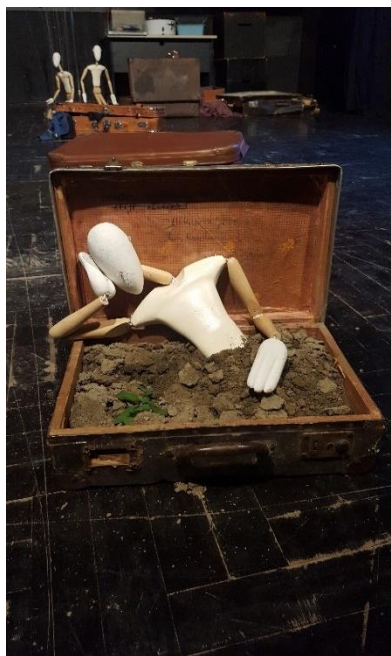
Slika 14: Kofer sa zemljom

Treći najvažniji kofer bio je kofer s notama i jagodama. Unutar tog kofera Alena je instalirala lampice, koje osvjetljavaju marionetu odozdo, dok ona svira po koferu kao po klaviru. Taj je kofer morao biti dovoljno dubok da bi se u njega mogle instalirati lampice, oblijepiti ga notama i, naravno, još dodati jagode. Uspjeli smo pronaći i takav kofer i uspješno ga prilagoditi za scenu.