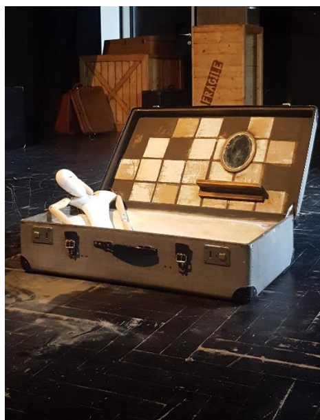
Slika 13: Kofer nakon preuređenja 2

Treći najvažniji kofer bio je kofer s notama i jagodama. Unutar tog kofera Alena je instalirala lampice, koje osvjetljavaju marionetu odozdo, dok ona svira po koferu kao po klaviru. Taj je kofer morao biti dovoljno dubok da bi se u njega mogle instalirati lampice, oblijepiti ga notama i, naravno, još dodati jagode. Uspjeli smo pronaći i takav kofer i uspješno ga prilagoditi za scenu.