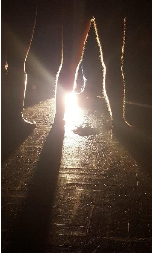
Slika 2: Lutkari na ispitivanju

ostatak publike iz linije sa zida smo izveli vani, gdje ih je na podu dočekala krv ubijenog bjegunca. To je bio kraj. Publika je izašla puna dojmova, neki od njih u šoku i strahu, a neki od njih uzbuđeni. Naš cilj da što vjerodostojnije uprizzorimo život lutkara na frontu bio je uspješno izvršen. Svime ovime zakoračili smo u moguću tematiku našeg daljnjeg rada na diplomskom ispitu iz lutkarstva.