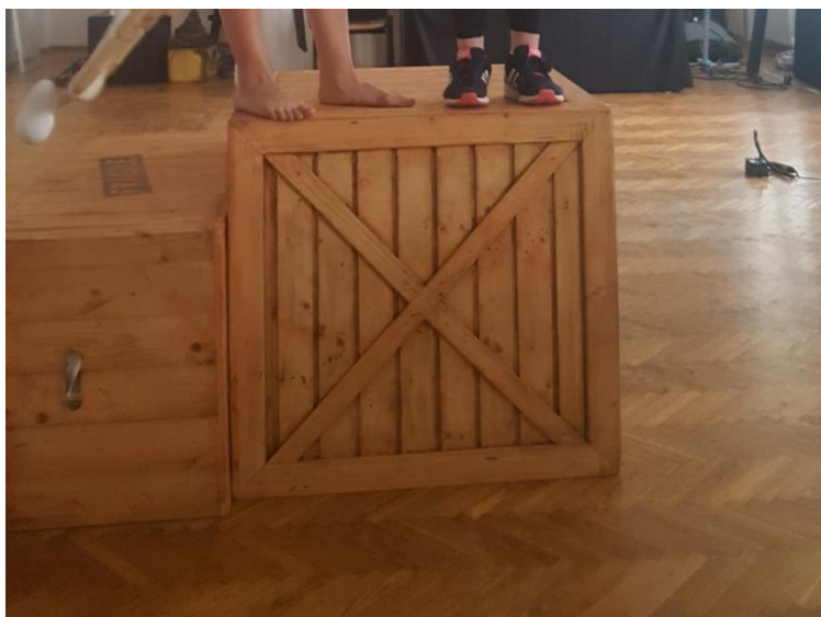
Slika 16: Kockasti kovčeg

No, tu nije kraj našim kovčezima. Neki od najzanimljivijih kovčega, koji su se trebali izraditi, bili su oni za lutke, dakle, kovčezi, u kojima će zaista neke lutke s nama putovati u Italiju, odnosno kovčezi, unutar kojih će se odigravati lutkarske etide s marionetama, ručnim lutkama i štapnim lutkama. Ti kovčezi su imali mogućnost otvaranja te smo tako dobili dojam da publika ulazi u priču, koja se događa unutar kovčega.