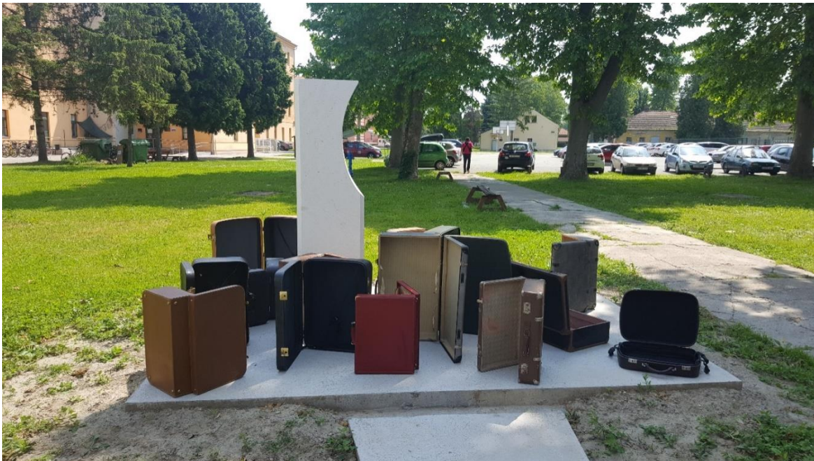
Slika 10: Koferi nakon čišćenja

Sa svim idejama koje smo imali na papiru i u glavi krenuli smo raditi na našoj predstavi. Za početak smo se poigrali s koferima, koji označavaju putovanje negdje. Budući da su naši veliki lutkari stalno putovali po svijetu, tako smo i mi odlučili da će putovanje biti jedna od poveznica naše predstave s njihovim životom. Tako smo se angažirali oko pronalaženja i sakupljanja kofera, koji bi bili adekvatni za lutkarsku igru i koji bi se možda mogli prilagoditi za neku drugu upotrebu unutar predstave. Svoju potragu smo suzili na traženje starinskih kofera, koji su se nekad koristili, a ne današnjih, modernih kofera na kotačiće. Tražili smo kofere, koji su po svojoj strukturi krući, tako da se s njihovim kosturima može nešto izraditi. Budući da smo zamislili određene dijelove gdje bi sami koferi imali drugačiju funkciju, osim prostora za pakiranje robe i potrebitih stvari u njih. Tražili smo ih na raznim lokacijama, ali ipak je odlazak docentice, Tamare Kućinović na tržnicu automobila najviše urodio plodom. Sakupili smo dovoljno kofera s kojima smo mogli početi osmišljavati i dalje graditi scenografiju. Do tog trenutka posjedovali smo samo nekolicinu starih kofera, koje smo našli u fundusu Akademije i koje smo koristili kao moguće opcije unutar igre. No nakon pronalaska novih kofera, zamijenili smo ih, jer su već bili dosta istrošeni.