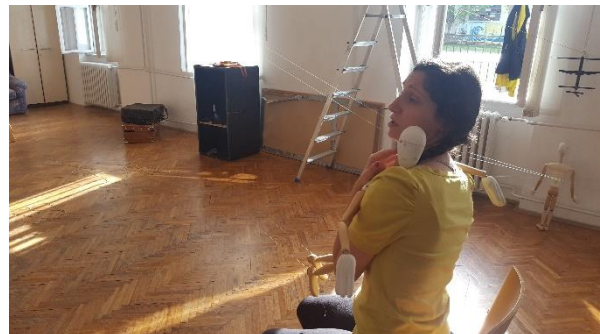
Slika 5: Hvatanje lutke u zagrljaj