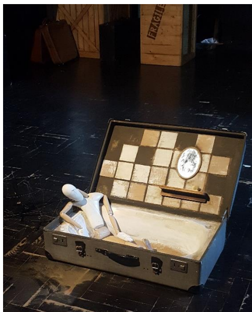
Slika 12: Kofer nakon preuređenja