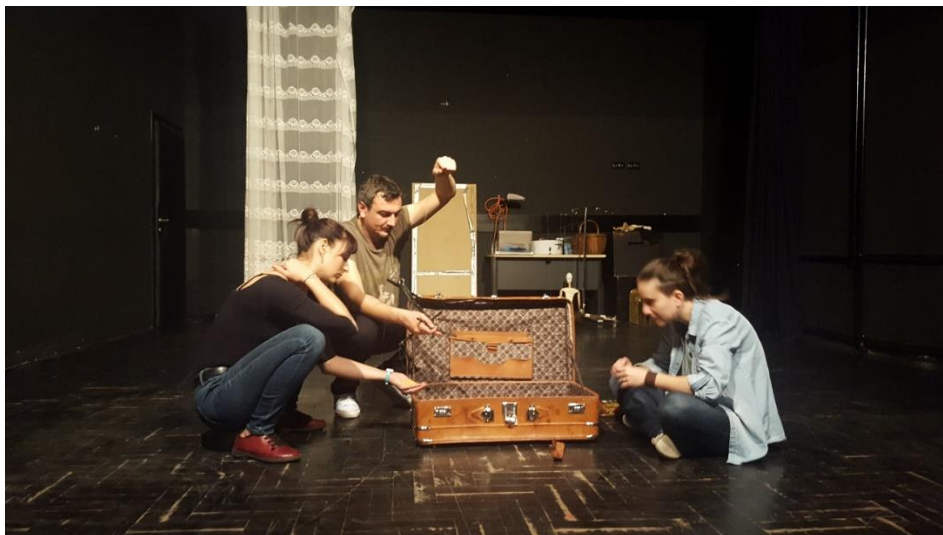
Slika 11: Radni kofer kupatila

Drugi važan kofer bio je kofer u koji se morala instalirati mala kupaonica za marionetu. Taj kofer je morao biti posebno čvrst, tako da smo tražili najčvršći, a opet i dovoljno velik kofer. Nakon što smo ga pronašli, predali smo ga Aleni, a ona je unutar njega ugradila malenu kadu, pločice i ogledalo te držač za četkicu za zube. Nakon što ga je Alena sredila, kofer je poprimio sasvim drugo značenje, nego što je imao do tada.