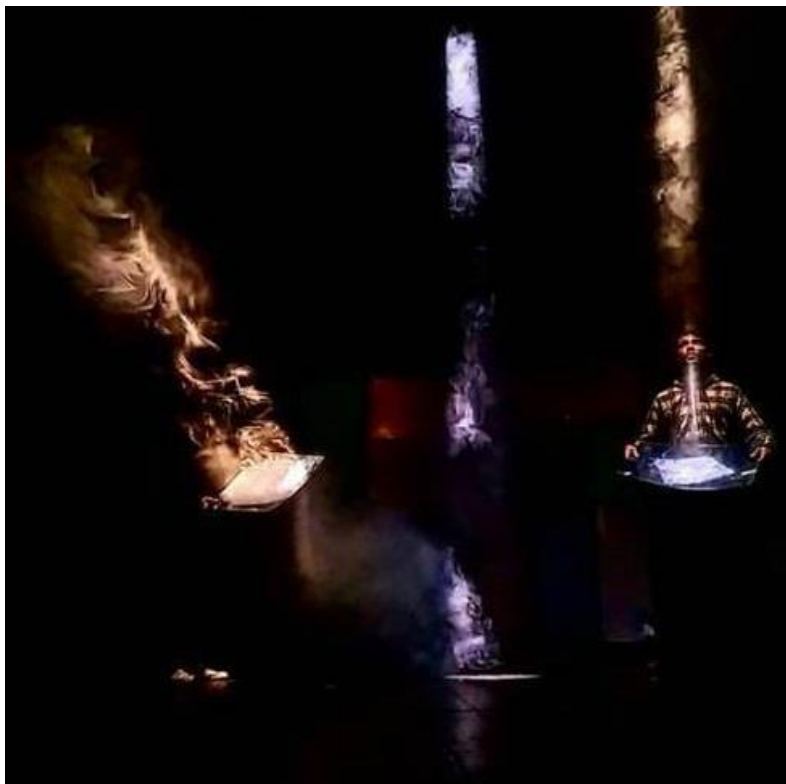
Slika 7: primjer aktivnog korištenja svjetla unutar scene

Oblikovanje svjetla, u predstavama, objektima na sceni (lutkama, glumcima) daje u najjednostavnijem formatu trodimenzionalnost, a ako je ona složena, može biti podjednako bitna i kao radnja i likovi i lutke i glumci jer je, svojim prisustvom na sceni, sama za sebe zasebni lik koji podržava radnju i sami tok predstave. Ako se uz to ona koristi i u dramaturške svrhe samoga teksta i predstave, svjetlost može postati i