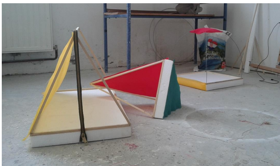
Prilog 2: Maketa Moj kamp