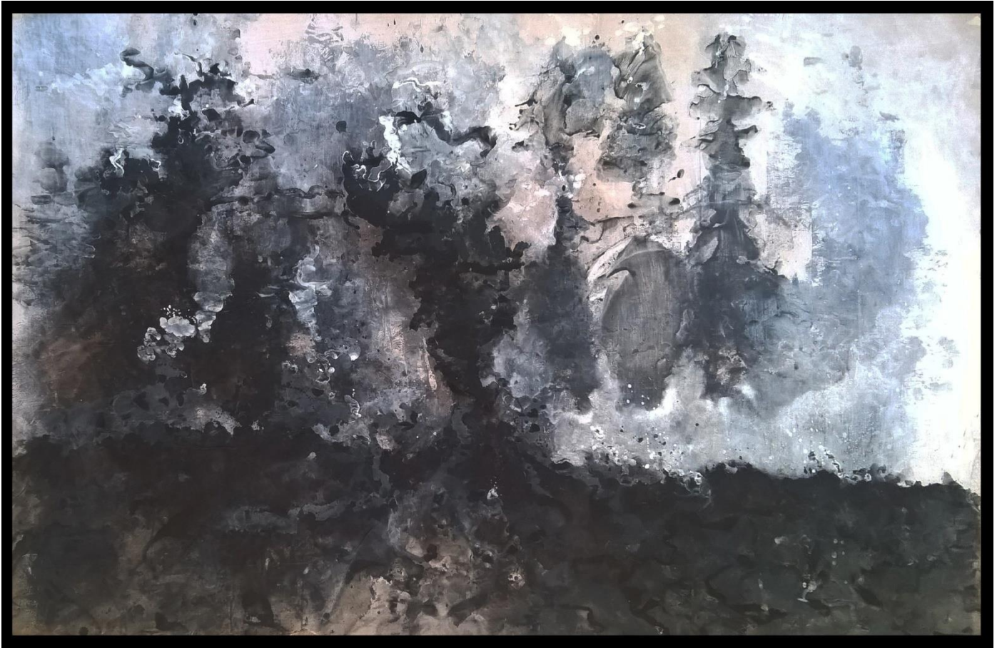
Gotovi rad 1