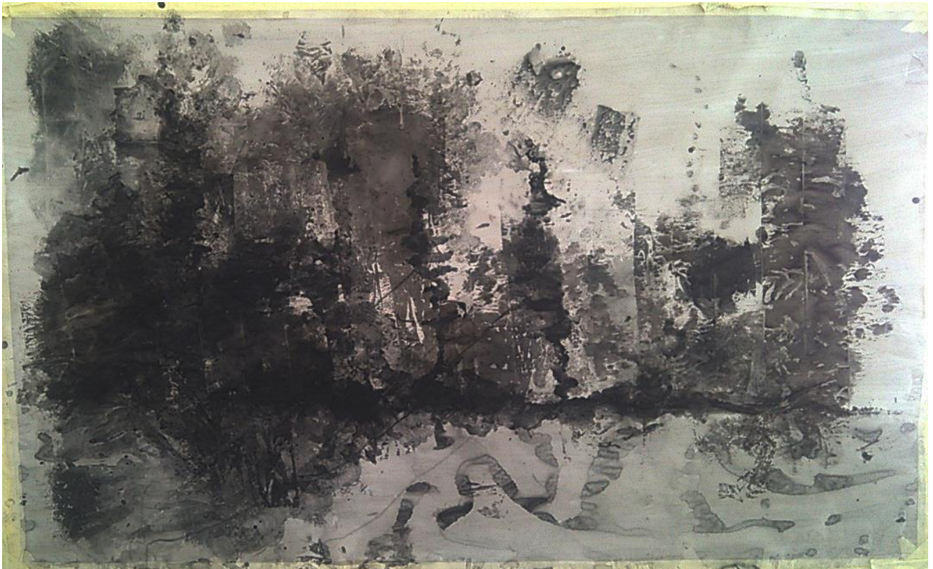
Slika II Prva faza rada

Započinjem sa praznim papirom koji je unaprijed prepariran smjesom sastavljenom od gesso-a, vode i bijelog akrila, te je ljepljivom trakom fiksiran na podu. Nakon toga postavljam sloj maramica ili bilo kojeg papira visoke propusnosti što stvara barijeru između papira i boje, te sprječava nastanak oštrih rubova. Preko maramica nanosim prvi sloj boje, tj. razrijeđeni crni akril, ne vodeći puno računa o kompoziciji. Cij mi je stvoriti stvoriti prozračnu, nedefiniranu podlogu. Nakon toga na cijeli rad polažem drvenu ploču koja služi kao preša koja dodatno razljeva boju. Ponavljam proces prešanja i dodavanja boje dok ne postignem formu koja mi je zanimljiva. Kada prekinem proces prešanja nastupa proces u kojem dodajem čistu vodu na mjesta koja želim dodatno ublažiti. Kako se maramice i papir gužvaju u procesu tako boja prodire u pukotine čime se postiže dodatna razgranata tekstura. U ovoj fazi najmanje koristim kistove jer su mi u ovom trenutku kontrolirani potezi najmanje bitni. Budući da je papir zasićen bojom i vodom lako je pomoću maramica oduzeti višak boje i tekućine. Nakon što dođem do trenutka kada sam zadovoljna prvim slojem, rad ostavljam da se u potpunosti osuši.