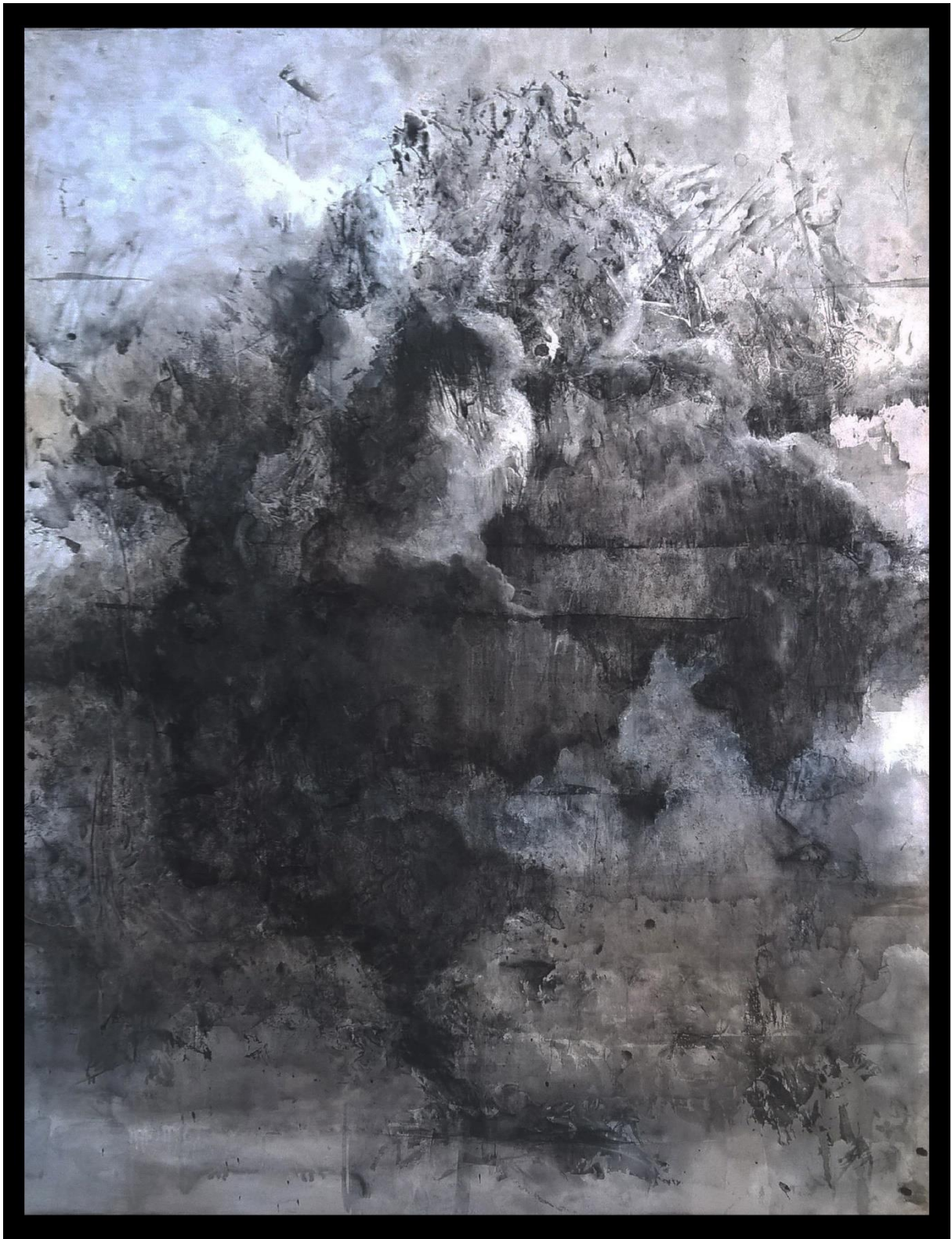
Gotovi rad 2