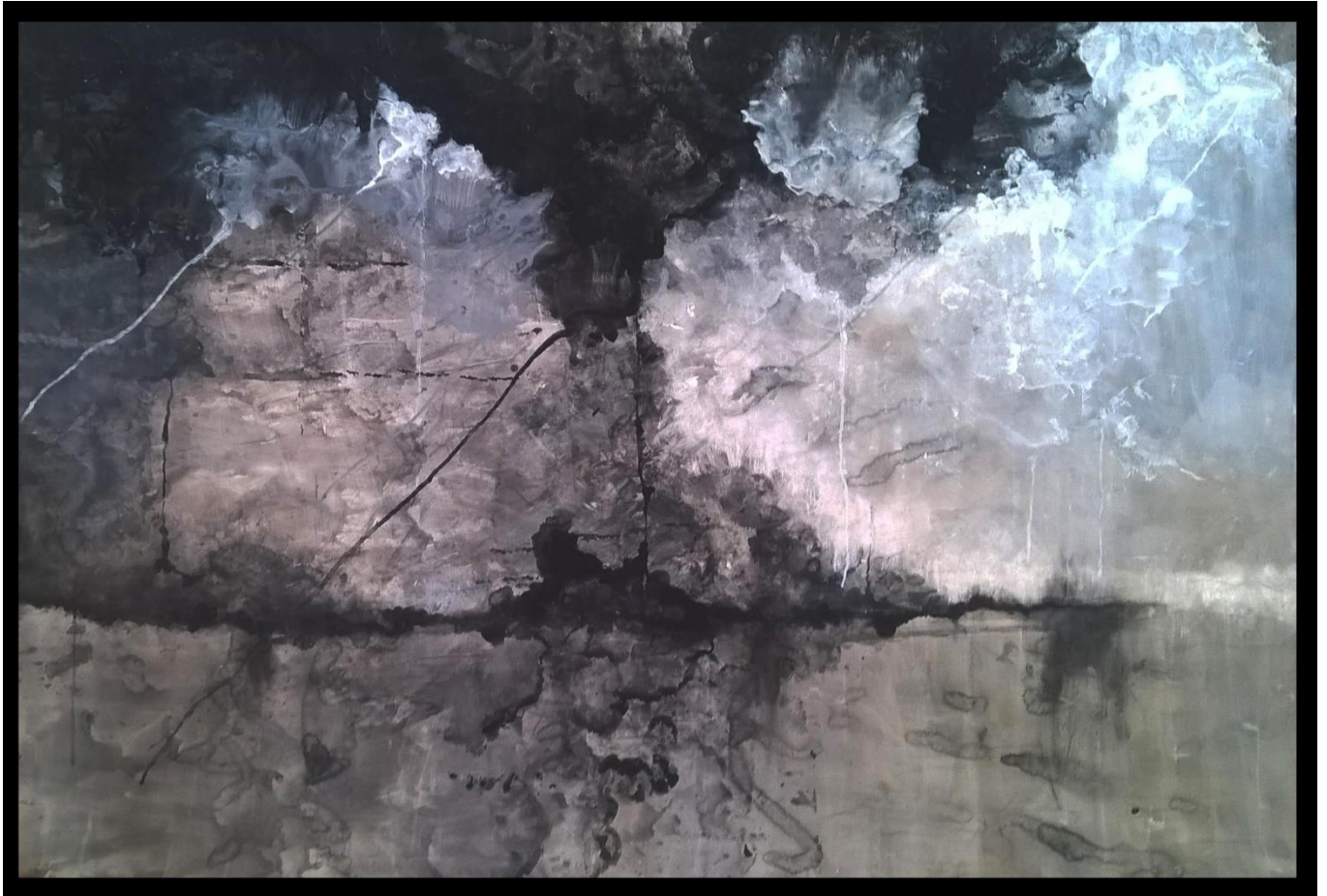
Gotovi rad 4