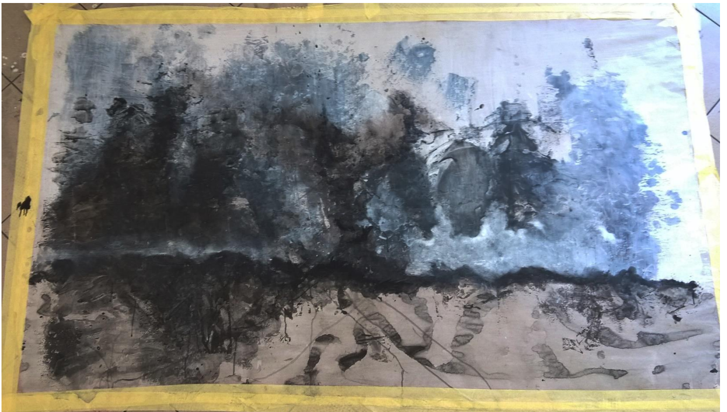
Slika IV Druga faza rada