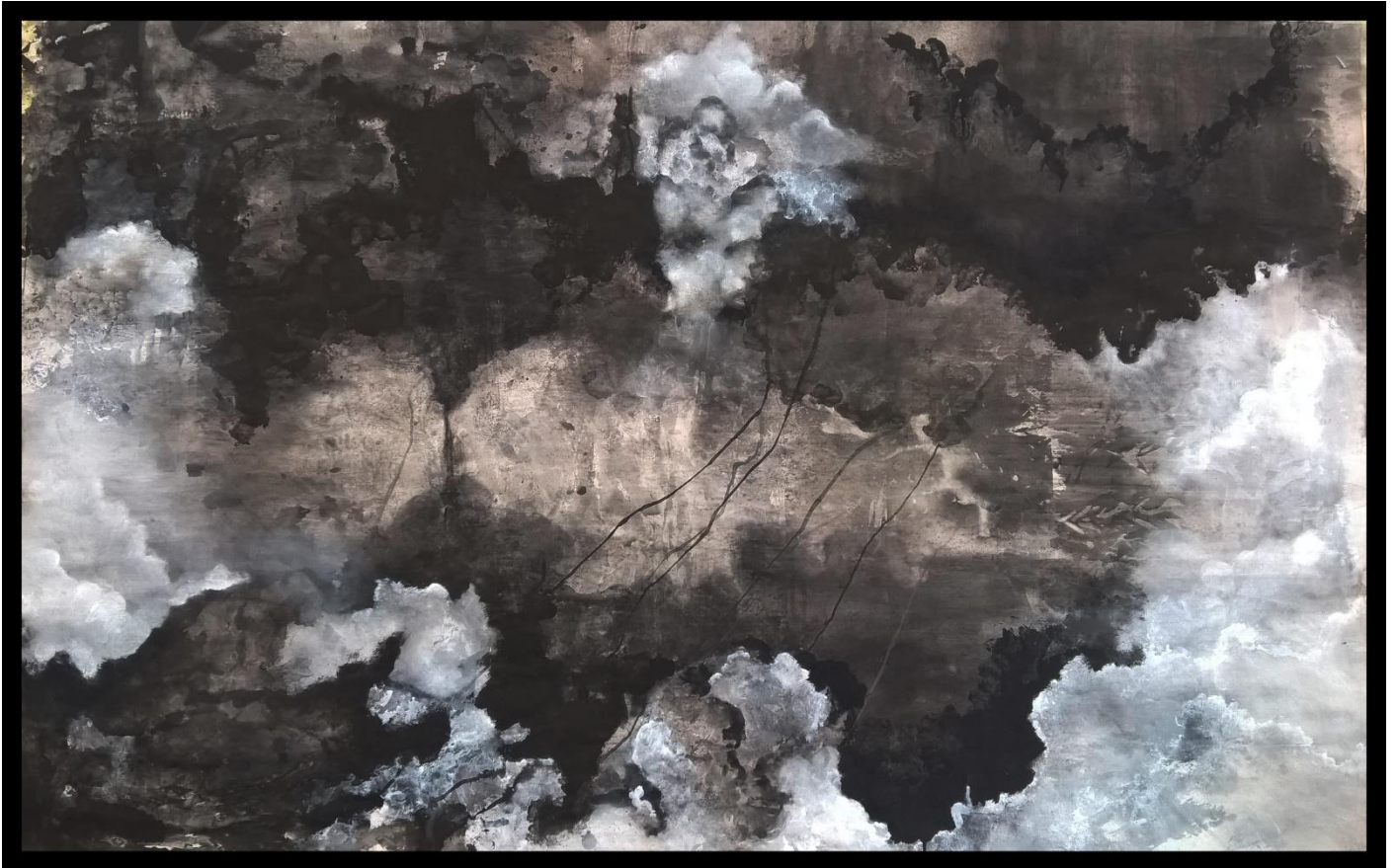
Gotovi rad 3