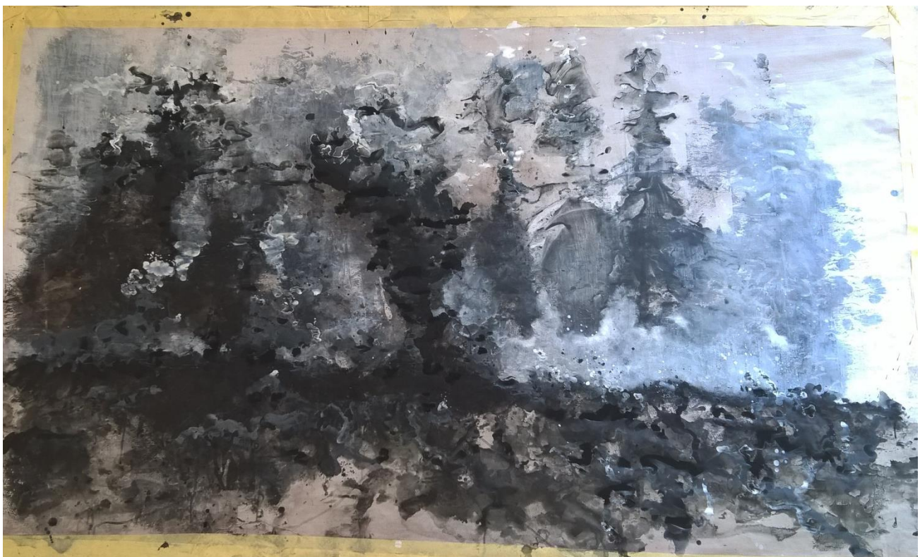
Slika V Treća faza rada

Ugljen i kreda iza sebe ostavljaju prašan i magličast trag što postiže dobar kontrast u odnosu na teške oblike koje stvara akril.