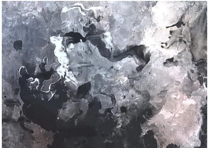
Slika III Detalj

Slijedeća faza procesa uključuje dodavanje novog sloja boje, ali ovog puta dopuštam formiranje nešto oštrijih oblika. Ovdje se počinje stvarati i osnovna kompozicija rada, a također počinjem koristiti bijeli akril kako bih tu kompoziciju dodatno definirala. Povremeno stvaram tzv. lokvice vode na papiru u kojima se crni i bijeli akril mogu slobodno kretati i mješati.