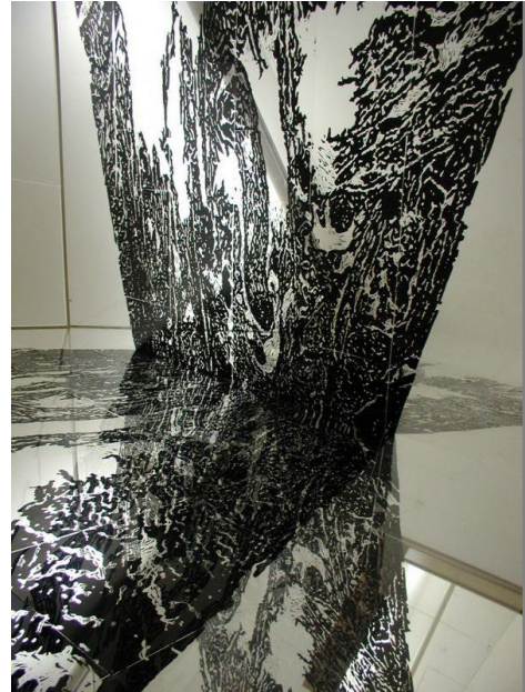
Slika 2. „BABEL“ poledina drvorez na foliji 2007 Slika 3. „PROSTOR“ drvorez na foliji detalj 2007.

koja u ovom slučaju prikladno za motiv uzima modernu ikonografiju nebodera s neonskim reklamama na vrhu zgrade. Dvije identične okomice nebodera, dobivene inverzijom zrcaljenja, spojene su pod kutom prema unutra. Na taj se način “plašt” zgrade iracionalno udvostručuje i razvija, umjesto da zatvara volumen.