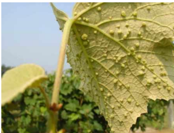
Slika 6: Simptomi filoksere

U matičnjacima američke loze filoksera se suzbija zimskim tretiranjem u vrijeme mirovanja vegetacije. Suzbija se sredstvima na bazi mineralnih ulja i bakra. Na cijepljenoj lozi nije potrebno suzbijanje (Kišpatić i Maceljki, 1984.)