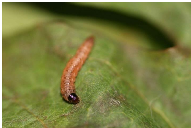
Slika 2: Gusjenica žutog grozdovog moljca