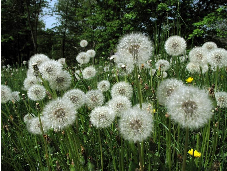
Slika 24. Taraxacum officinale Web. – Ljekoviti maslačak