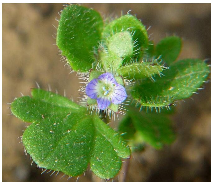
Slika 5. Veronica hederifolia L. – Bršljanasta čestoslavica

Bršljanasta čestoslavica (Slika 5.) je jednogodišnja ozima biljka, visine 5-30 cm. Korijenov je sustav jako razgranjen. Stabljika je pogućla ili se uzdiže, od osnove je jako razgranjena i dlakava. Donji su listovi nasuprotni, srcoliki, s peteljka, a ostali su na stabljici izmjenični i podijeljeni na 3-5 režnjeva. Cvjetovi su na stapkama, ljubičaste ili plave, rjeđe bijele boje, dolaze pojedinačno, u oazušcima listova. Sjemenke klijaju u hladno doba, tj. kasno u jesen ili rano u proljeće, iz površinskog sloja tla. Biljka proizvede oko 200-300 sjemenki (Knežević, 2006.)