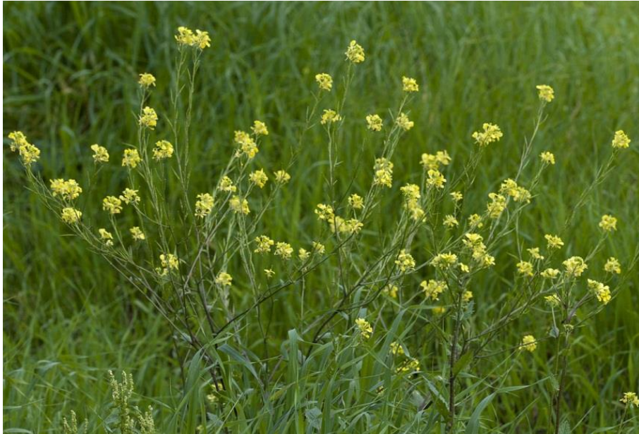
Slika 6. Sinapis arvensis L. – Poljska gorušica