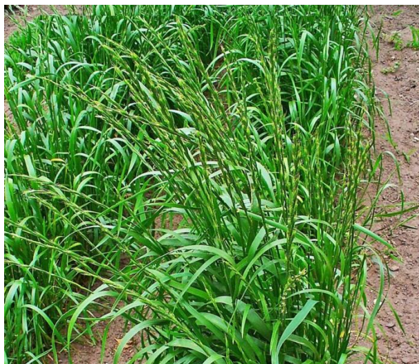
Slika 10. Lolium temulentum L. – pijani ljulj

Pijani ljulj ili debelovlatni ljulj (Slika 10.) je jednogodišnja zeljasta biljka iz porodice trava (Poaceae). Stabljika je uspravna, u gornjem dijelu hrapava, visoka do 80 cm. Listovi su na licu hrapavi, naličje im je sjajno, dugi 6-40 cm, široki 3-13 mm. Klas je uspravan, plosnat, dug oko 20 cm, sadrži mnogobrojne klasiće međusobno razmaknute. Svaki klasić ima 5-9 cvjetova. Cvate u lipnju i srpnju.