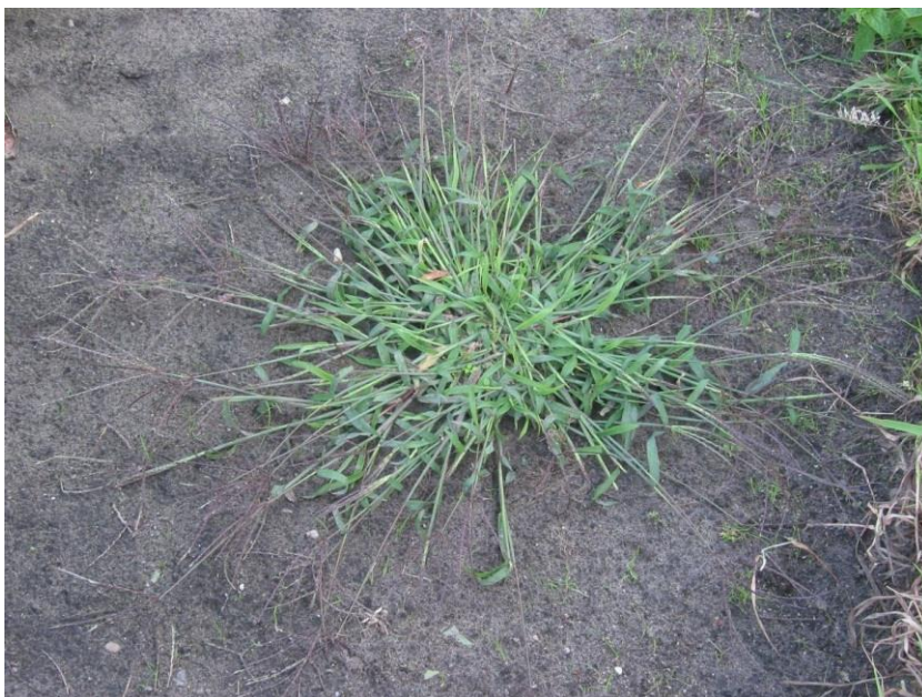
Slika 21. Digitaria sanguinalis (L.) Scop – Ljubičasta svračica

Svrāčica (Slika 21.) je jednogodišnja biljka iz porodice trava (Poaceae). Korijenov sustav je jak i dobro razvijen, stvara mnogobrojne do 50 cm duge stabljike uzdižuće, ili često privijene uz tlo. Listovi su dugi 5-15 cm, široki 5-8 mm, na licu prekriveni mekim dlakama a i rukavci donjih listova imaju dlake. Klasovi su raspoređeni na vrhovima stabljika, nose dvospolne, tamnocrvene boje. Cvjeta u lipnju. U jednoj sezoni stvori do 5000 sjemena.