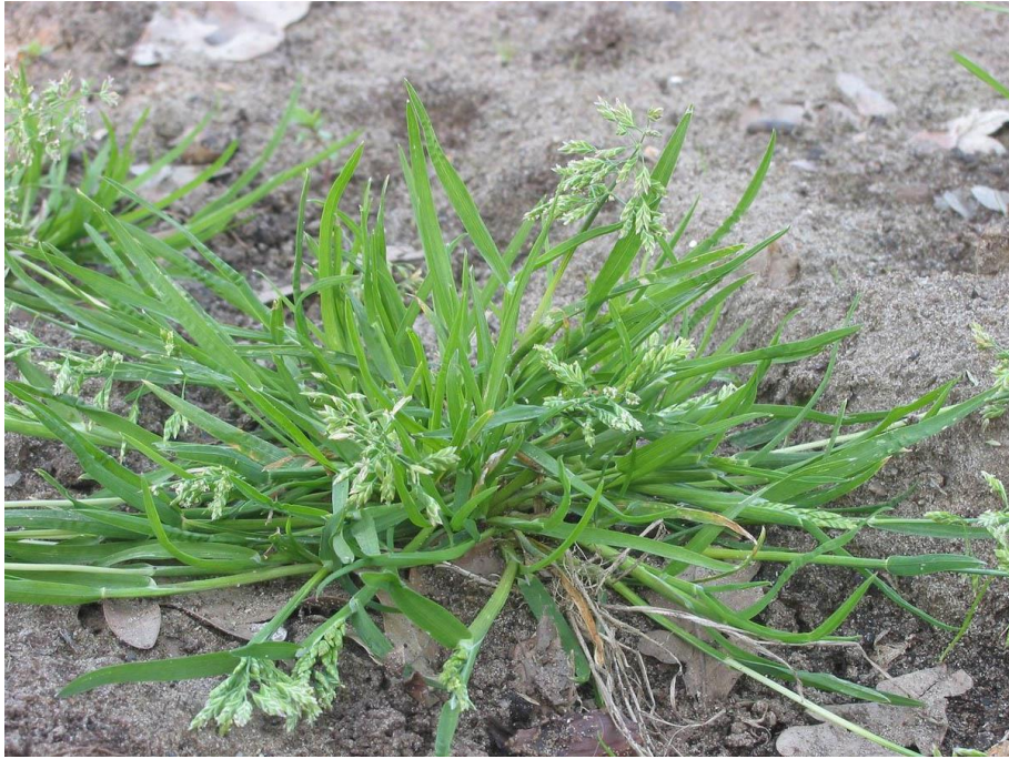
Slika 9. Poa annua L. – Jednogodišnja vlasnjača