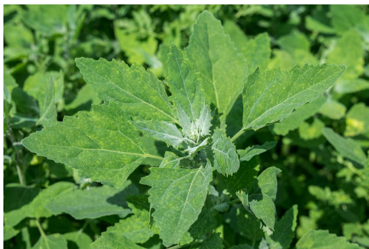
Slika 12. Chenopodium album L. – Bijela loboda

Na licu listova vidljivi je bijeli prah po kojemu je vrsta dobila ime. Cvjetovi su dvospolni, sitni, zelenkasti, skupljeni u razgranate grozdaste cvatove. Cvijet sadrži 5 prašnika i tučak. Cvate od srpnja do rujna (Knežević, 2006.). Nakon oprašivanja stvaraju se brojne sitne, tamne sjemenke koje variraju veličinom, bojom i sjemenom lupinom a razlikuju se i po brzini klijanja. Jedan tip klija brzo, drugi tipovi nakon određene faze dormantnosti. Uočeno je da zadržavaju sposobnosti klijanja i nakon impresivnih 1600 godina. Jedna biljka godišnje može proizvesti i do 800 000 sjemenki, iako ih u prosjeku daje 3000 – 20 000.