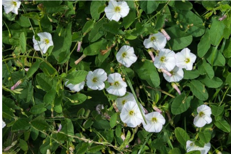
Slika 26. Convolvulus arvensis L. – Poljski slak