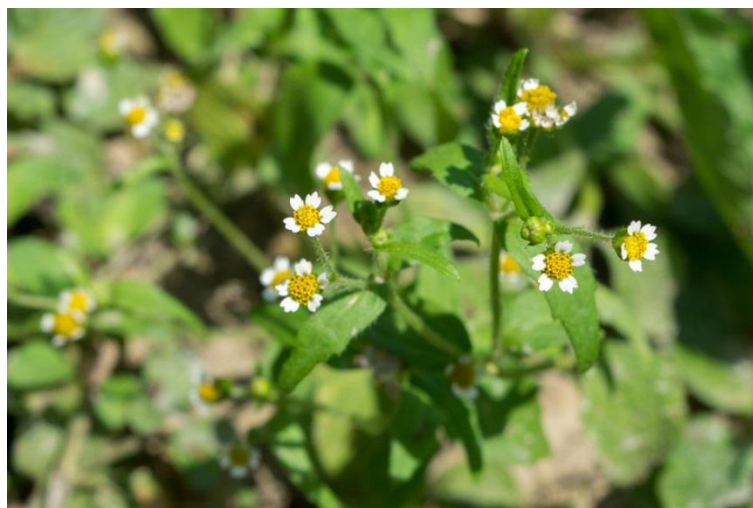
Slika 15. Galinsoga parviflora Cav. – Sitna konica

Sitnocvjetna konica (Slika 15.) je jednogodišnja zeljasta biljka iz porodice glavočika (Asteraceae). Stabljika je uspravna ili polegnuta, razgranata, naraste 20-80 cm visine. Listovi su jednostavni, nasuprotno smješteni i nazubljenih su rubova. Donji listovi su na peteljka, dok su gornji većinom sjedeći. Cvjetovi su mali i smješteni na dugim stapkama, sastavljeni su od središnjih žutih cjevastih cvjetova i pet bijelih jezičastih cvjetova. Cvate od svibnja do listopada. Jedna biljka proizvede 5000 – 300 000 sjemenki koje zadržavaju klijavost i nakon 10 godina. Sjemenke su klijave svježe i mogu dati 2-3 generacije godišnje, sve do pojave mraza.