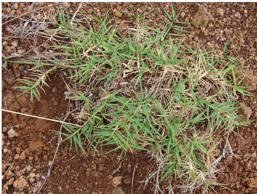
Slika 31. Cynodon dactylon (L.) Pers. – Prstasti troskot

Zubača (Slika 31.) je zeljasta trajnica iz porodice trava (Poaceae). Podanak nosi brojne vriježe i vrlo je dug, naraste i preko 1 metar, ide do 35 cm dubine. Izračunato je da biljka može na jednom hektaru razviti oko 800 km podanaka koji nose nekoliko milijuna pupoljaka. Na koljencima vriježa stvara se adventivno korijenje kojim se ponovno ukorijenjuje. Iz podanka rastu izdanci visoki do 50 cm, iz pupoljaka na vriježama stvaraju se fertilni izdanci. Listovi su lancetasti, kruti, ravni, ušiljeni, slabo dlakavi, rukavci su im goli. Cvjetovi su skupljeni po 3-6 u jednostavne klasove. Cvatu od lipnja do kolovoza. Jedna biljka u godini stvara 1000 – 2000 sjemena, no slabe su klijavosti.