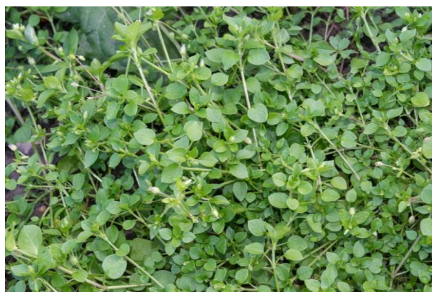
Slika 1. Stellaria media (L.) Vill. – Srednja mišjakinja

Srednja ili obična mišjakinja (Slika 1.) je jednogodišnja zeljasta biljka iz porodice karanfila (Caryophyllaceae). Stabljika je niskog rasta, naraste do 40 cm dužine no uglavnom je polegnuta uz zemlju. Jako je razgranata i tek u jednom redu je prekrivena dlačicama (Knežević, 2006.). Listovi su nasuprotno smješteni, maleni, jajastog oblika, cjelovitog ruba i ušiljenog vrha. Donji listovi smješteni su na peteljci dok su gornji sjedeći – bez peteljke. Cvate tokom cijele godine malim, bijelim cvjetovima sa 10 latica koje su smješteni u parovima kao zečje uši. Sjemenke su česta ptičja hrana.