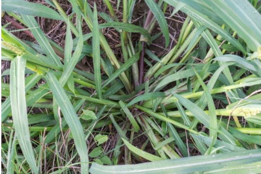
Slika 20. Echinochloa crus-galli (L.) PB. – Obični koštan