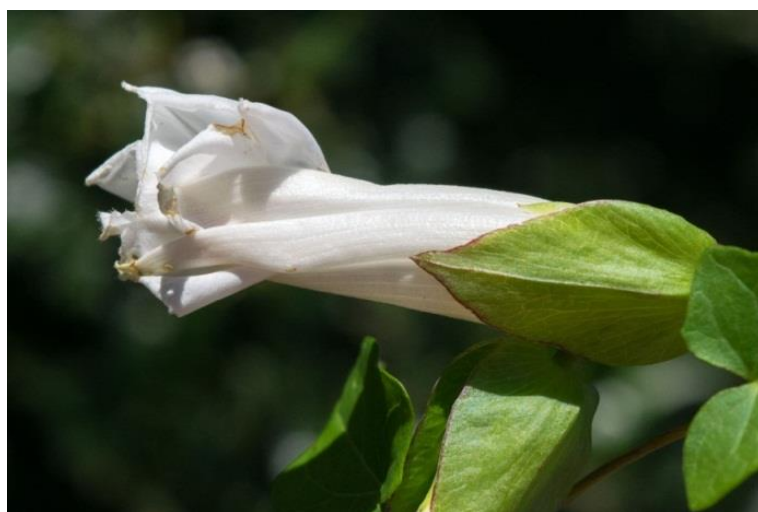
Slika 27. Calystegia sepium (L.) R.Br. – Obični ladolež

Ladolež (Slika 27.) je višegodišnja zeljasta biljka iz porodice slakova (Convolvulaceae). Stabljika je duga i do 3 metra a raste obavijajući se oko drugih biljaka pored kojih raste. Korijen je razgranat i dobro razvijen. Listovi su strelasti, dugi 5-10 cm, široki 3-7 cm, cjelovitog no malo valovitog ruba i ušiljeni na vrhu. Cvjetovi su pojedinačni, veliki, ljevčkasti i bijele boje, nalaze se u pazušcima gornjih listova. Cvate od lipnja do rujna. Plod je okruglast tobolac koji sadrži 3-4 crne sjemenke. Jedna biljka godišnje proizvede 100-400 sjemenki koje obično kličaju u proljeće. Razmnožava se sjemenom, korijenom i nadzemnim izdancima koji se ukorjenjuju u dodiru sa zemljom.