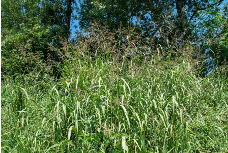
Slika 33. Sorghum halepense (L.) Pers. – Piramidalni sirak