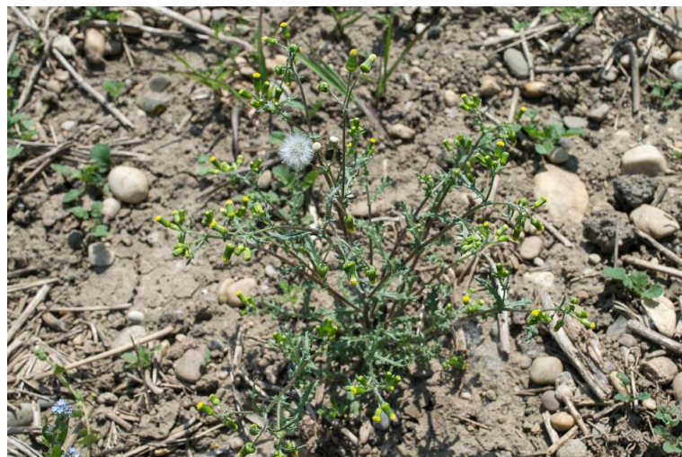
Slika 7. Senecio vulgaris L. – Obični staračac

Obični staračac (Slika 7.) je jednogodišnja ili dvogodišnja zeljasta biljka iz porodice glavočika (Asteraceae). Stabljika je uspravna, razgranata od osnove i naraste do 50 cm visine. Listovi su naizmjenični, plitko urezani, donji listovi nalaze se na peteljka dok su gornji sjedeći. Cvjetovi su žuti, skupljeni u izdužene cvatove, čine ih cjevasti cvjetovi u sredini, jezičasti cvjetovi nedostaju već cijeli cvat izgleda kao da se nije još otvorio. Cvate od ožujka do listopada. Plod nema papus. Jedna biljka godišnje proizvede do 7000 sjemenki koje zadržavaju klijavost do tri godine.