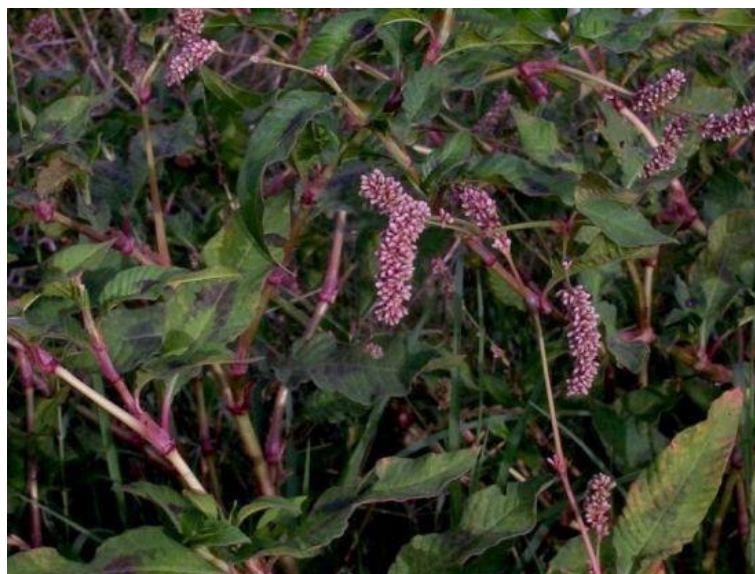
Slika 34. Polygonum lapatifolium L. – Kiseličasti dvornik