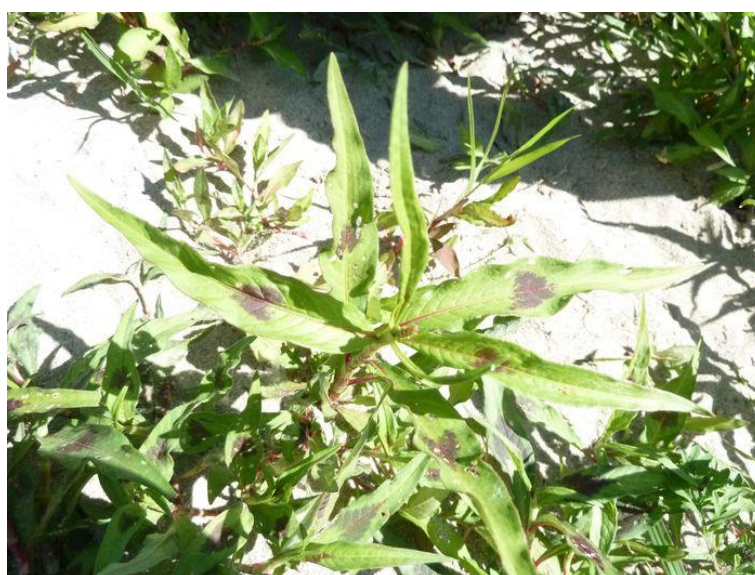
Slika 35. Polygonum persicaria L. – Pjegasti dvornik

Pjegasti dvornik (Slika 35.) je jednogodišnja biljka, visine od 10 do 60 cm. Stabljika je razgranjena i člankovita. Listovi su izmjenični, sivkasto zeleni, često s tamnom pjegom, lancetasti, s produženim, šiljastim vrhom. Cvjetovi su sitni, sa zelenkastobijelim, ružičastim ili crvenim perigonom, sakupljeni po 1 do 3 u gustim, klasastim cvatovima. Plod je sroliki, sjajni oraščić, s jednom sjemenkom. Sjemenke kličaju kasno u proljeće. Biljka proizvede do 800 sjemenki (Knežević, 2006.).