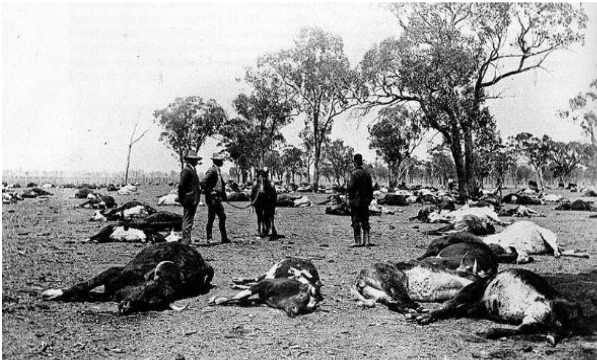
Slika 2. Trovanje stoke

Mnogi korovi imaju štetne kemikalije koje služe kao obrana od drugih organizama ili imaju alelopatski utjecaj na druge biljke. Kod neodržavanih pašnjaka može doći do razvijanja opasnih otrovnih korova koji mogu dovesti do uginuća domaćih životinja (Slika 2.). Korovi poput kantariona ( Hipericum perforatum ) (Šarić, 1985) sadrže otrovne tvari koje mogu ozbiljno ugroziti zdravlje životinja. Neke biljke sadrže cijanovodičnu kiselinu koja može ostati u proizvodima životinja koje su se njima hranile.