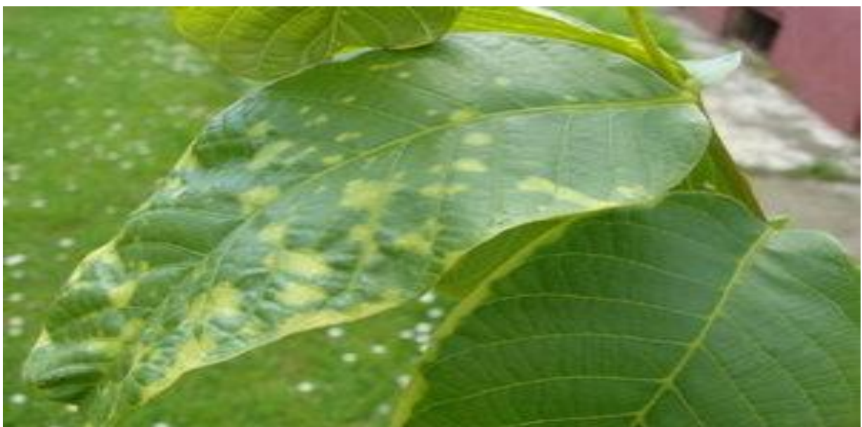
Slika 13 . Oštećenje na orahu

Najčešći razlozi pojave fitotoksikoze su primjena prevelike doze, zanošenje vjetrom, primjena u nepovoljnim vremenskim prilikama, kriva fenofaza, osjetljive sorte kulturnih biljaka, rezidualni ostaci i neispravnost sredstva. Neispravnost prskalice je čest uzrok pretjerivanja količine sredstva. Često kod korištenja orošivača u voćnjacima i vinogradima zbog drifta dolazi do većeg gubitka zaštitnog sredstva, koje može uzrokovati trovanje kod ljudi, životinja i divljači (Barčić, 2001). Zanošenje se javlja kod prskanja pri jakom vjetru te bi se zbog ovoga razloga herbicidi trebali primjenjivati pri mirnom vremenu. Herbicidi mogu ostati duže vrijeme u tlu ili u vodama te u tom vremenu biti aktivni. Njih tada mogu usvajati biljke koje nismo htjeli tretirati. Preko prevelikih tretiranja dolazi da nakupljanja kemikalija u biljkama, te biljke nisu pogodne za ljudsko zdravlje. Mnoge od tih kemikalija mogu biti aktivne u tlu nekoliko godina poput atrazina, trifluarina, itd. Neki korovi ostaju u biljnim proizvodima i dijelovima koji se koriste u ljudskoj i životinjskoj ishrani te tako dođe do sekundarnog trovanja.