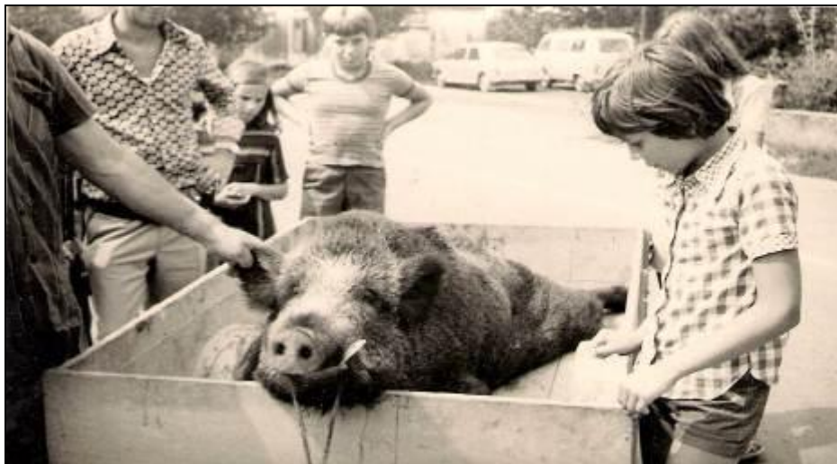
Slika 1: Prva divlja svinja odstreljena na otoku Krku 1974. g.