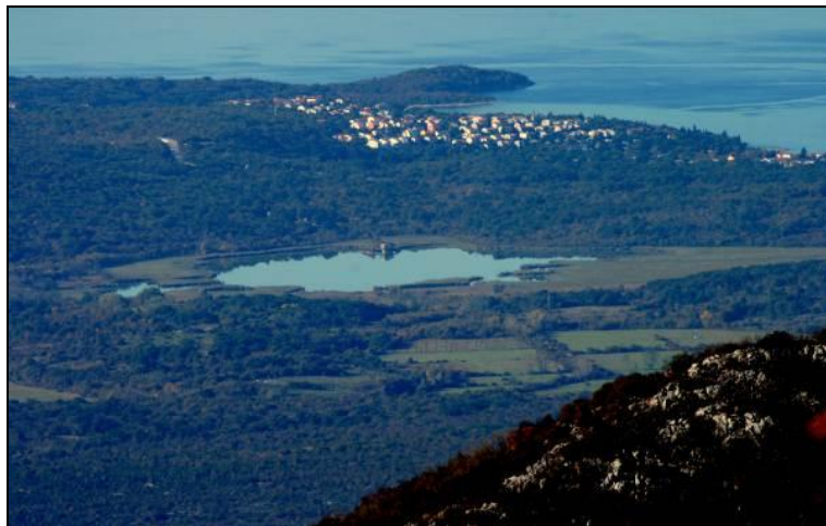
Slika 9: Pogled na otok Krk iz Fužina - lovište VIII/101 Krk