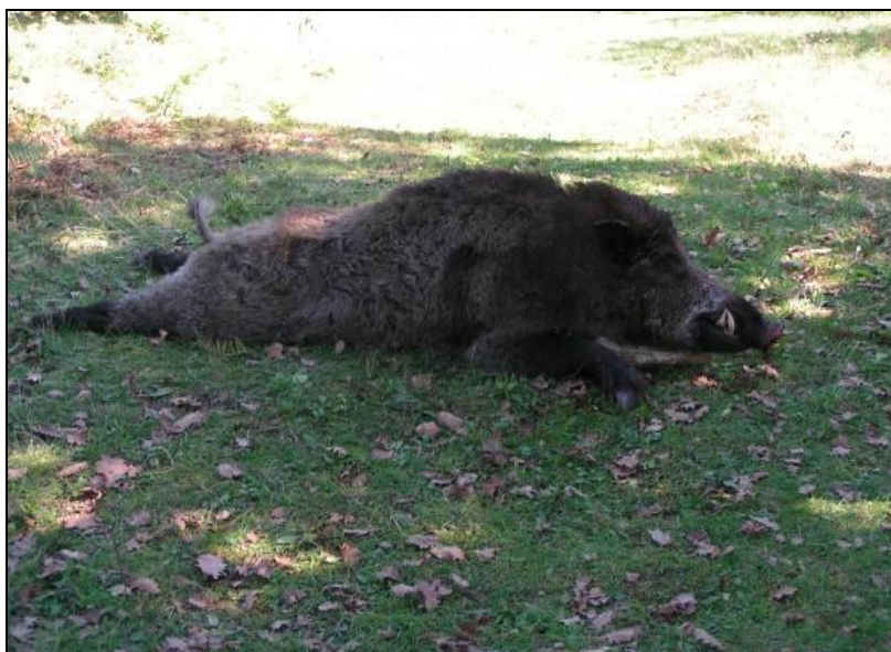
Slika 19: Vepar sa zlatnim trofejom; odstreljen u lovištu VIII/101 Krk 18. studenog 2007., lovac Mauro Mičetić, ocijenjen sa 124,15 točaka

Veoma je atraktivna lovna divljač. Zauzima veliki postotak odstreljene krupne divljači u Republici Hrvatskoj. U pravilu lov se dijeli na pojedinačni i skupni lov. Pojedinačni lov je najčešći način lova. Vršiti se na način dočekivanja divljači s lovačkih čeka ili zasjeda koji se nalaze najčešće u blizini poljoprivrednih kultura pred zriobom. Pojedinačnim načinom lova često se lovi šuljanjem, pretraživanjem uz pomoć psa ili slučajnim susretom. Skupni lov je specifičan i zanimljiv zbog više razloga. Divlja svinja je jedina vrsta krupne divljači u Hrvatskoj koja se smije loviti u skupnom lovu uz upotrebu pasa i upotrebom oružja sa glatkim cijevima. Najčešći je za vrijeme zimskih mjeseci i spada u jedan od najatraktivnijih lovova pružajući potpuni lovni užitek (GRUBEŠIĆ, 2004.) .