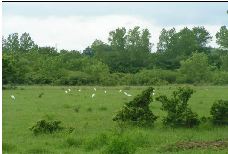
Slika 8: Pogled na centralni dio otoka Krka, «Omišljanski lug» - lovište VIII/101 Krk