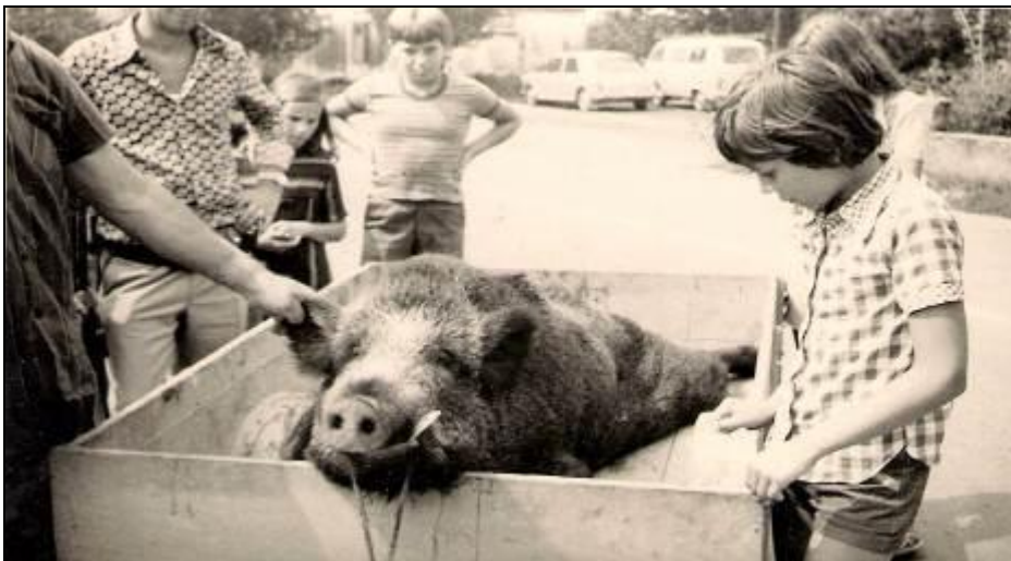
Slika 1: Prva divlja svinja odstreljena na otoku Krku 1974. g.