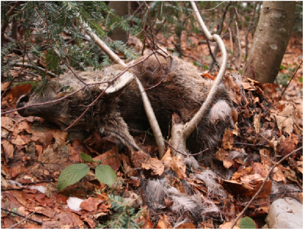
Slika 3. Risov plijen