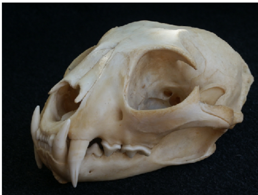
Slika 6. Lubanja risa

Pojava drugog donjeg kutnjaka M2 (5,1%) je, međutim, niža u odnosu na druge populacije. Ris ima 28 zubi , zubne formule I 3/3, C 1/1, P 2/2, M 1/1. Lubanje muških jedinki su veće u odnosu na lubanje ženskih jedinki. Ovim istraživanjem utvrđeno da se kranimetrijske vrijednosti populacije balkanskog risa, statistički značajno ne razlikuju od hrvatske i češke populacije.