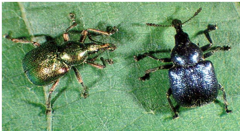
Slika 27. Cigaraš

Suzbijati se može skidanjem i uništavanjem tuljaca (cigara) zajedno s ličinkama i jajima čime smanjujemo napad naredne godine. Odrasle pipe su dobro primjete pa se također mogu skupljati i uništavati. Kemijsko zaštita se može provesti u vrijeme dok je broj tuljaca još malen, a odrasli cigaraši su brojni. Najpovoljniji rok za kemijsko tretiranje je u svibnju. Od insekticida koriste se oni na bazi endosulfala, fentiona, fosalona, fenitrotiona.