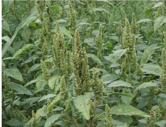
Slika 32. Štir

Nema registriranih herbicida za upotrebu u štiru, pa se zato korov suzbija samo mehanički. U početku raste sporo i tada je neophodno držati korov pod kontrolom sa nekoliko kultiviranja i okopavanja.