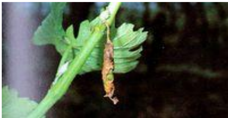
Slika 28. Cigaraš na listu