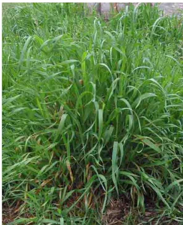
Slika 31. Pirika

Hrvatski naziv: Pirika, puzava pirika, tkalac, vornica, pirevina, troskot, pirac, plazeča pirnica, perika, perikovina. Pirika je često nepoželjan gost vrtova. Podanak biljke raste brzo i duboko te ga je nemoguće iskorijeniti jer se veoma lako miješa s onim što se uzgaja u vrtu. To je trajna biljka; dosadan i žilav korov po njivama i vlažnim poljima. (Hulina, 1998.) Širi se podzemnim puzavim rizomom. Nadzemni dio naraste i do 1,2 metra (Slika 31.) Cvjetovi su udruženi u dugim dvorednim klasovima dugačkim i do 10 centimetara. Biljka cvjeta cijelo ljeto.