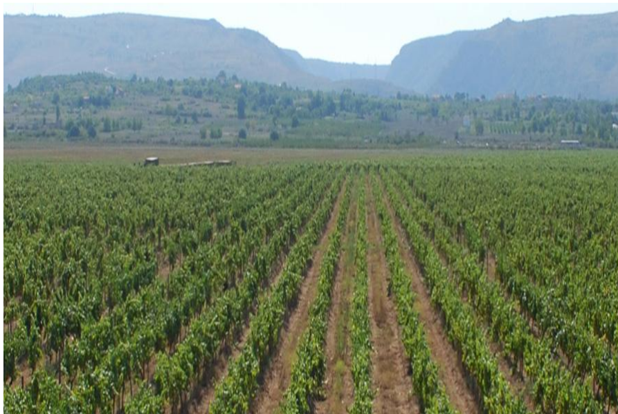
Slika 13. Vinograd Tepčić