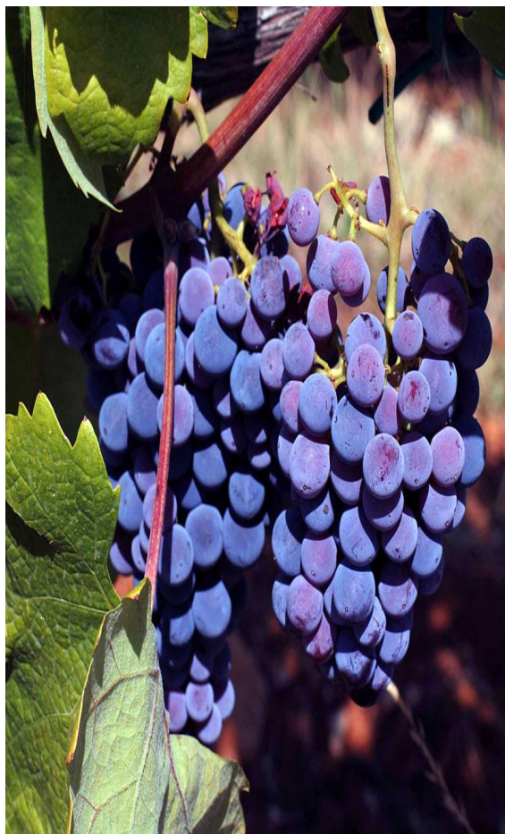
Slika 15. Plavac mali

tomu su svakako tvrda kožica bobice i čvrsta građa. Postoji dosta raznolikosti u botaničkim obilježjima između tipova populacije plavca. Veličina, oblik i težina grozda i bobice znatno variraju. Odrasli list je peterokutan, srednje veličine. Rebra na naličju lista su gola i baršunasta uz plojku. Naličje lista je paučinasto.