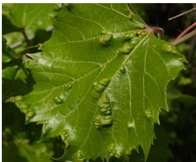
Slika 26. Lozina grinja šiškarića-erinoza