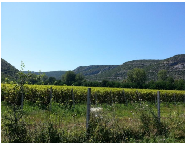
Slika 40. Vinograd Žitomislići (foto: Marin Hurdubae)