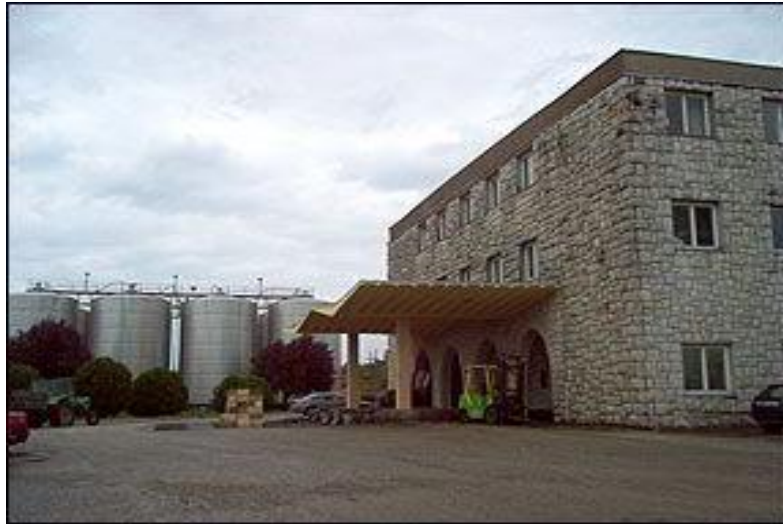
Slika 12. Vinarija Čitluk

Vinogradi koji se nalaze u sklopu vinarije: Kameni vinogradi, Dubrava (stara i nova plantaža), Kručevići, Tepčići, Konjuši (vinograd, voćnjak maslenik), Žitomislići 1 (gornje polje), Žitomislići 2 (donje polje).