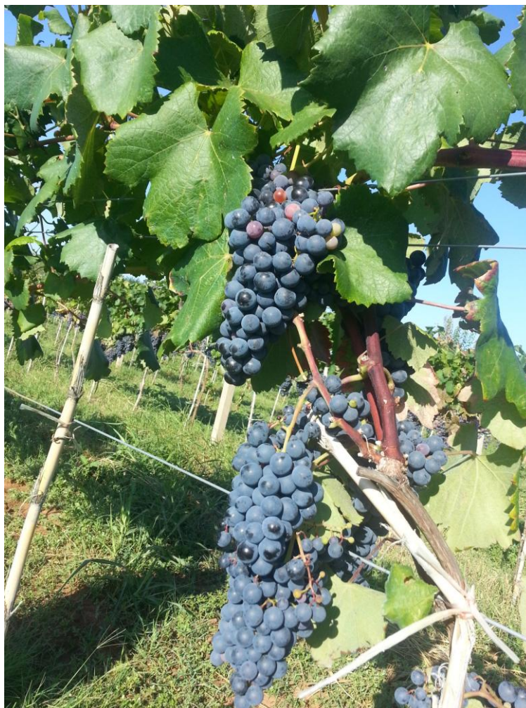
Slika 4. Trnjak

su slabog antocijanskog obojenja. Mladi list je zelene boje s jako izraženim vunastim dlačicama na naličju. Odrasli list je peterodijelnog oblika s tri isječka. Površina plojke je glatka, zupci su pravilni i šiljasti. Sinus peteljke je otvoren i u obliku slova U. List je gol i bez dlačica. Spada u listove srednje veličine. Cvijet je morfološki i funkcionalno hermafroditan, a na mladici se uglavnom nalaze po tri cvata. Grozd je kratak, srednje je veličine, piramidalan i zbijen (Slika 4.). Bobica je okruglasta, srednje veličine, izrazito tamne modre boje, neobojenog i čvrstog mesa.