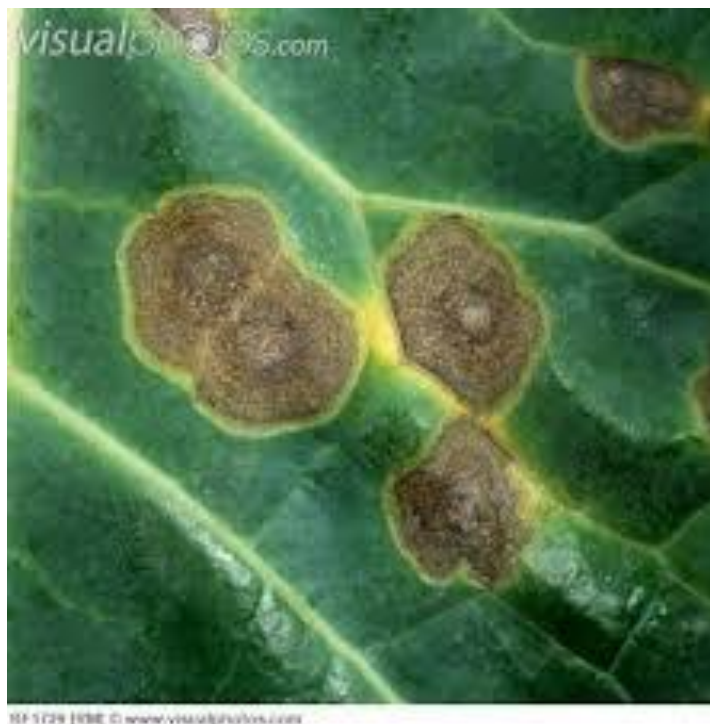
Slika 1. Alternaria brassicae