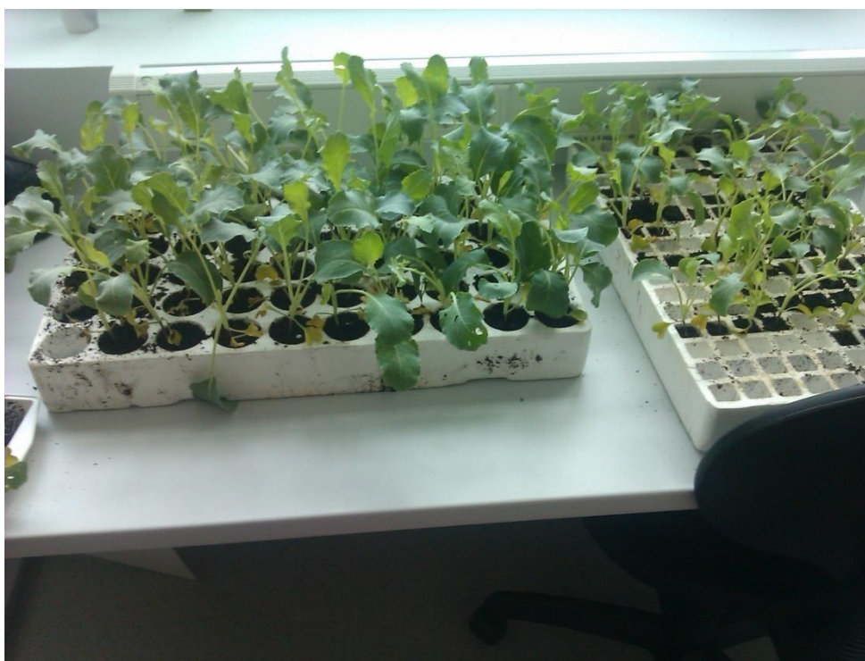
Slika 5. Presadnice u polisterinskim kontejnerima različitog volumena tla

Kontejneri koji su se koristili su polistirenski, dužine 50 cm i širine 33 cm, s 209 sjetvenih mjesta i sa 60 sjetvenih mjesta (Slika 5). Od svake je sorte posijano po 40 biljaka u kontejner s 209 sjetvenih mjesta i 40 biljaka u kontejner sa 60 sjetvenih mjesta. Sveukupno je bilo posijano 160 biljaka od kojih je bilo 40 od svake sorte u kontejnerima s 209 sjetvenih mjesta i 40 od svake sorte u kontejnerima sa 60 sjetvenih mjesta. Kontejneri su se punili supstratom za povrćarske kulture Klasmann potgrond P. To je mješavina smrznutog crnog sphagnum treseta i finog bijelog sphagnum treseta. Dodano vodotopivo gnojivo i mikroelementi. Supstrat je fine strukture 0-5 mm i pH vrijednosti 6. Takav supstrat preporuča se za kontejnere i hranjive kocke do 6 cm.