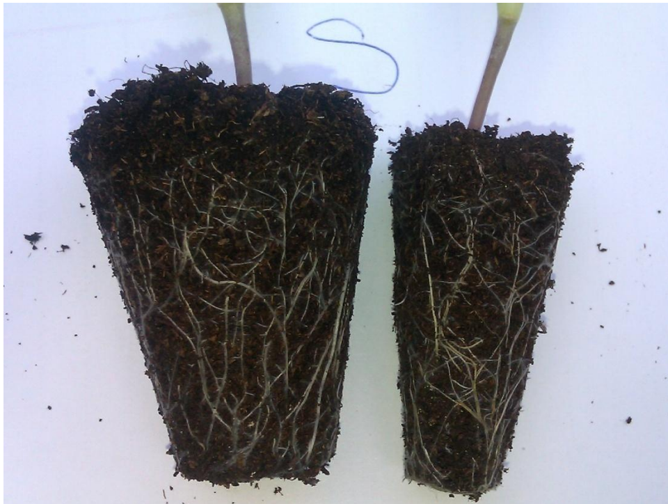
Slika 11. Korijenje presadnica Originalna fotografija