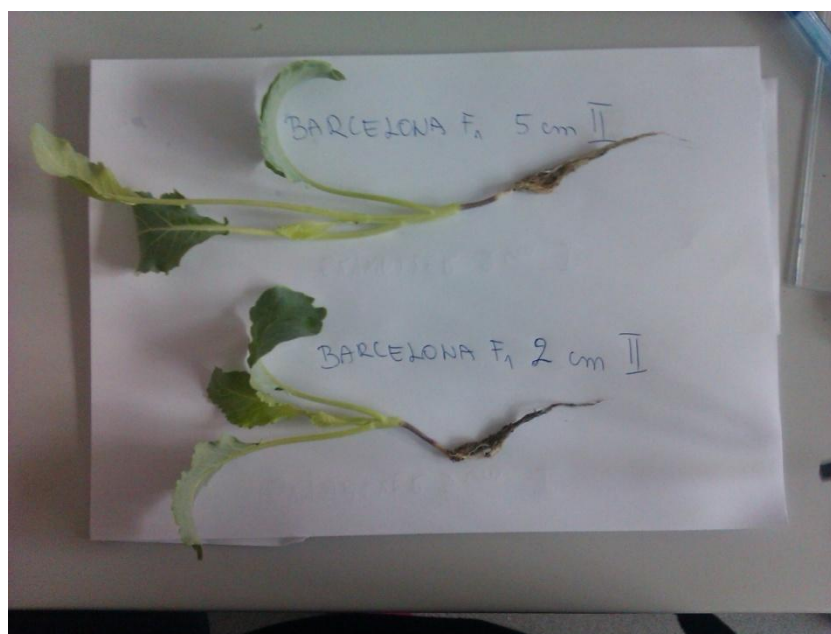
Slika 9. Usporedba presadnica hibrida Barcelona F1 u različitom volumenu tla