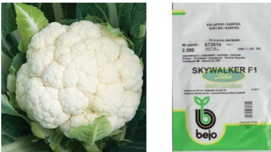
Slika 4. Hibrid Skywalker F1 ( http://www.bejo.hr/hr/asortiman/konvecionalno-sjeme/kupusnja%C4%8De.aspx )