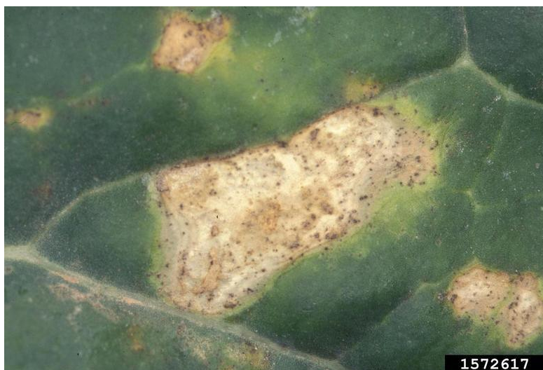
Slika 2. Hyaloperonospora parasitica

( http://www.pfos.hr/~jcosic/Parazitski%20uzro%C4%8Dnici%20bolesti%20povr%C4%87a%20i%20cvije%C4%87a.pdf ).