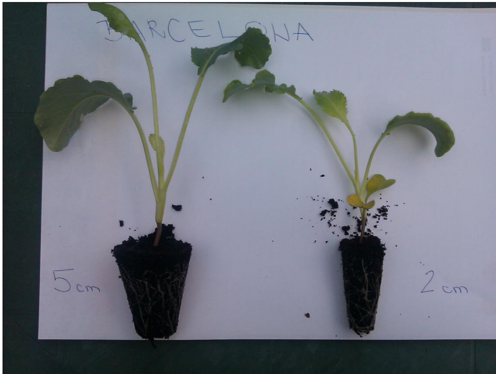
Slika 10. Presadnice uzgojene u različitim volumenima tla Originalna fotografija