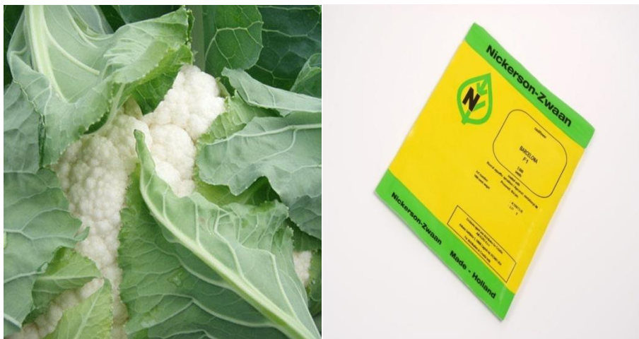
Slika 3. Hibrid Barcelona F1 ( http://www.am-agro.hr/gallery/cvjetaca/ )

Pokus je bio postavljen u četiri ponavljanja, gdje su se koristila dva hibrida cvjetače i kontejneri različitog volumena supstrata. Za sjetvu cvjetače koristili su se hibridi Barcelona F1 i Skywalker F1. Barcelona F1 (Slika 3) je hibrid za kasnu ljetnu ili jesensku proizvodnju, odlikuje se dobro zaštićenom, kompaktnom, bijelom cvati izuzetne kvalitete, nije osjetljiv na pojavu ljubičaste nijanse cvata, a vegetacijatraje 70-75 dana (slika 1). Kasni hibrid Skywalker F1 (Slika 4) karakterizira dobro samopokrivanje, zbijen, težak cvat, za jesensku proizvodnju, sadi se u lipnju i srpnju, a razdoblje vegetacije je oko 96 dana.