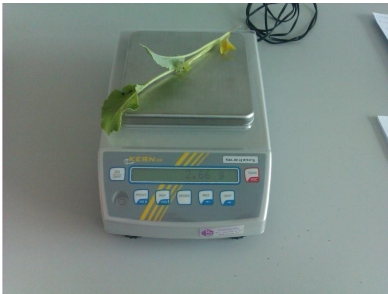
Slika 6. Vaganje nadzemnog dijela presadnice Originalna fotografija

Ovim istraživanjem ispitivali su se slijedeći parametri: utjecaj volumena supstrata te hibrida na visinu i masu nadzemnog dijela presadnice, dužinu i masu korijena presadnice cvjetače te broj listova presadnice cvjetače. Mjerenje visine i mase presadnica prikazano je na slici 6 i 7.