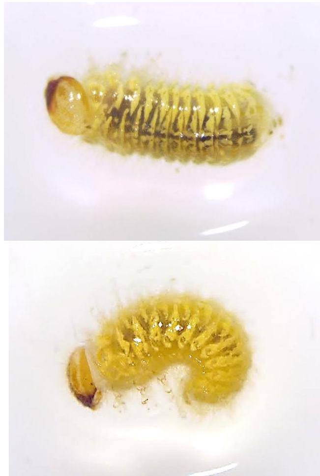
Slika 3. Lasioderma serricorne F. – duhanar (ličinka)