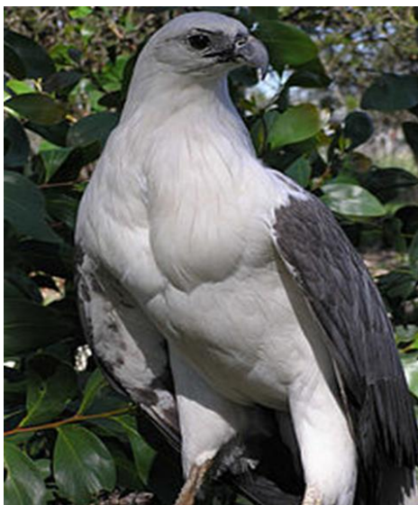
Slika 5. Bjeloprsi orao ( http://en.wikipedia.org/wiki/White-bellied_sea_eagle )

Bjeloprsi orao (Slika 5) u srodstvu je sa Sanfordovim orlom. Odrasli orao ima bijelu boju ispod krila, na prsima, glavi i repu, dok su gornji dijelovi sivi i crni. Kao kod mnogih predatora, ženke su malo veće od mužjaka i mjere do 90 cm dužine, s rasponom krila do 2,2 m i masom oko 4,5 kg. Mladi orlovi imaju smeđe slojeve perja koji se postupno mijenjaju bijelom bojom do dobi od 5 do 6 godina. Obitava na području Indije, Šri Lanke, jugoistočne Azije do Australije na obalama velikih vodenih puteva.