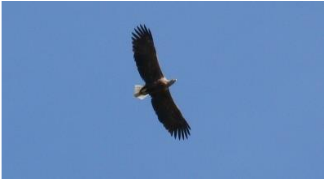
Slika 1. Orao štekavac u letu iznad Kopačkog rita

Orao štekavac ili bjelorepi orao je jedina vrsta roda Haliaeetus koja živi u Europi. Najveća je ptica grabljivica Panonskih nizinskih prostora (Slika 1). Mužjak i ženka žive u paru cijeli život, a povezanost učvršćuju čestim letovima i zajedničkim obrušavanjima. Štekavac se nalazi na vrhu hranidbenog lanca i nema prirodnih neprijatelja. Nažalost, jedini pravi neprijatelj mu je čovjek koji ga ugrožava uništavanjem staništa, npr. sječom šuma, isušivanjem vlažnih i vodenih područja; narušavanjem mira te protuzakornim uzimanjem ili hvatanjem jedinki u prirodi.