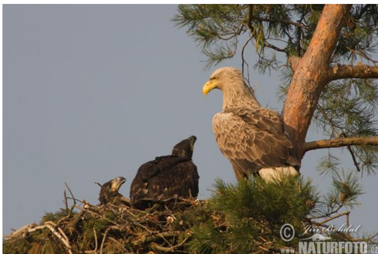
Slika 4. Orao štekavac u gnijezdu s mladima.