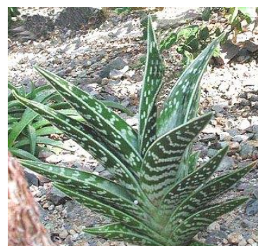
Slika 11.: Aloe variegata

http://www.aloe-vera-and-handy-herbs.com/the-truth-about-aloe-ferox.html