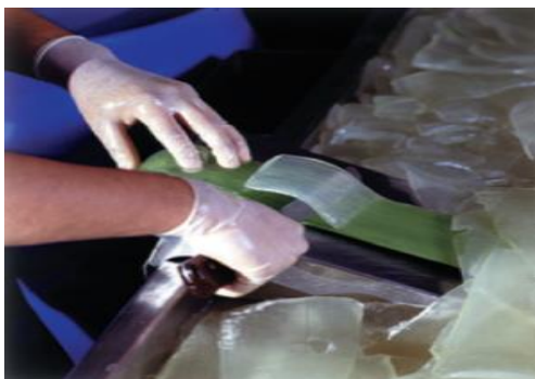
Slika 22.: Filetiranje lišća Aloe vere

Upravo zato, mnoge tvrtke ručno ljušte lišće kako bi izbjegle moguća oštećenja izazvana ugljičnom filtracijom. Ručno ljuštenje lišća naziva se još i filetiranje. Filetiranje je definirano kao izrezivanje najdragocjenijeg mesnatog dijela (Slika 22) Aloe vere iz lista biljke. Ručnim filetiranjem sastavni dio biljke ostaje netaknut i osigurava se očuvanje svih hranjivih tvari koje list Aloe vere posjeduje (Anonymous, 2008.).