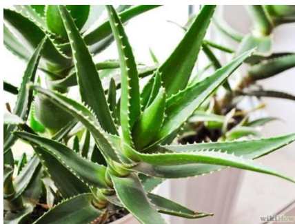
Slika 3.: Lišće Aloe vere

Iz kratke stabljike u blizini tla rastu zeleni, mesnati listovi Aloe vere koji su zaštićeni trnjem. Široki su 10 – 13 cm, duljine 25 – 30 cm te imaju ispupčenu donju stranu, a gornju udubljenu (Slika 3). Biljka nakon 3 godine ima zrelo lišće, a uobičajena masa u potpunoj zrelosti je 0.7 – 1.5 kg (Manwitha i Bidya, 2014.).