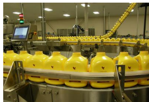
Slika 23.: Čuvanje gela Aloe vere u bocama

http://www.californiaconcept.com/aloe_vera.htm