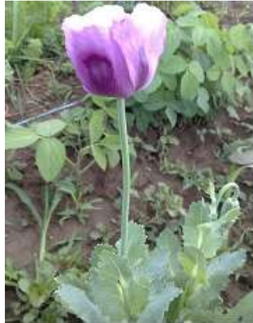
Slika 2.: Stabljika vrtnog maka

Stabljika biljke je uspravna, okrugla i glatka. Zeljasta je, lako lomljiva te je presvučena plavkasto-zelenom voštanom tvari (Đorđevski i Klimov, 1986.). Visina stabljike u normalnim uvjetima obično se kreće od 1 – 1,5 m, ali u sušnijim uvjetima ili na laganim tlima siromašnim hranivima obično ne raste više od 0,7 m (Pospišil, 2013.).