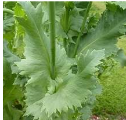
Slika 4.: Listovi vrtnog maka