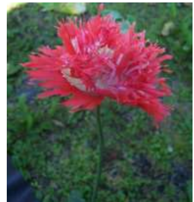
Slika 20.: Papaver somniferum „Oase“

http://davesgarden.com/guides/pf/go/31965/