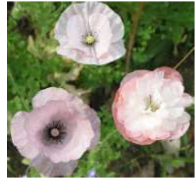
Slika 17.: Papaver rhoeas „Mother of Pearl“

http://davesgarden.com/guides/pf/go/211788/