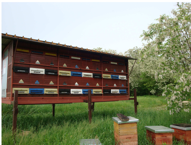
Slika 8: Kontejner