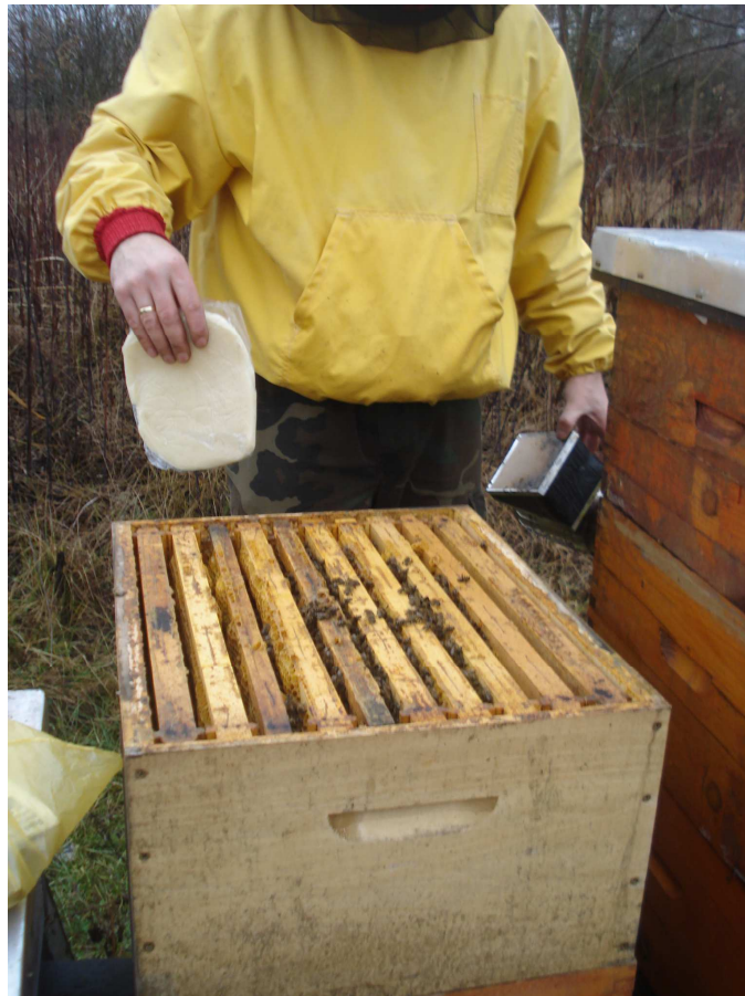
Slika 14 : Slaba zajednica

Pčelari znaju reći, zajednice imaju više bolesti, dok pčelarstvo samo jednu – slabe zajednice. U današnjim uvjetima življenja i pčelarenja važno je maksimalno iskoristiti sakupljački potencijal svake pčelinje zajednice i time osigurati rentabilno pčelarenje (Slika 14). Optimalan broj pčela u zajednici je između 40 i 55 tisuća pčela. Nije prihvatljiv pristup pčelarenju da će u dobrim godinama biti meda i da će pokriti sve gubitke u lošim godinama, potrebno je u svakoj godini u potpunosti iskoristiti pašu ovisno o uvjetima.