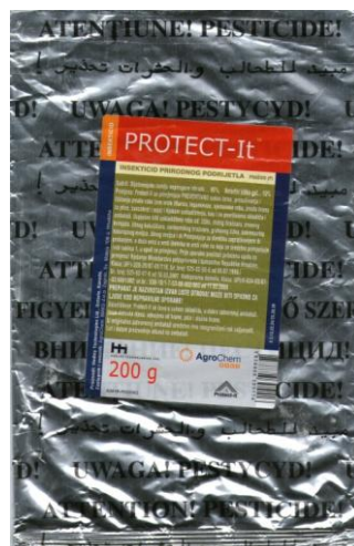
Slika 4. Komercijalno dozvoljen pripravak na osnovi dijatomejske zemlje u Republici Hrvatskoj - Protect-It™

Na tržištu Republike Hrvatske trenutno se nalazi jedan komercijalizirani pripravak na osnovi dijatomejske zemlje, pod nazivom Protect-It™, proizvođača Hedley Technologies Ltd. Ontario, Kanada (Slika 4.). To je insekticid prirodnog podrijetla, iz uputa klasificiran je kao insekticidno i akaricidno prašivo za suzbijanje kukaca i grinja u uskladištenim proizvodima.