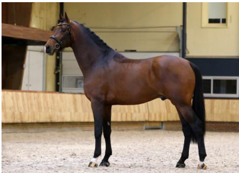
Slika 1. KWPN licencirani šestogodišnji dresurni pastuh Las Vegas

Popularizacija i zahtjevnost dresurnog sporta utjecali su na potrebu za stvaranje specifičnog sportskog tipa konja. Vrhunska sportska grla nastala su vrlo strogom selekcijom unutar pasmina ili križanjem različitih pasmina. Posljednjih nekoliko godina KWPN uzgojna organizacija dopušta križanje dresurnih kobila s pastusima španjolskih punokrvnjaka i luzitano ( Lusitano ) pasmine zbog prenošenja poželjnih osobitosti za izvođenje piaffa i passagea (Kwpm.org, 2021.). Rovere i sur. (2014.) su u svome istraživanju potvrdili da je specijalizacija unutar uzgojnog programa nizozemskog toplokrvnjaka efikasnija kada se uzgaja specifičan tip dresurnog ili preponskog konja. Isti autori tvrde kako je performans u dresurnom i preponskom sportu genetski drugačija osobitost koja je nepovezana ili slabo nepoželjno povezana. Dresurni tip KWPN pasmine opisan je kao uzbrdno i finije građen konj pravokutnoga oblika tijela duljih proporcija, s finijim spojem glave i vrata koji je visoko nasađen te s razvijenim mišićima u gornjem dijelu (Slika 1.).