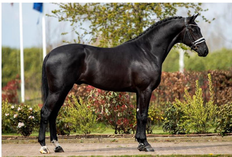
Slika 6. Duža leđa