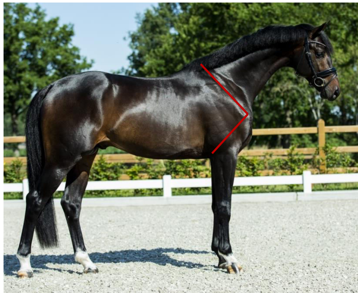
Slika 4. Prikaz lopatice s nagibom i duge nadlaktice

bolju podlogu za troglavi nadlaktični mišić koji utječe na domet prednjih nogu. Duljina nadlaktice konja promatra se od početne točke ramena do lakta i ona ne bi trebala biti duža od ramena konja s pravilnim spojem na lopatičnu kost. Prsa konja definira njihova širina, a upravo šira prsa su u pozitivnoj korelaciji s performansom jer uglavnom označavaju i bolji kapacitet pluća (Weeren i Crevier-Denoix, 2006.). S druge strane, prsa dresurnog konja ne bi trebala biti preuska jer uzrokuju preblisku postavljenost prednjih nogu, a time i neelastične kretnje.