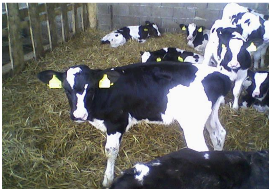
Slika 4. Smještaj teladi na dubokoj stelji

Rezultati praćenih pokazatelja obrađeni su statističkim paketom (Statistica, 2008.), a značajnost razlika utvrđena je LSD – testom. Značajnost razlika utvrđenih statističkim testiranjem iskazana je na razinama ( P < 0,05 ) i ( P < 0,01 ).