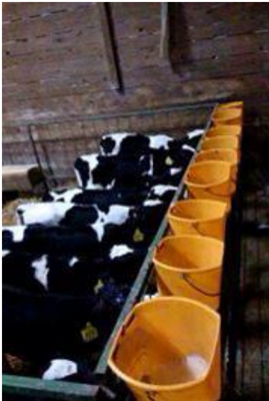
Slika 1. Grupno hranjenje teladi u skupini ( Farma Tokić, Široko Polje)

Upala pluća kod teladi najčešće uzrokovana temperaturnim oscilacijama, kombinacijom niske temperature te visoke relativne vlage zraka, kao i u lošim higijenskim uvjetima.