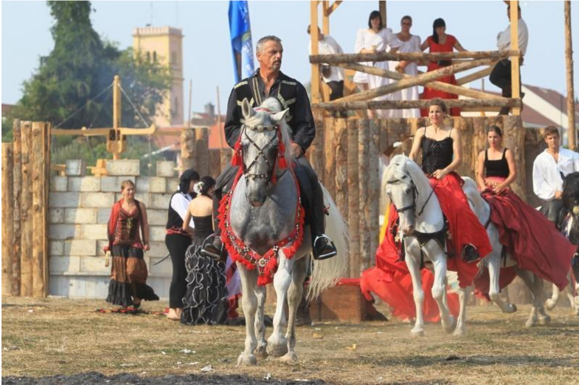
Slika 4. Jahači na renesansnom festivalu