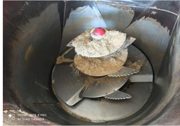
Slika 13. Dodavanje krede u miksericu