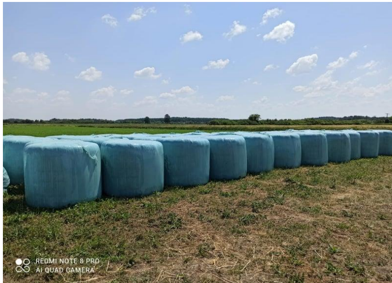
Slika 14. Travnja silaža (sjenaža)