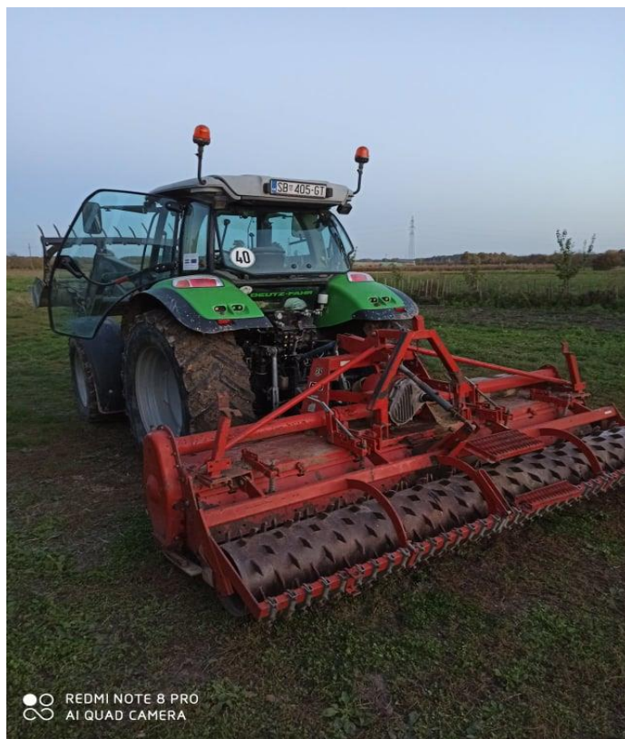
Slika 4. Rototiller RAU