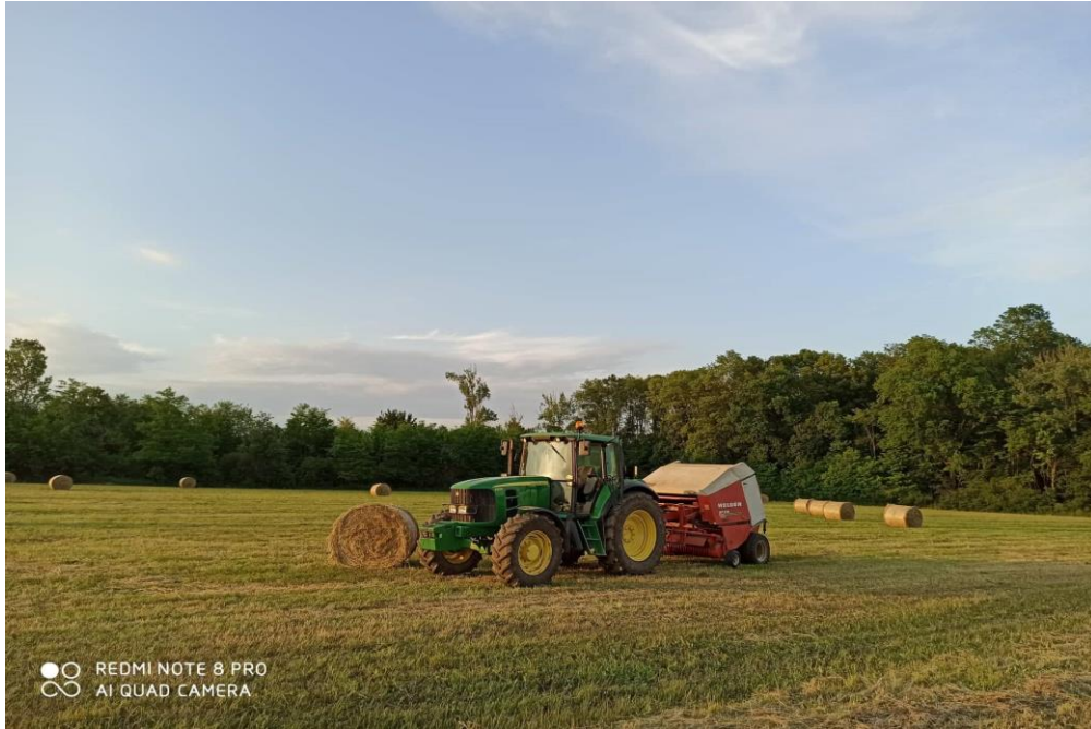
Slika 7. Baliranje lucerne rolobalirkom