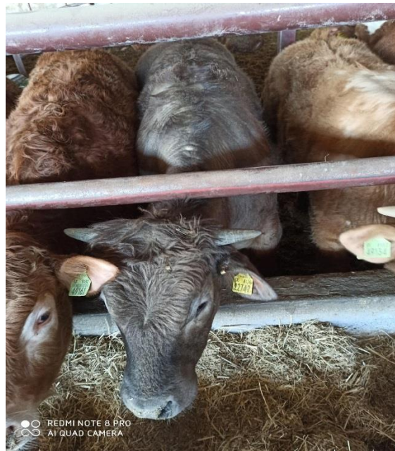
Slika 10. Blonde d'Aquitane pasmina