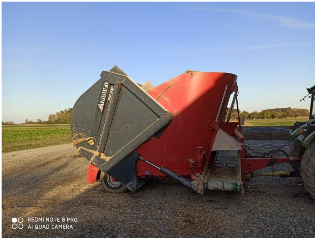
Slika 5. Mikser prikolica Trioliet Triomix 1200