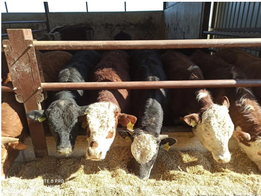
Slika 11. Hereford pasmina