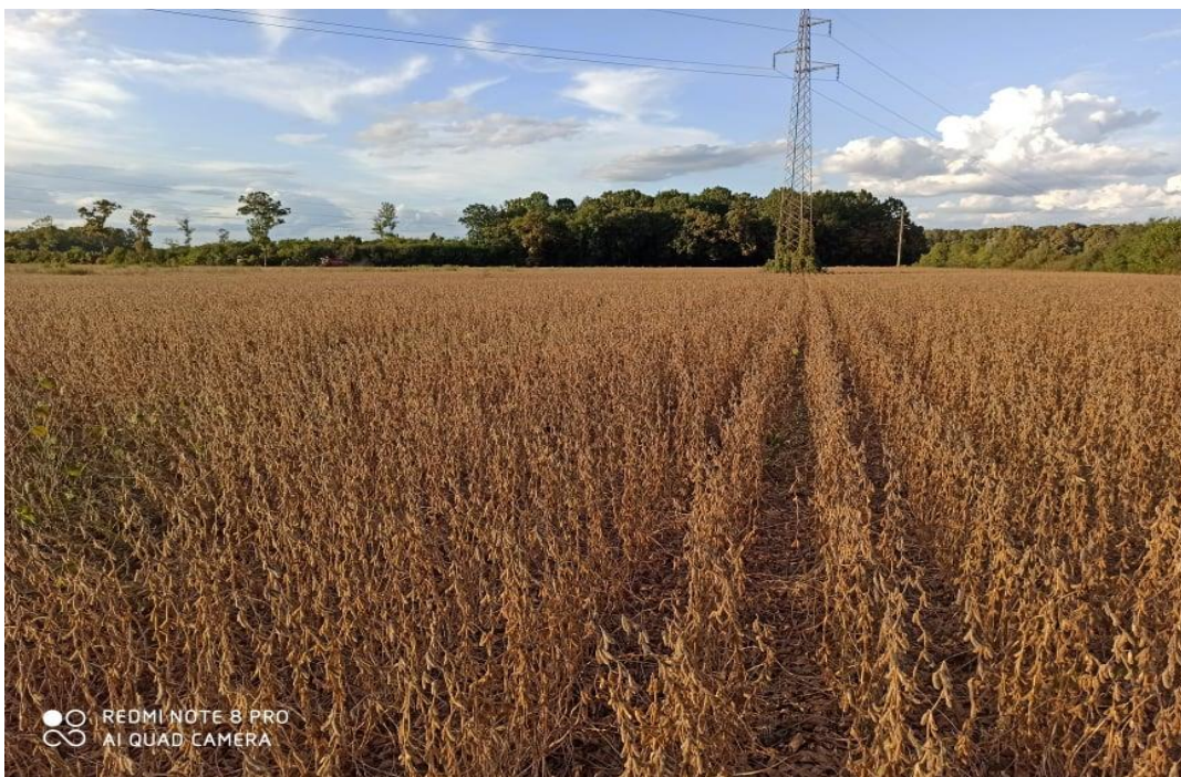
Slika 6. Usjev soje