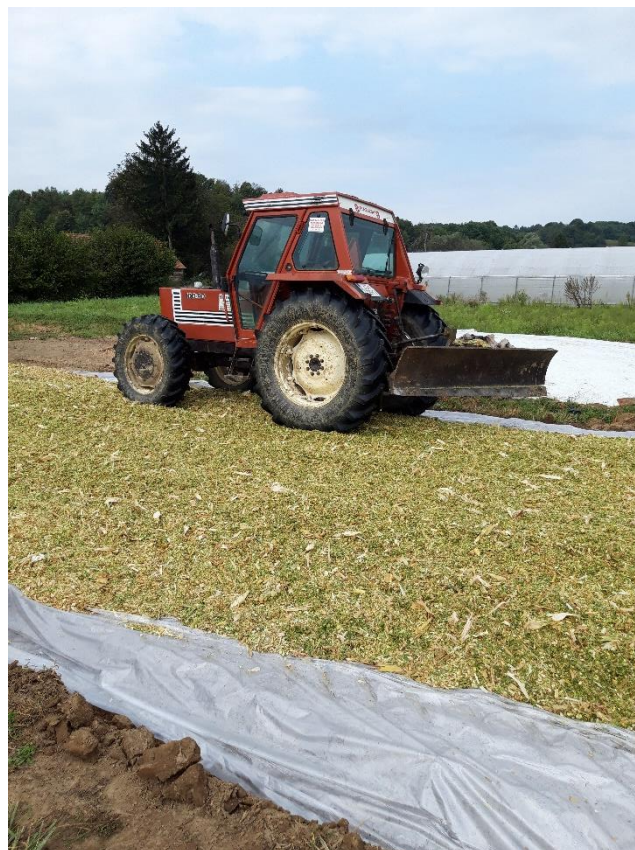
Slika 6. Gaženje silaže

Košnja kukuruza odnosno priprema silaže na obiteljskom poljoprivrednom gospodarstvu Šolinić vrši se početkom rujna iz razloga što se silažni kukuruz sije kasnije pa samim time i kasnije dostiže svoju fiziološku zrelost. Siliranje se vrši s četverorednim silokombajnom te se traktorima i prikolicama silirana masa prevozi do mjesta gdje će biti silosi. Pošto silosi nisu izbetonirani na tlo se postavi folija na koju se tada istrpava silirani kukuruz te se potom, uz pomoć traktora, to sve dobro nagazi kako zrak odnosno kisik ne bi mogao ući unutra i potaknuti kvarenje silaže. Na kraju se silos pokrije s dvije folije, zrak se istisne pomoću pijeska van te se stavi neka vrsta tereta da vjetar ne može nadići folije.