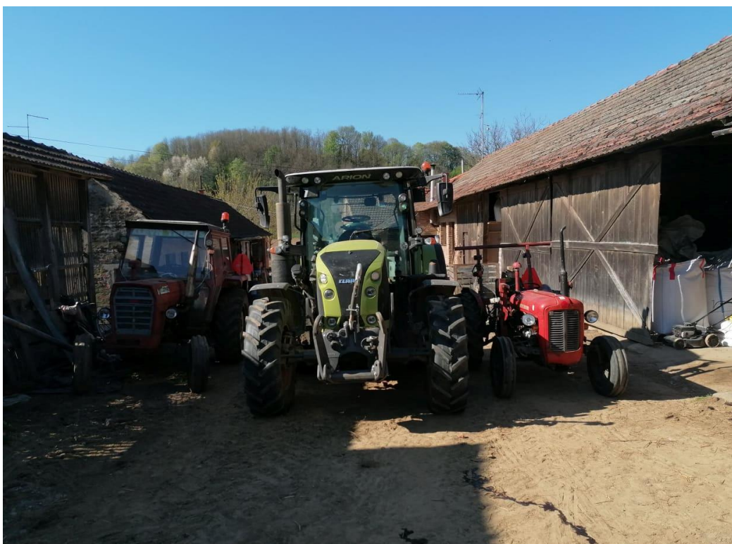
Slika 2. Traktori u vlasništvu gospodarstva

Jedan od glavnih napredaka je svakako bila nabavka novog traktora, Class Arion 510. Samom kupnjom tog traktora, omogućena je i kupnja većih plugova, sijačice za žitarice te brojnih ostalih priključaka koji imaju veći obuhvatni zahvat. Uz Claas posjedujemo još dva traktora IMT 539 te IMT 560. Prije nekoliko godina kupljena je rolo balirka sa omotačem što je uvelike olakšalo, ali i ubrzalo proizvodnju. Iste godine je kupljena i mješaona za smjesu kapaciteta 800 kg što je omogućilo pripremu veće količine smjese za goveda. Isto tako su kupljeni plugovi prekretači, sjetvospremač te sijačica.