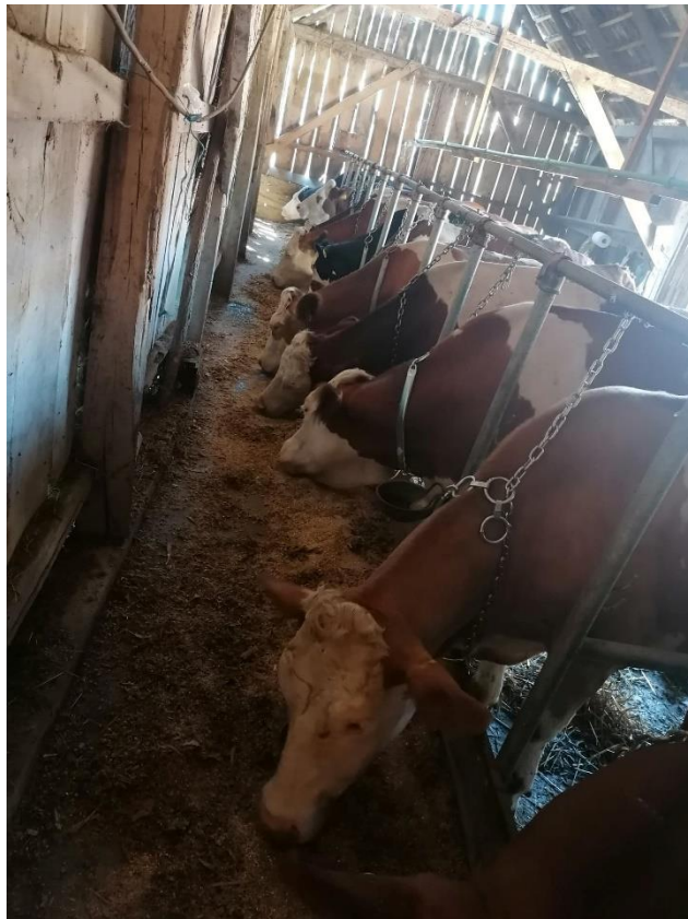
Slika 3. Krave u staji

Broj krava se vrlo brzo povećava, što iz razloga jer je kupljeno nekoliko visoko gravidnih junica tako i jer imamo nekoliko vlastitih junica koje su gravidne. Isto tako smo postigli rekordan broj teladi kojih je sada trenutno 10, a kroz mjesec dana bi se taj broj trebao povećati za još tri teleta. Uz goveda na gospodarstvu ima i nekoliko svinja, no one se koriste za vlastite potrebe.