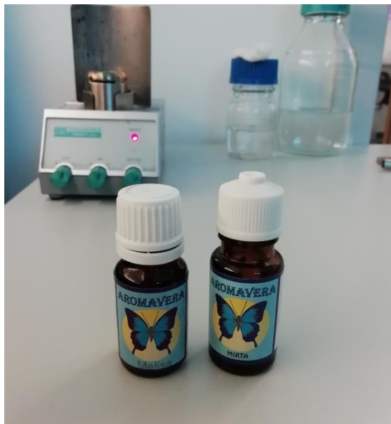
Slika 2. Eterična ulja matičnjaka i mirte (izvor: Brajković, 2019.)

Istraživanje antifungalnog djelovanja eteričnih ulja matičnjaka i mirte na porast micelija osam fitopatogenih gljiva provedeno je u Centralnom laboratoriju za fitomedicinu Fakulteta agrobiotehničkih znanosti Osijek. Cilj je bio utvrditi antifungalno djelovanje eteričnih ulja matičnjaka i mirte koje smo primjenili u tri količine (5, 15 i 25 \mu l). Prilikom rada korišteno je sterilizirano posuđe, metalna pinceta, plamenik, metalni kružni rezač i 96 % etilni alkohol.