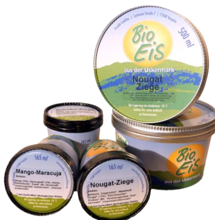
Slika 10. Pakiranje sladoleda

Proizvodnja kobiljeg mlijeka počela se razvijati u drugoj polovici prošlog stoljeća. U Njemačkoj je registrirano oko 40 gospodarstava koji se bave proizvodnjom kobiljeg mlijeka (Gregić i sur., 2018.a). Njemački slastičar Koller u svoje proizvode dodaje kobilje mlijeko. Proizvodi sladoled i distribuira ga na tržište po cijeloj Njemačkoj. Njegov asortiman sadrži više od 60 različitih vrsta sladoleda koji se proizvodi ručno prema staroj tradiciji. Koller koristi prirodne sirovine od ekoloških uzgoja kao što su voće i povrće za veganske sladolede. Proizvodi sladoled od ovčjeg, kozjeg i kobiljeg mlijeka. Mlijeko za pripremu sladoleda nabavlja izravno s poljoprivrednih gospodarstava, koja su specijalizirana za proizvodnju organskog mlijeka. Koller proizvodi razne kreacije sladoleda kao što su maline s fermentiranim kobiljem mlijekom ili sladoled od ovčjeg mlijeka s ružičastim paprom. Sladoled se pakira u šalice kapaciteta 500 i 165 ml ( https://koeller-organic-manufactory.de/koeller.icecream.html ).