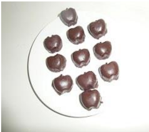
Slika 27. Čokolada kalup jabuke (Janković, 2019.)