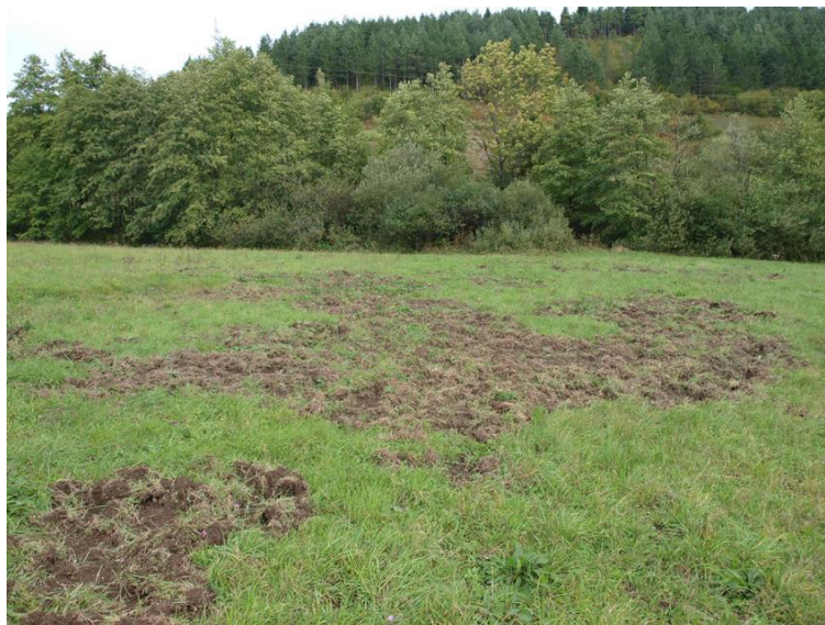
Slika 7. Štete od divljih svinja

Kao što smo više puta spominjali divlja svinja čini velike štete na ratarskim kulturama kao i na pašnjacima. Najveće štete pravi na poljima kukuruza. Najefikasniji način borbe protiv toga su repelenti i ograđivanje polja električnim pastišrom.