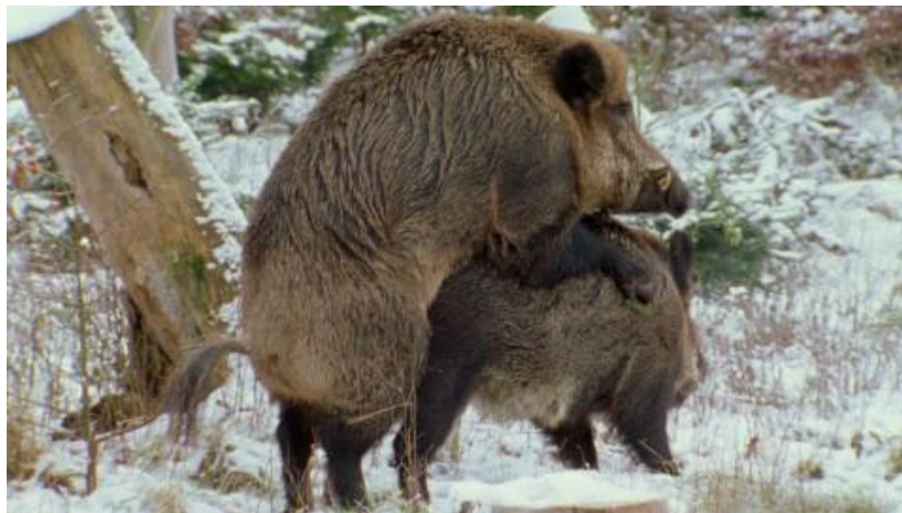
Slika 4. Parenje divljih svinja

od razloga produženog razdoblja parenja. Najveći postotak krmača bude oplodjen u studenom i prosincu. U vrijeme parenja mužjaci prilaze krdima gdje se žestoko bore za pravo parenja. Tijekom borbi može doći do ozljeda i loma kljova, ali rijetko dolazi do ozbiljnijih posljedica. Zanimljivo je da se borba može čuti na velike udaljenosti. Pretpostavka je da je u borbi presudna tjelesna masa i veličina, kao i dužina kljova ali nije rijetkost da mlađi i slabiji vepar pobijedi u borbi. Vepar pobjednik ostaje s krmačama do kraja parenja. Jedan vepar se pari s više krmača, a nakon bucanja napušta krdo. Graviditet krmače traje oko 117 dana, a prase se u ožujku i travnju. Krmača pred samo prašenje napušta krdo, pravi gnijezdo od vlastite dlake, lišća, granja i suhe trave. Divlja krmača obično se prasi stojeći, a nakon izlaska ploda, plodove ovojnice pojede. Boravak u krdu traje različito dugo, ovisno o vremenskim prilikama i produžava se uslijed kiše i hladnog vremena. Nekada je broj prasadi po krmači bio malen i iznosio 4-6, danas je taj broj veći i iznosi do 12 prasadi po krmači. Prasad siše oko 3 mjeseca, a osamostaljuje se sa 6 mjeseci. (Janicki, 2007.). Vrijeme prašenja i parenja također ovisi o vremenskim prilikama, uz rijeke u poplavnim područjima krmače se prase već u prosincu, da bi izbjegli visoke vodostaje u proljeće.