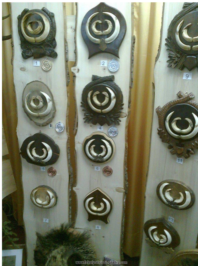
Slika 11. Kljove divljih svinja na izložbi