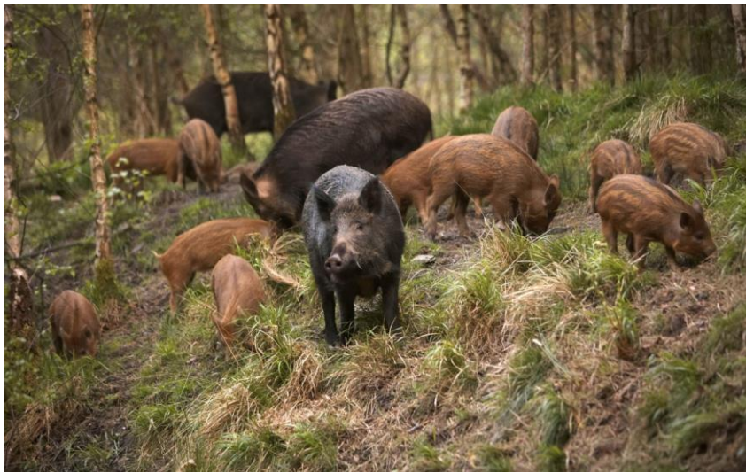
Slika 6. Krmače i prasad

Divlja svinja je društvena životinja i živi u krdu, osim veprova koji žive samotnjački, a krdu se priključuju samo u vrijeme parenja. Krdo predvodi stara i iskusna ženka, a krdo čine svinje koje su obično u srodstvu. Ponašanje u krdu određeno je hijerarhijski. Kod veprova hijerarhija se određuje snagom, a prašćići prvih mjeseci života su izuzeti od rangiranja. Krdo čini jedna ili više krmača s podmlatkom, a u krdu osim prasadi zadržavaju se i nazimad i mlade krmače. Krmača rijetko napušta krdo osim kada je u potrazi za novim. Mladi mužjaci napuštaju krdo s navršene najviše dvije godine života, a ponekad formiraju male skupine od nekoliko članova. Veličina krda ovisi o uznemiravanju u lovištu, što je uznemiravanje manje, krda su veća i obrnuto. Divlja svinja je noćna životinja. Omjer dnevne i noćne aktivnosti također ovisi o uznemiravanju. Gdje nema uznemiravanja već u sumrak počinje biti aktivna. Imaju mjesta za noćenje, koja koriste za odmor tijekom dana. Dnevni ritam ovisi o godišnjem dobu i vremenskim prilikama, a sastoji se od ravnoteže kretanja, potrage za hranom i odmaranja. Snijeg prekida aktivnost divlje svinje, a kiša povećava. Tijekom padanja kiše ponuda hrane, kao što su kišne gujave, je znatno veća.