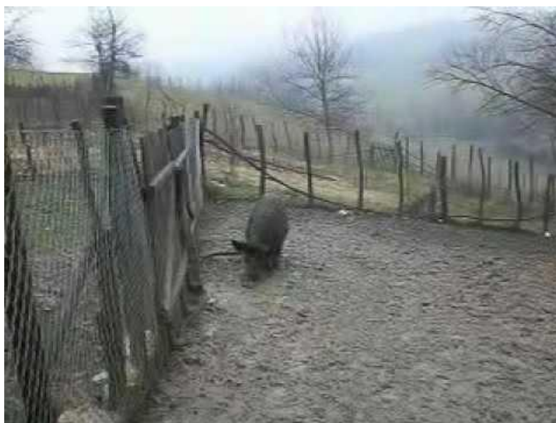
Slika 5. Divlja svinja u gateru

Cilj uzgoja divljih svinja je uspostavljanje zdrave i kvalitetne populacije, usklađeno s ekonomskim kapacitetom lovišta, koj će dati što veći broj grla jake trofejne vrijednosti i odgovarajuću količinu divljači (Sertić, 2008.). Proširivanjem urbanih područja čovjek konstantno nepovoljno utječe na opstanak i razvoj divljači. Uzgajivači, odnosno lovci su primorani provoditi različite uzgojne mjere da bi očuvali populaciju divljači. Uzgojne mjere treba zasnivati na stručnoj literaturi i poznavanju prilika u vlastitom lovištu. Neke od mjera koje bi trebali napomenuti je uzgojna mjera po broju divljači prema kojoj određujemo strukturu odstrjela prema kojoj bi starija grla trebali štedjeti. Prema tome 70% strukture odstrjela bi trebala činiti prasadi i nazimad, grla srednje dobi oko 20%, a zrela grla 10%. Također jedan od ciljeva uzgoja je i dobivanje visoko vrijedne trofejne divljači. Vepar da bi postigao trofejnu vrijednost za medalju potrebno je i više od 5 godina, što nam govori da bi srednjodobnu divljač trebali maksimalno štedjeti. U lovištima gdje se lovi prigonom manja je vjerojatnost postizanja visoke trofejne vrijednosti divljih svinja, dok je ta mogućnost veća u lovištima gdje prevladava lov sa čeke. Divlju svinju većinom uzgajamo u otvorenim lovištima rjeđe u ograđenim. Možemo ih uzgajati u gateru koji nam najčešće služi za obuku lovačkih pasa i manjih je dimenzija.