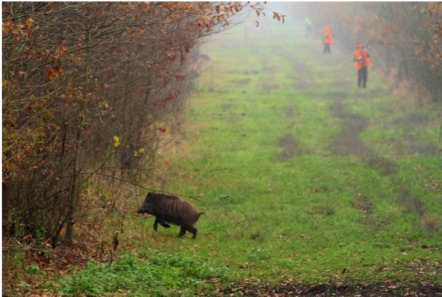
Slika 10. Lov divljih svinja prigonom

Divlju svinju možemo loviti na tri načina, a to su lov prigonom, šuljanjem i dočekom sa visoke čeke. Kod skupnog lova važno se pridržavati sigurnosnih pravila kako ne bi došlo do nesreće.