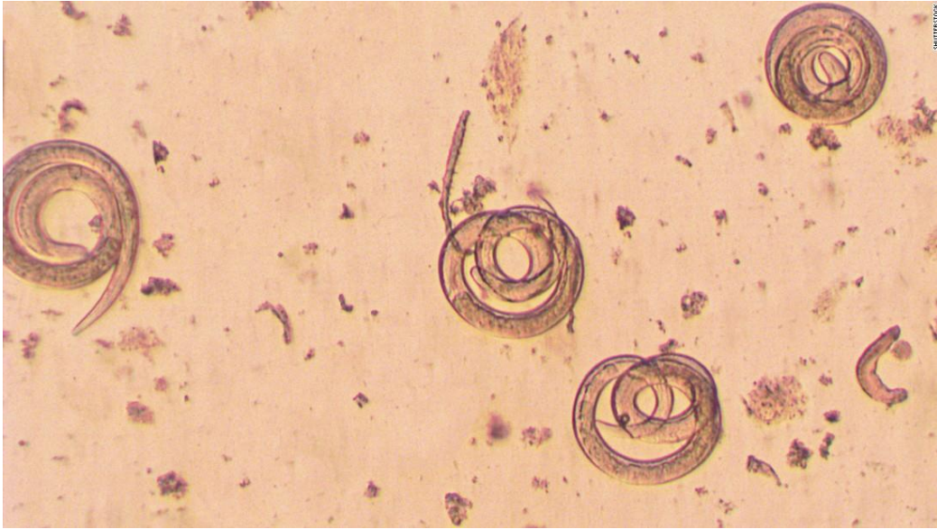
Slika 9. Prikaz trichinele pod mikroskopom