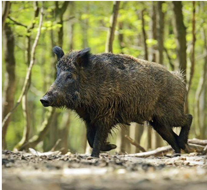
Slika 3. Divlja svinja

od jedne do dvije godine nadzima. Masa im varira ovisno o staništu, dostupnoj hrani, godišnjem dobu i sl. Veprovi mogu biti mase i do 300 kg, a krmače najčešće do 150 kg. Tijelo prekrivaju oštre i tvrde čekinje, ispod kojih zimi nalazimo sloj guste i vunaste dlake koju nazivamo malje. Boja im je tamnosmeđa do crna. Prasad je smeđe boje s po dvije tamne pruge na svakoj strani tijela, Takva osobina u prasadi naziva se livreja, a gubi se prvim linjanjem. Divlja svinja ima od 42 do 44 zubi i u potpunom zubalu razlikujemo 12 sjekutića, 4 očnjaka, 16 predkutnjaka i 12 kutknjaka. Zubna formula je: 2 \times I \frac{3}{3}, C \frac{1}{1}, P \frac{4}{4} i M \frac{3}{3} (Mustapić, 2004.). Očnjake vepa nazivamo kljove (brusači i sjekači), a očnjake krmače nazivamo klice. Prema njihovim karakteristikama možemo procijeniti dob životinje. Mliječna žlijezda krmača obično ima 10 bradavica, od kojih je 8 aktivnih. Ima odlično razvijena osjetila, pri čemu je najrazvijeniji njuh, zatim sluh, a vid im je lošiji.