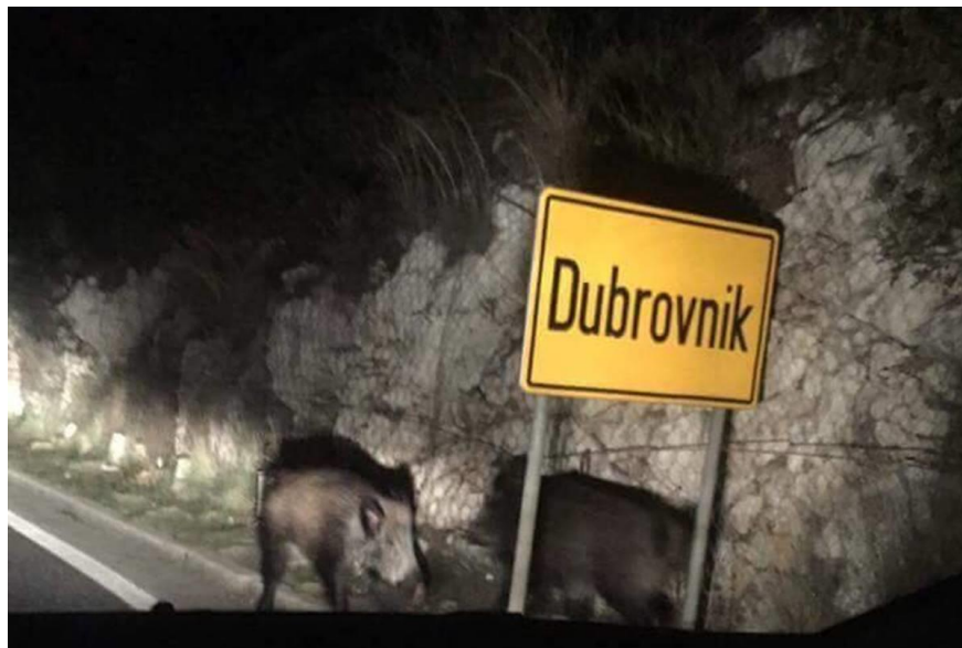
Slika 2. Divlja svinja na ulazu u grad Dubrovnik

Velika prostorna raspodjeljenost govori nam da je vrlo prilagodljiva. Najviše nastanjuje šumska područja od bjelogoričnoga drveća gdje nalazi hranu (žir, bukvića, kesten), manje je ima u crnogoričnim šumama gdje nema dovoljno hrane. U nizinskim područjima nastanjuje ritske i nizinske šume u dolinama rijeka Save, Drave i Dunava, odnosno močvarna područja. Voli obitavati u blizini poljoprivrednih površina gdje, najčešće noću, nanosi velike štete na ratarskim kulturama. Posljedice intenzivne poljoprivrede i nestanka njezina staništa je da ju sve češće možemo vidjeti u urbanim područjima bliže ljudima gdje dolazi u potrazi za hranom.