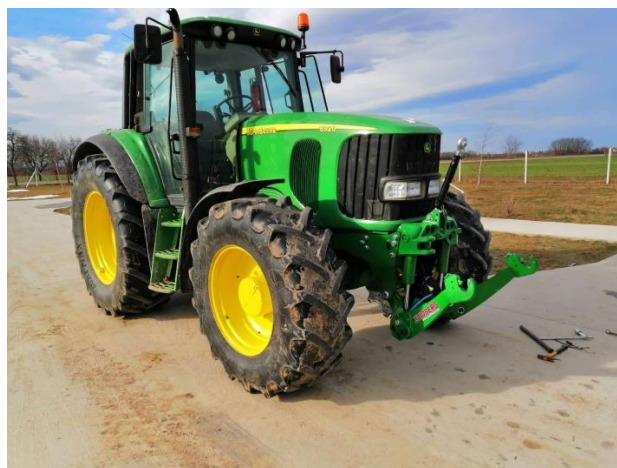
Slika 14. Traktor