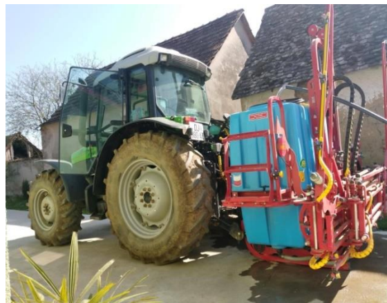
Slika 16. Prskalica