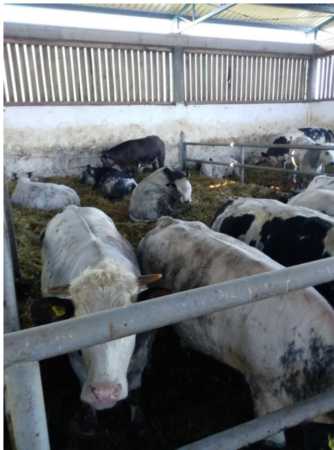
Slika 3. Križanci belgijskog plavog goveda

U tovu mladi bikovi postižu dobre priraste (između 1.200 i 1.400 g dnevno) i izvrsnu iskoristivost trupa.