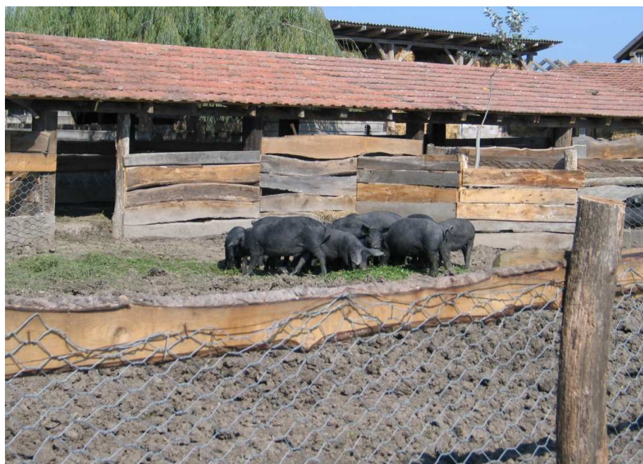
Slika 3. Crne slavonske svinje u poluotvorenom sustavu držanja