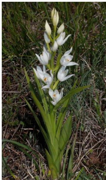
Slika 4. Cephalanthera longifolia (L.) Fritsch