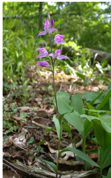
Slika 5. Cephalanthera rubra (L.) Rich