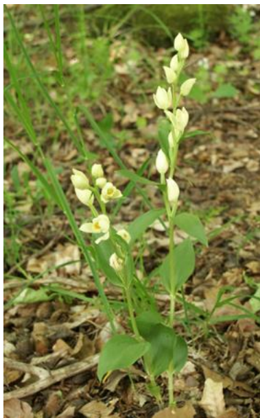
Slika 3. Cephalanthera damasonium (Mill.) Druce

Sve tri vrste su prema IUCN-u 1 ugrožene.