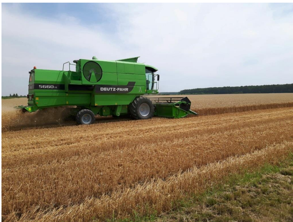
Slika 14. Ževa pšenice kombajnom Deutz-Fahr 5660H