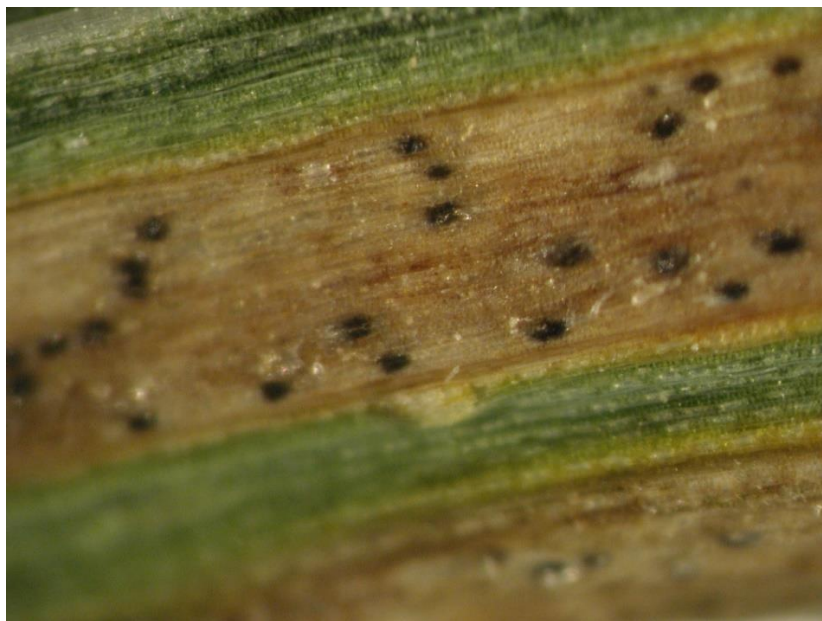
Slika 2. Smeđa pjegavost lista pšenice lat. Septoria tritici

S. nodorum može parazitirati na klasu i listu, a prenosi se sjemenom. Najčešće se pojavljuje u toplim područjima s mnogo kiše u kojima smanjuje prinos i uzrokuje pojavu smežuranih zrna. Spore koje prežive u žetvenim ostacima tijekom ljeta sazrijevaju u jesen i raznose se kišom zimi ili vjetrom te se tako šire na velike udaljenosti. Najbolja zaštita su otporne sorte, upotreba certificiranog sjemena, pravilan plodored, uklanjanje žetvenih ostataka i upotreba fungicida (Jurković i sur., 2016).