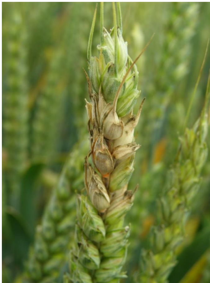
Slika 5. Fuzarijska palež klasa

zeae (Schw.) Petch.) kopulacijom anteridija i askogona tvori tamno plave do crne peritecije. Razvoj spolnog stadija se događa na samom kraju vegetacije domaćina na kojem F. graminearum parazitira. U periteciju se nalazi najčešće 8 askospora koje su trostanične. Pomoću spolnog stadija gljiva se prilagođava i daje nove patotipove koji su rezistentniji i agresivniji. Izvor zaraze su periteciji ili micelij na ostacima biljaka iz prošlih vegetacija. Uzročnik može preživjeti 2 do 3 godine i biti sposoban izvršiti ponovnu zarazu. Makrokonidije klijaju u širokom temperaturnom rasponu između 16 i 36 °C. Optimalne temperature su između 28 i 30 °C. Temperature koje odgovaraju razvoju askospora su oko 29 °C. Izvor inokuluma mogu biti zaraženo tlo, zaraženo sjeme ili alternativni domaćini. Sjeme pšenice, ali i drugih žitarica, zaraženo gljivicama iz roda Fusarium može sadržavati sekundarne metabolite (mitotoksine) koje gljivica sintetizira u nepovoljnim uvjetima. Mikotoksini, deoksinivalenon (DON), zearalenon (ZEA) i moniliformin (MON) posebno su opasni za zdravlje ljudi i životinja jer suprimiraju imunološki sustav, izazivaju mučninu i povraćanje te smanjuju apetit uzrokujući kod životinja odbijanje hrane (Ćosić 2001.).