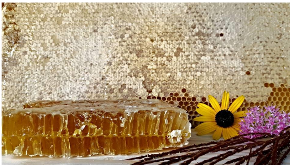
Slika 10. Med u saću

Na ovom OPG-u proizvodi se med s prirodnim, organskim dodacima poput cejlonskog cimeta, svježeg đumbira, ali i oni za kojim će rado posegnuti ljubitelji čokolade, organskim kakaom i čokoladom koja sadrži 80% kaka. U sklopu njihovih proizvoda nalazi se i med u saću, vosak, tinktura propolisa kao i njegov prah, pelud te matična mliječ.