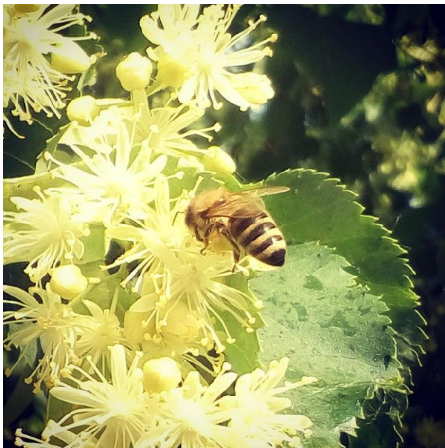
Slika 4. Pčela na cvijetu lipe

Lipa (rod Tilia ) – lipe cvjetaju od lipnja do srpnja. Jaka pčelinja zajednica pri dobrom medenju može dnevno donijeti 5 do 6 kg meda. Ako medenje potraje, postižu se prinosi do 20 do 30 kg, pa čak i više meda. Lipov med spada u najkvalitetnije sorte medove, iako ga neki potrošači ne vole zbog vrlo jakog, ali ugodnog mirisa. Svjetle je boje, sa žutim preljevom, a kada kristalizira ima žućkastu boju. Pored nektara, pčele s lipe prikupljaju i medljiku. Taj med od medljike nije pogodan za zimovanje pčela, a ako se brzo ne izvrca, za nekoliko dana toliko kristalizira da ga je vrlo teško izvrcati.