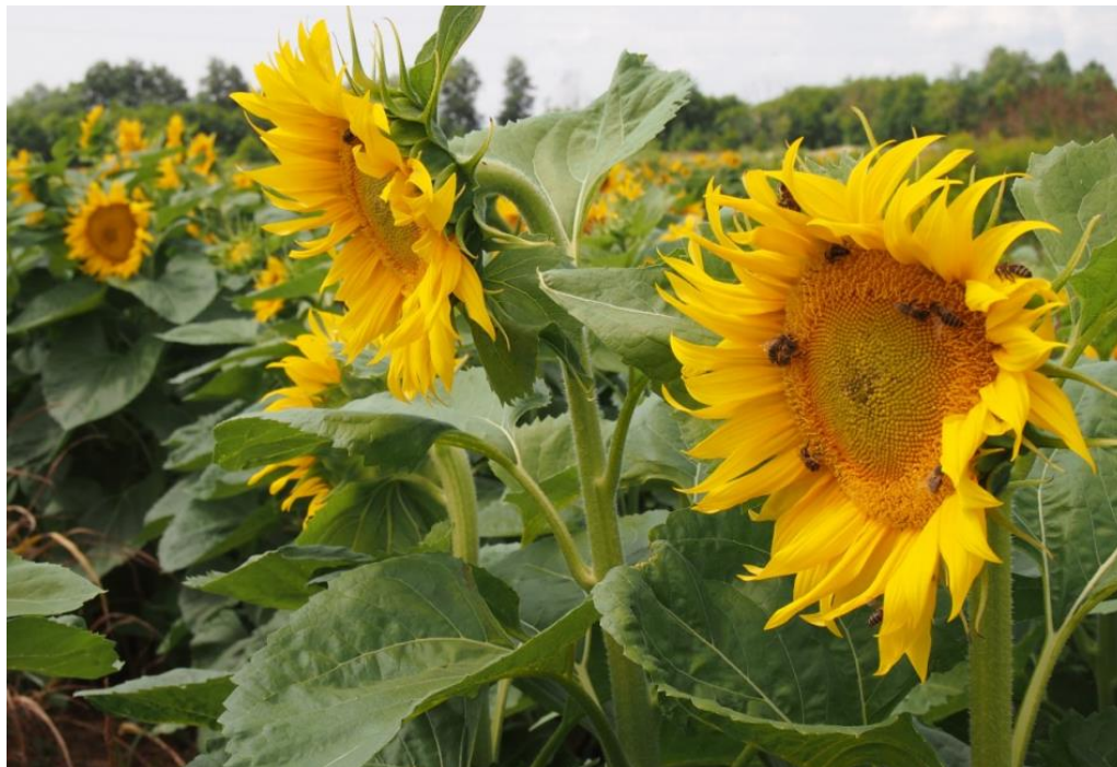
Slika 5. Pčele na cvijetu suncokreta

Suncokret ( Helianthus annuus ) – Cvatnja suncokreta počinje krajem lipnja i početkom srpnja, a najviše luči nektar kad je u punom cvatu. Spada među najmedonosnije biljke. Lučenje nektara ovisi od vlažnosti tla, kao i od vlažnosti i temperature zraka. Za pčelarstvo je suncokret značajan i zbog toga što cvjeta u vrijeme kada uglavnom nema drugog medonosnog bilja.