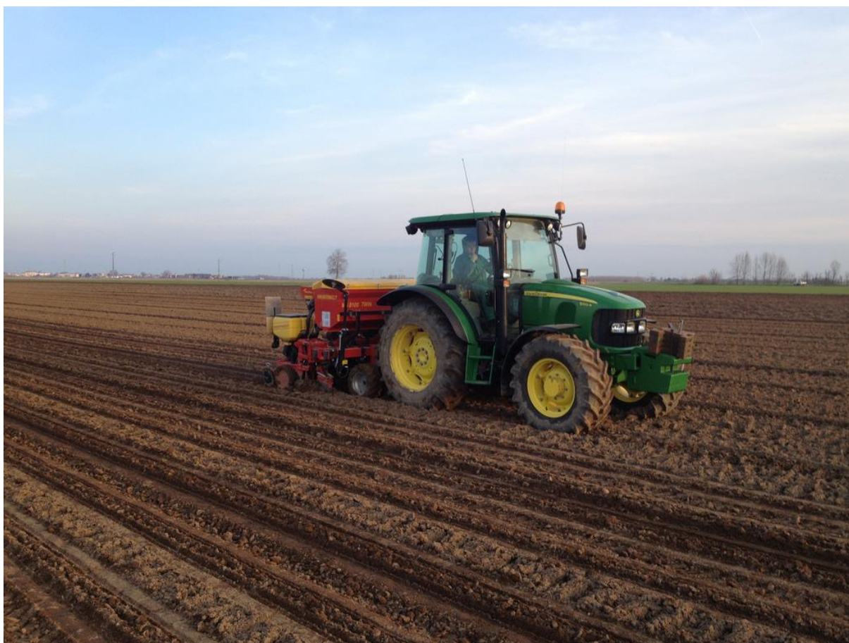
Slika 3. Četveroredna pneumatska kukuruzna sijačica.