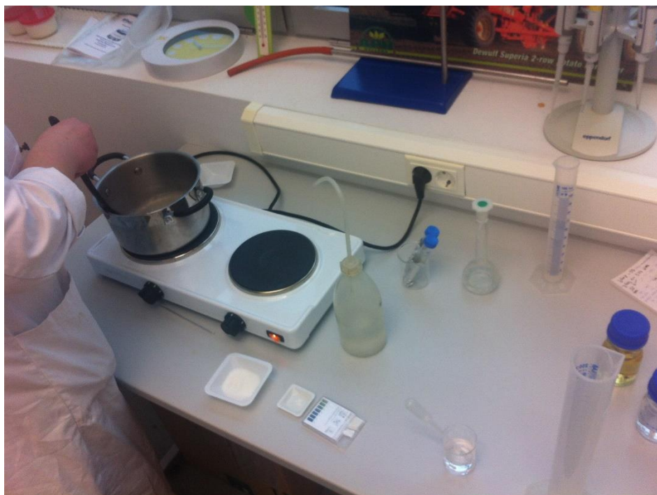
Slika 2. Priprema hranjive podloge