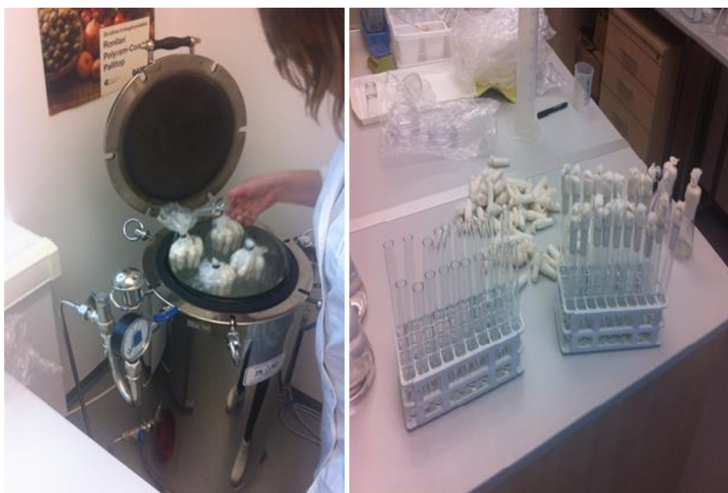
Slika 3. Punjenje i sterilizacija epruveta s hranjivom podlogom