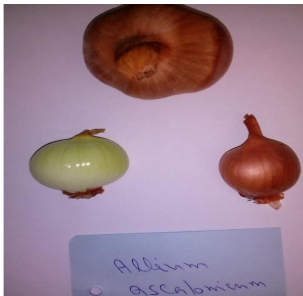
Slika 4. Odabir zdravih lukovica ljutike

Izdvojene su vizualno zdrave lukovice ljutike koje su prethodno očišćeni. Lukovice su ispirane pod mlazom vode pet minuta. Nakon toga su lukovice stavljene jednu minutu u 70% etanola, a zatim 20 minuta u 20% varikinu kojoj je dodano nekoliko kapi deterdženta koji služi kao okvašivač. Nakon toga lukovice se ispirane autoklaviranom destiliranom vodom pet puta (Slika 5.).