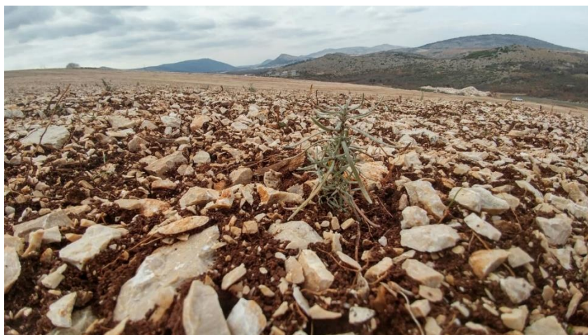
Slika 1. Smilje na kamenitom tlu (Foto original).

Pripadnike ove porodice nalazimo na iznimno oskudnim staništima (pješčane dine, klifovi i kamenjari) pretežno umjerenog i suptropskog pojasa.