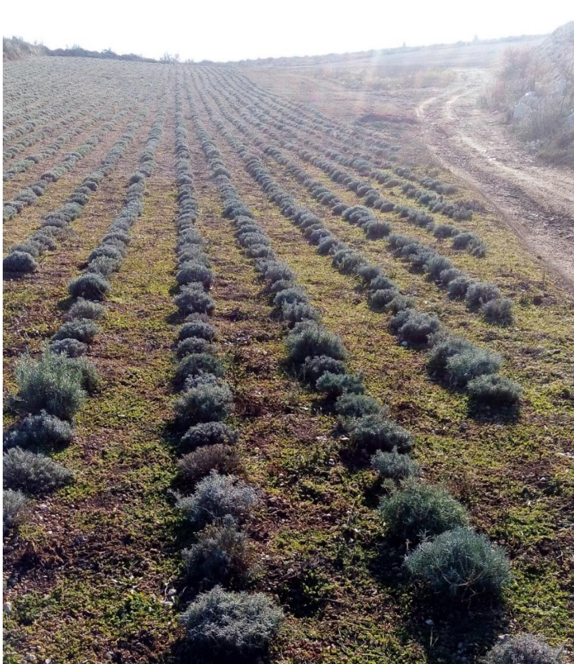
Slika 12. Nasadi u proljeće.

O nasadu, posebno u početnim fazama, je potrebno voditi brigu i u smislu osiguravanja dovoljne količine vlage pa se preporuča navodnjavanje. Navodnjavanje se obično vrši u prvoj godini kako bi se omogućilo mladim biljkama da ojačaju i stvore podzemni izdanak. Stariji nasadi obično nemaju potrebu za navodnjavanjem. Jačanje nasada se postiže i češćim orezivanjem grmića ne u svrhu žetve nego kako bi se potaknulo biljku na stvaranje gušćeg grma (Kolak i sur., 2008.). Smilje je, kako je već ranije rečeno, višegodišnja biljka o kojoj, bez obzira na njenu otpornost, treba voditi računa posebice u smislu gnojidbe te redovitog okapanja i kultiviranja kako bi se spriječilo zakorovnavanje površina pod nasadima.