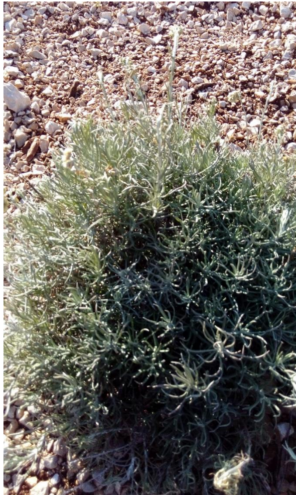
Slika 2. Grm smilja (Foto original).

cvjetovi. Ovako formirana cvjetna glavica obavijena je ljuskavim listovima. Plod smilja je roška (ahenija) koja na vrhu ima papus ili katkad kljun (Pohajda, 2015.).