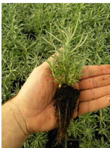
Slika 8. Presadnice smilja (Foto original).

Moguće je presadnice smilja proizvoditi i sjetvom direktno u kontejnere čime se olakšava daljnja manipulacija njima i smanjuje utrošak vremena. Ovako uzgojene presadnice ne presađuju se dodatno jer se radi o uzgoju jedne ili dvije biljke po kontejneru nego se one direktno iz kontejnera sade u nasade (Slika 8). Presadnica smilja spremna je za 90 dana za daljnu sadnju na poljoprivrednim površinama kod uzgoja iz sjemena (Slika 9).