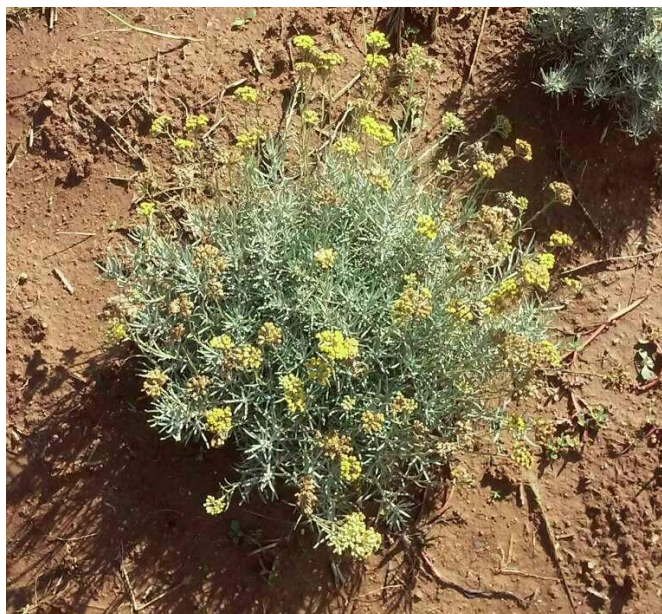
Slika 3. Cvat smilja (Foto original)

(besmrtnost) obzirom na vjerovanje da ekstrakt smilja može izbrisati tragove starenja kože lica.