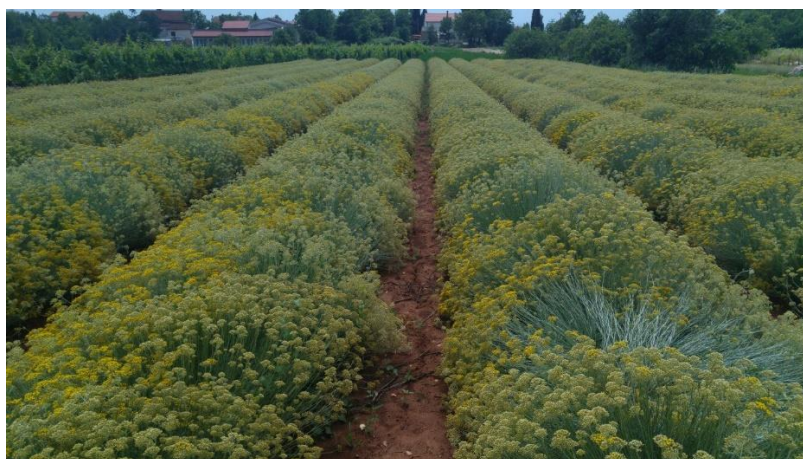
Slika 14. Nasadi spremni za žetvu (Foto original).

Žetva smilja se može obavljati dva puta godišnje, ponekad i tri puta (Slika 14), ovisno o vremenskim i okolišnim uvjetima. Naime, prvi otkos se napravi u srpnju što daje biljci dovoljno vremena da do prve polovice listopada iznova naraste i dođe u fazu cvjetanja pa se tada obavlja druga žetva istog nasada (Gulin, 2014.). Ponekad se napravi i siječanjaska žetva prvenstveno zbog poticanja boljeg razvoja biljke u narednoj uzgojnoj sezoni (Kolak, 2002.).