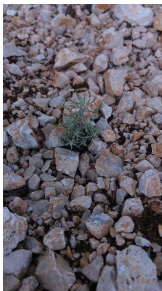
Slika 9. Presadnica posađena u trajni nasad (Foto original).

Treći način proizvodnje presadnica smilja je umnožavanje u reguliranim uvjetima procesom mikrorazmnožavanja tj. mikropropagacije koji omogućuje stvaranje jednoobraznog sadnog materijala neopterećenog bolestima i mikroorganizmima (Pohajda, 2015.).