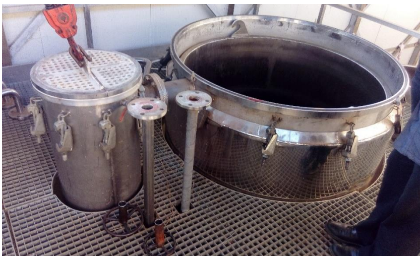
Slika 15. Uređaj za destilaciju.

U postupku destilacije bilje se stavlja na perforiranu podlogu destilatora kroz koju prodire vodena para. Tim postupkom se iz bilja ekstrahira eterično ulje odnosno pare koje se kondenziraju u daljnjem postupku. Eterično ulje se lako izdvaja s obzirom da je ulje lakše od vode. Sam proces destilacije traje oko 3 sata i njime se, obzirom na povišenu temperaturu i utjecaj vodene pare i organskih kiselina iz same biljke, mijenja miris, ali i sastav ulja (Šilješ i sur., 1992.).