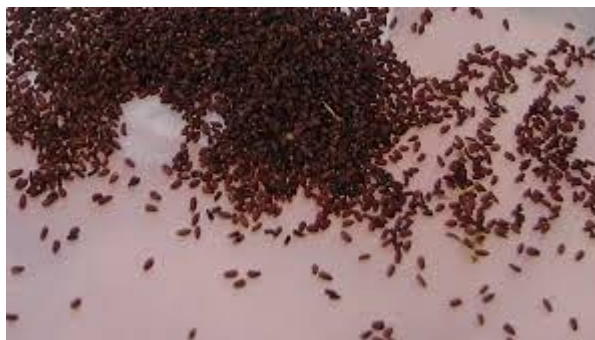
Slika 6. Sjeme smilja (preuzeto iz Pohajda, 2015.).

Smilje se može razmnožavati na dva načina i to generativno (sjemenom) (Slika 6) i vegetativno (reznicama ili dijeljenjem busena).