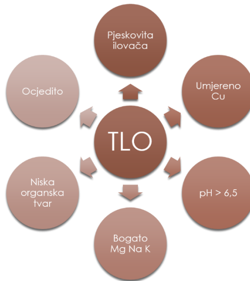
Slika 10. Zahtjevi smilja s obzirom na sastav tla

Smilje je trajnica i uzgoj na jednoj površini traje 5-8 godina te je preporučljivo planirati nasade smilja na površinama na kojima su ranije uzgajane kulture nakon kojih nije jaka zakorovljenost. Takve su kulture strne žitarice, leguminoze i okopavine.