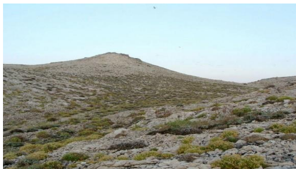
Slika 4. Samoniklo smilje (Foto original).

Obzirom na prepoznata brojna pozitivna svojstva biljke, smilje se od davnina prikuplja (Stanković i su., 2001.). S porastom komercijalnih potreba za ovom biljkom sve je više sakupljača te se Zakonom o zaštiti prirode propisalo uvjete sakupljanja smilja kako bi se vrsta očuvala. Ovim zakonom vremenski je ograničen period u kojem se smilje smije prikupljati. Temeljem mišljenja Državnog zavoda za zaštitu prirode sakupljanje smilja na području Dubrovačko neretvanske županije, otocima Splitsko-dalmatinske, Šibensko-kninske i Zadarske županije te na području otoka Paga odobreno je od 1. lipnja do 1. kolovoza, a na ostalim područjima od 15. lipnja do 15. kolovoza (Mucalo, 2015.).