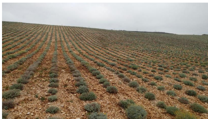
Slika 5. Nasad smilja.

Danas se nastoji ublažiti potreba za branjem samoniklog smilja intenzivnim uzgojem (Slika 5). Naime, tržišni trendovi doveli su do velike potražnje za smiljem kao ljekovite odnosno aromatične biljke. Uslijed toga dolazi do nekontroliranog branja samoniklog bilja i posljedično smanjenja biljnog fonda no i do svjesnosti poljoprivrednika o mogućnosti uzgoja smilja (Rajić i sur., 2015.).