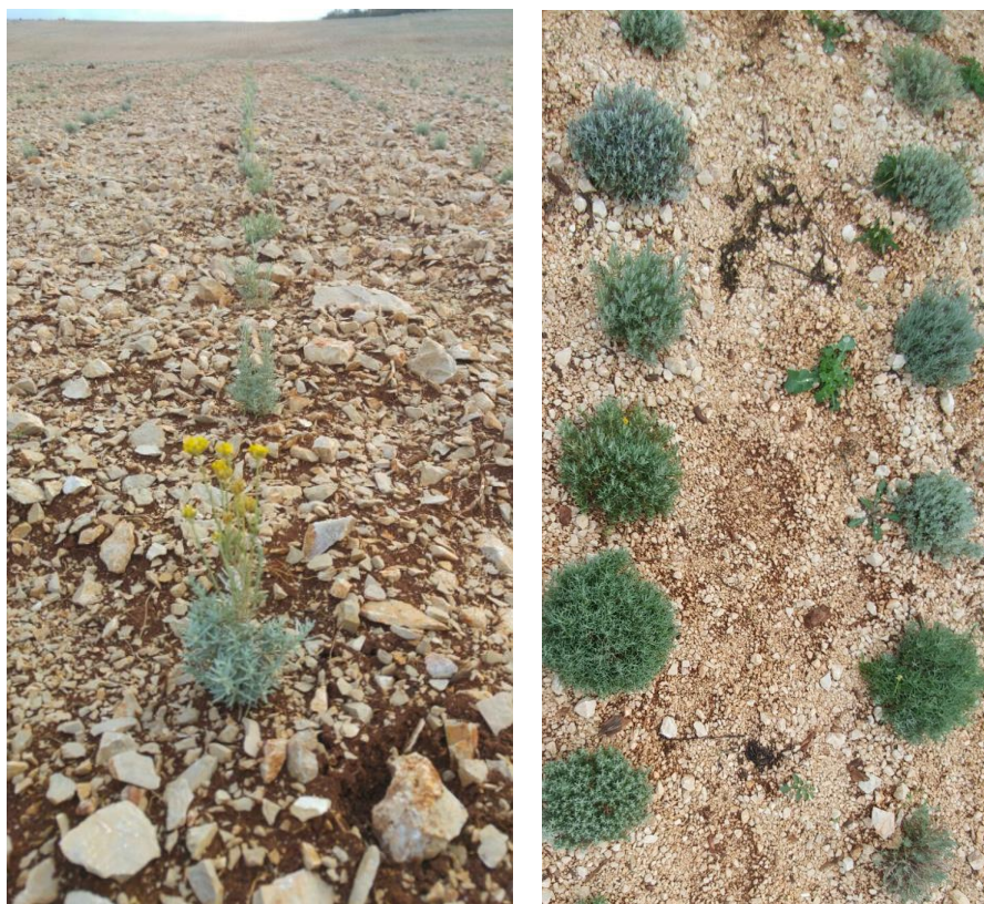
Slika 11. Mladi nasadi.

biljkama u redu 30-40 cm (Slika 11). Za sadnju jednog hektara nasada potrebno je osigurati oko 35000 presadnica (sadnja u redovima razmaka 70 cm te razmaka među biljkama u redu 40 cm).