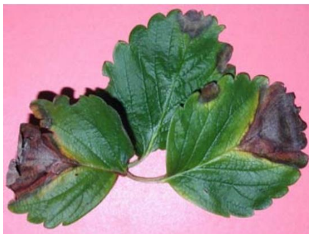
Slika 14. Palež lista (Miličević, T., 2015.)