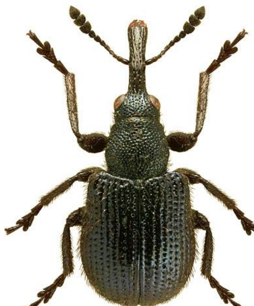
Slika 3. Pipa jagodine peteljke ( http://www.biolib.cz )

Prema Hill (1987.) pipa jagodine peteljke pripada porodici Curculionidae te je najveći štetnik bobičastoga voća iz te porodice. Jagoda je najčešći domaćin dok štete radi i na malinama, kupinama i borovnicima. Ženka rilom izbuši nekoliko rupica čime se prekida protok sokova te list i peteljka venu. Ženka odlaže jaja s donje strane svinute peteljke te buši komoricu u kojoj odlaže jajašca. Ličinke se hrane osušenim dijelovima pregrizene peteljke. Kada se razviju ličinke odlaze u tlo gdje se kukulje, a novi imago se javlja naredne godine. Odrasli oblici su sitni, 2-3 mm veličine, plavo-zelene boje s tankim i dugim rilom (Slika 3.). Jedna odrasla pipa na 100 m 2 može nanijeti ozbiljne štete (Maceljski, 1999.). Najveće su štete kod ranijih vrsta stoga je jako bitno tretirati tlo prije vegetacije jer se na taj način suzbijaju odrasli oblici. U Hrvatskoj ne postoje sredstva za zaštitu od pipe jagodine peteljke ( www.fis.mps.hr ).