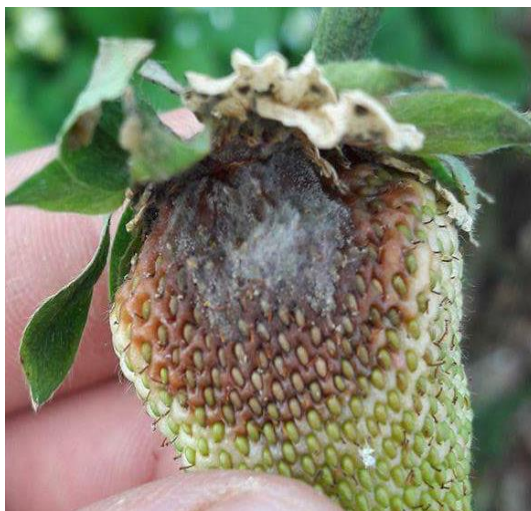
Slika 11. Početni simptomi zaraze s Botrytis cinerea

neupotrebljiv. Često se događa da bolest zahvati i cvjetove koji se osuše i izgledaju kao spaljeni. U početnim fazama razvoja uočavaju se smeđe i vlažne pjege neodređenog oblika (Slika 11.) te se kasnije na njima uočava karakteristična prevlaka. Dozvoljena sredstva za suzbijanje sive plijesni na jagodama su Scala, Switch 62 G i Signum ( https://fis.mps.hr ).