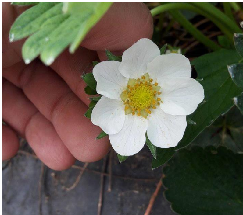
Slika 2. Cvijet sorte Joly

U radu Ostojić i sur. (2016.) utvrđeno je da termalna svojstva i toplinska stabilnost svježe jagode i jagodinog soka sorte Joly koji su uzgojeni pod različitim uvjetima uzgoja utječu na toplinsko ponašanje jagoda sorte Joly. Uzorci su testirani na temperaturama od -100^{\circ}\text{C} do 250^{\circ}\text{C} te je zaključeno da svježa jagoda ima slična termalna svojstva kao i jagodin sok te autori smatraju da su manja odstupanja nastala zbog različitog načina uzgoja.