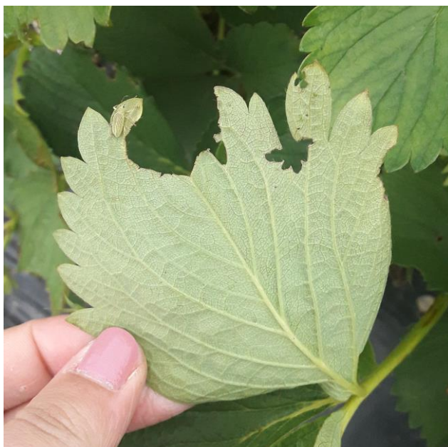
Slika 19. Simptomi napada pipe Polydrusus

Vizualnim pregledom 26. travnja 2017. godine utvrđena je pojava sive plijesni ( Botrytis cinerea ). Na jednom od 100 pregledanih biljaka unutar plastenika uočena je plijesan u slabom intenzitetu. Zaštita je obavljena 29. travnja 2017. godine koristeći botriticid. Početkom svibnja na vanjskoj jagodi uslijed niskih jutarnjih temperatura i mraza zabilježene su štete na plodovima i listovima. Šteta je uočena na 7 biljaka od 100 pregledanih.