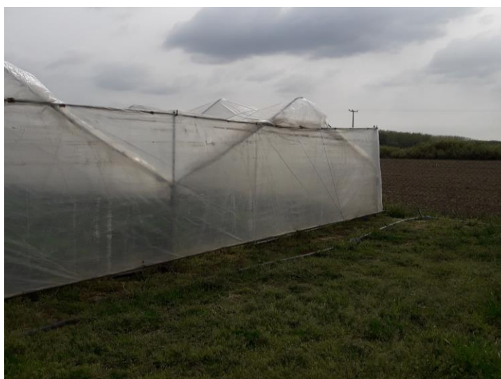
Slika 15. „Veronez“ tip plastenika

Gospodarstvo ima 14 plastenika za uzgoj jagoda. Plastenici su višetunelski „Veronez“, demontažni radi lakšeg preseljenja plastenika na novi nasad jer se u pravilu jagoda ponovo sadi svake 2-3 godine. Plastenici su postavljeni na ravnoj površini bez depresija. Dimenzije plastenika su 65m×5m površine 325 m 2 (Slika 15.).