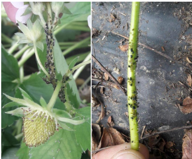
Slika 6. Lisne uši na jagodi

Kod suzbijanja lisnih uši vrlo je važno redovito pregledavati nasade jer one u kratkom vremenu mogu učiniti velike štete (Gotlin-Čuljak, 2015.). Dozvoljeno sredstvo u Hrvatskoj za suzbijanje lisnih uši u zaštićenom prostoru je Movento, a kod uzgoja na otvorenom dozvoljeno sredstvo je Pirimor ( https://fis.mps.hr ).