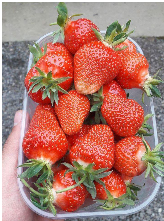
Slika 16. Plastična ambalaža za skladištenje jagode