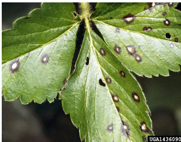
Slika 13. Simptomi obične pjegavosti lista jagode

Prema Paulus (1990.) bolest je manje opasna nego prije zbog pojave tolerantnih sorti. Takođe, danas zbog promjena u načinu uzgoja jagoda ova gljiva ne predstavlja tako veliki problem. Prvi simptomi bolesti vidljivi su u obliku malih crvenih pjega na površini mladih listova. S vremenom pjege rastu te sredina pjege poprima sivo-bijelo boju, a rubovi postaju crvenkastosmeđi (Slika 13.). Pjege se pojavljuju i na stabljikama gdje poprimaju izduženi oblik, na nekim dijelovima cvijeta i ponekad na plodovima. Gljiva prezimi na otpalom lišću i biljnim ostacima u obliku sklerocija i peritrecija. Širenju pjega pogoduje vlažno vrijeme i niske temperature. Suzbijanje je teško zbog jako malo dozvoljenih sredstava za uporabu. Dozvoljeno sredstvo za suzbijanje obične pjegavosti lista jagode kod uzgoja jagode na otvorenome je Cuprablau-z ( https://fis.mps.hr ).