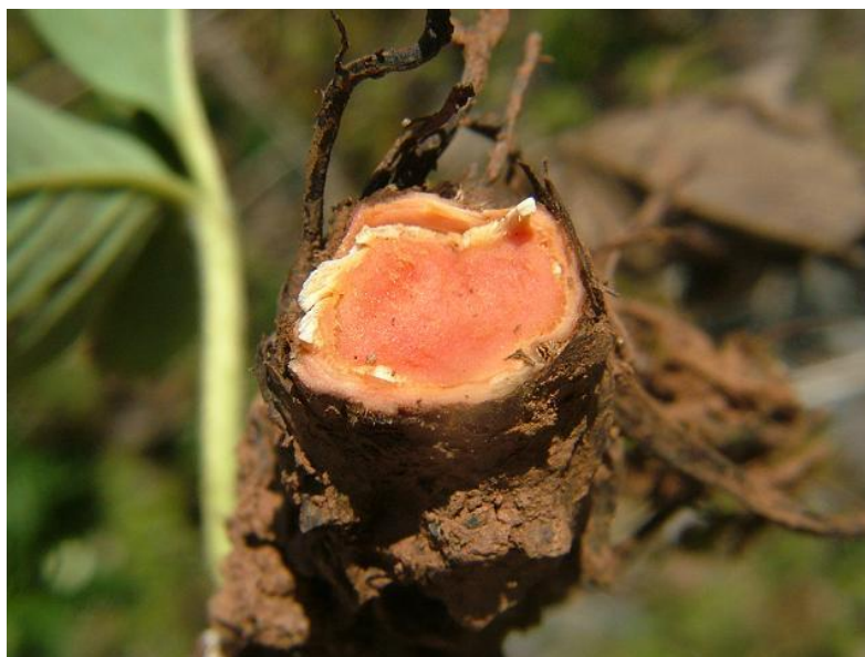
Slika 12. Presjek korijena zaraženog s Phytophthora fragariae

Prema Tomić (2015.) Phytophthora fragariae je jedna od najopasnijih uzročnika bolesti u proizvodnji jagode te se nalazi na karantenskoj listi uzročnika bolesti. Bolest napada korjenov vrat, a uzročnik je gljiva Phytophthora fragariae . Nakon zaraze tlo ostaje zaraženo od tri do 15 godina. Simptomi su vidljivi već u proljeće kada biljke zaostaju u rastu, peteljke postaju kraće te stari listovi mijenjaju boju od ruba prema unutra i postaju crvenkastosmeđi. Zaražene biljke često ne stvaraju plodove, a i ako daju plod on je sitan i suši se. Korijen stvara jako velik broj sekundarnih korjenčića. Kod presjeka korjenova vrata uočava se promjena boje. Zaraženi dio pokazuje karakterističnu crvenu boju (Slika 12.) za razliku od zdravog žutog dijela. Kasnije korijen počinje dobivati smeđu boju i trune. Zarazu vrše zoospore koje inficiraju vrh korijena te se kroz korjenčiće dalje širi micelij koji ulazi u središnji cilindar korijena. Novi sporangiji nastaju na površini korijenja, a oospore nakon spajanja anteridija i oogonija nastaju u središnjem cilindru. Nakon raspadanja korijena oospore ostaju aktivne u tlu dugi niz godina. Preventivni način zaštite je sadnja tolerantnih sorata na gljivu, a dozvoljena sredstva u Hrvatskoj za suzbijanje ove gljive su Neoram WG i Ridomil Gold MZ Pepite ( https://fis.mps.hr ).