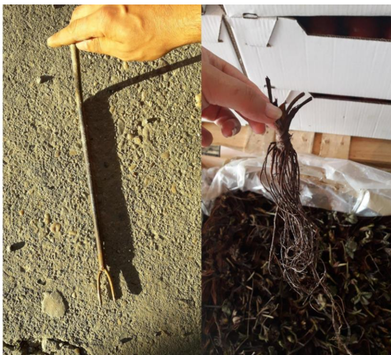
Slika 18. a) sadač jagoda, b) frigo sadnica