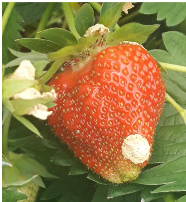
Slika 1. Jagoda sorte Clery

U radu Djilaš i sur. (2014.) istraživala se kvaliteta plodova sorata Clery i Joly. Zaključeno je da Joly ima veći postotak suhe tvari, manju kiselost, veću masu te istu pH vrijednost kao i Clery vrsta. Ovim istraživanjem dokazalo se da vanjska obilježja plodova (masa, veličina..) nisu pokazatelji njihove nutritivne vrijednosti.