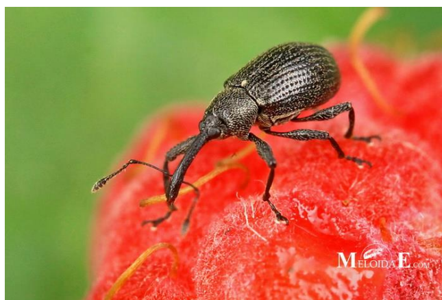
Slika 4. Malinin cvjetar ( https://www.biolib.cz )

Prema Maceljskom (1999.) suzbijati se može uništavanjem divljih biljaka hraniteljica oko nasada jagode i maline, prikupljanjem zaraženih ostataka te kemijskim mjerama. Kemijskim putem se suzbija ako je zaraženo 2-5% pupova. Ona se provodi u proljeće kada počinje ishrana imaga tj. kada se uoče štete na pupovima. Tretiranje je najbolje obaviti predvečer zbog pčela. Dozvoljeno sredstvo za suzbijanje malininog cvjetara je Calypso SC 480 ( www.fis.mps.hr ).