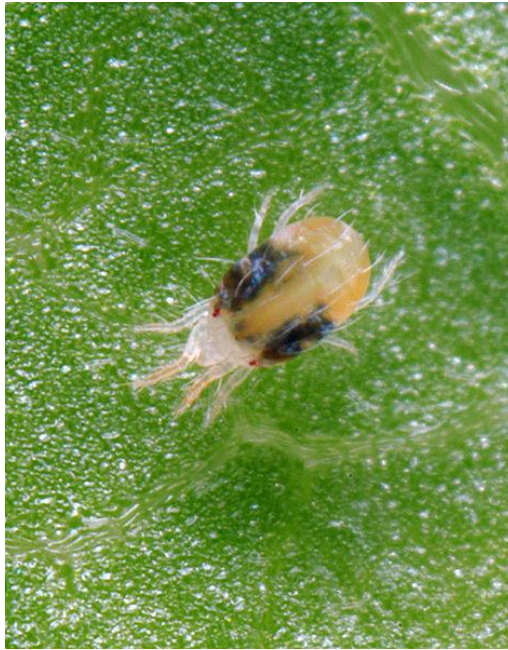
Slika 8. Koprivina grinja