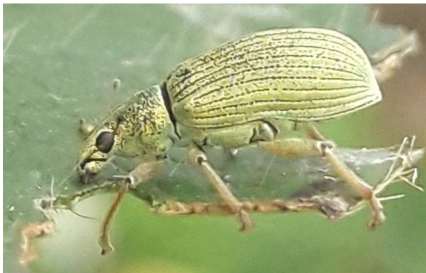
Slika 10. Pipa roda Polydrusus

potencijalnih štetnika i virusa. Listovi su prebačeni u tube napunjene destiliranom vodom i prebačeni u plastične kutije na hladno i tamno mjesto. Štetnici su skupljeni mrežastim vrećama s drveća. Spremljeni su u plastične kutije te izgladnjivani 24 sata prije početka pokusa. Za praćenje hranidbe korišteni su cijeli listovi zbog toga što se ova pipa uglavnom hrani rubnim dijelovima listova. Pipama je dozvoljeno da se hrane 72 sata. Dokazana je veća konzumacija žute breze, lipe, šćernog javora, crvenog javora i crnog graba. Od ponuđenih uzoraka dokazano je da P. sericeus preferira žutu brezu, lipu i crni grab. Vrlo je bitno naglasiti da se P. sericeus hranila s svima ponuđenim listovima što potvrđuje njezinu polifagnošću.