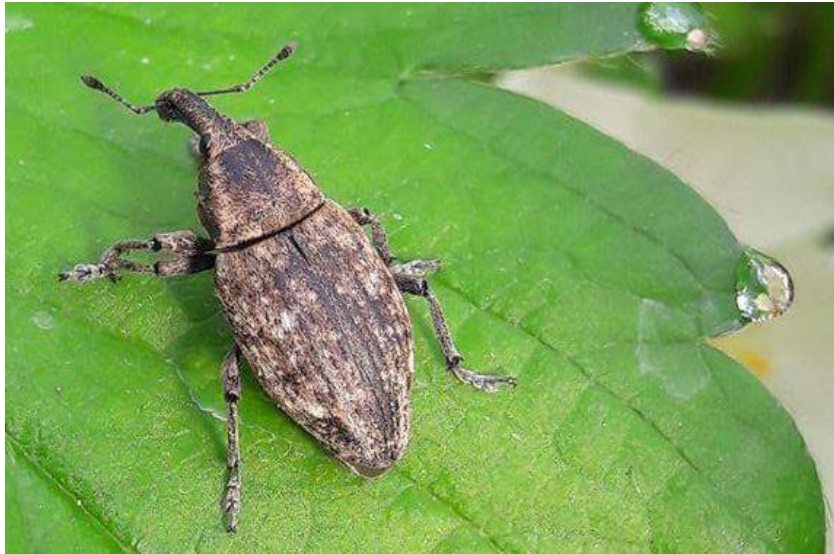
Slika 9. Lepyrus capusinus