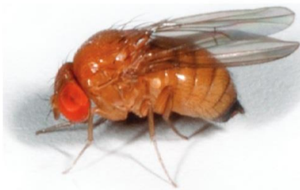
Slika 5. Drosophila suzukii (Seljak, G., 2015.)

plodova. Plodovi propadaju na mjestima gdje se ličinke kukulje i gube na tržišnoj vrijednosti. Štetnik prezimi kao imago. Prema Seljak (2015.) štetnici se mogu pratiti hranidbenim atraktantima i vizualnim pregledom. Koristi se boca na kojoj se izbuše četiri simetrične rupe. Ambalaža se puni s jabučnim ili vinskim octom. Mehaničke mjere uključuju hitno uništavanje zaraženog materijala s proizvodne površine jer su izvori zaraze (Masten-Milek i sur., 2015). U Hrvatskoj ne postoji registrirano sredstvo za suzbijanje octene mušice ploda ( https://fis.mps.hr ).