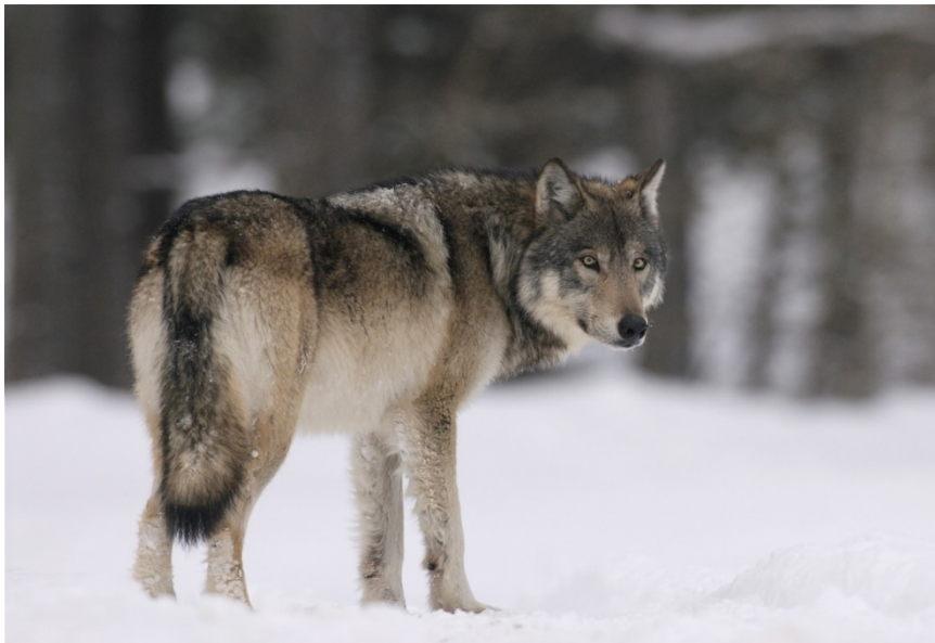
Slika 2. Sivi vuk, Canis lupus L.