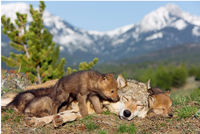
Slika 5. Vučica sa štencima

vučice u brlog koji je sama priredila za njih. Mladunci uglavnom budu teški oko 500 g i dugački oko 15 cm, a u leglu obično bude od 4 do 7 štenaca. Mladi ostaju slijepi i gluhi do dva tjedna, a sišu do 2 mjeseca. Oči su im plave boje prva tri mjeseca, zatim poprimaju žutu boju. Kada navršše mjesec dana, uz majčino mlijeko, često se hrane i poluprobavljenom hranom, koju im povrate stariji članovi čopora (Štrumbelj, 2012.). Kada se približe ljetni mjeseci, mladi se skupa s ostatkom čopora sele na tzv. okupljališta gdje odrastaju. Tijekom svog odrastanja mogu promijeniti nekoliko mjesta, odnosno okupljališta ukoliko dođe do nedostatka hrane ili postoji opasnost od drugog čopora. Početkom zime, postanu dovoljno veliki te se mogu kretati skupa s čoporom po njihovom cijelom teritoriju.