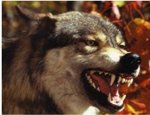
Slika 4. Sivi vuk s prepoznatljivom zubnom strukturom

Glava vuka prilagođena je hvatanju i jedenju plijena. Izdužena je prema naprijed, u prosjeku je duga 25 cm, a široka do 14 cm (Kusak, 2004.). Na vučjoj vilici odnosno čeljusti su smješteni snažni žvačni mišići i ukupno 42 specijalizirana zuba, zubne formule I: 3/3, C: 1/1, P: 4/4, M: 2/3 (Štrumbelj, 2012.). Vuk ima tipično mesoždersko zubalo, u kojem dominiraju očnjaci i pretkutnjaci. Očnjaci služe za hvatanje i usmrćivanje plijena, dok četvrti gornji pretkutnjak skupa s prvim donjim kutnjakom čine „škare“ koje vuku omogućuju lako rezanje, odnosno usitnjavanje komada mesa. Za lomljenje kostiju, vuk se koristi kutnjacima. Posljednji kutnjak na vilici je zakržljao ( http://www.life-vuk.hr ; Kusak, 2004.).