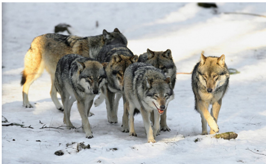
Slika 6. Čopor vukova

Kada sustignu plijen, najbliži vuk će ga napasti. Uhvaćenim plijenom se prvo hrani dominantni par, zatim njihovi ovogodišnji mladi, a na posljednjem mjestu potomci iz prijašnjih godina. Alfa par se hrani najboljim dijelom plijena. Ukoliko je plijen bio velik, čopor će se zadržati u njegovoj blizini dok ga cijeloga ne pojede. Ako se dogodi da hrane nema dovoljno za sve članove čopora, tada dolazi do disperzije (pojedini članovi napuštaju svoj matični čopor).