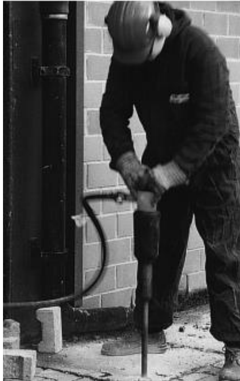
Slika 1. Izvođenje građevinskih radova korištenjem vibrirajućeg alata