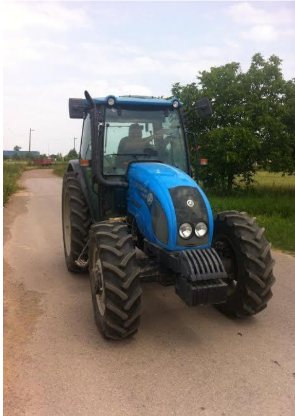
Slika 4. Mjerenje razine traktorskih vibracija na asfaltu