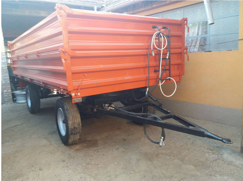
Slika 20. Završena prikolica „ZMAJ“