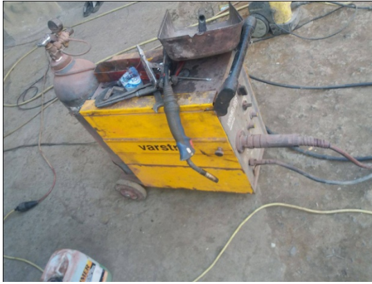
Slika 2. „Varstroj 160“