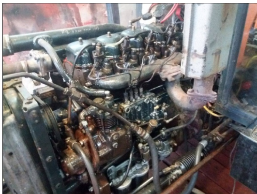
Slika 10. Motor prije rastavljanja

Novi dijelovi su ugrađeni u motor uz pomoć privatnog mehaničara, slika 16., te je u njega usuto novo motorno ulje, slika 17., nakon čega je motor pušten u probni rad 2 sata.