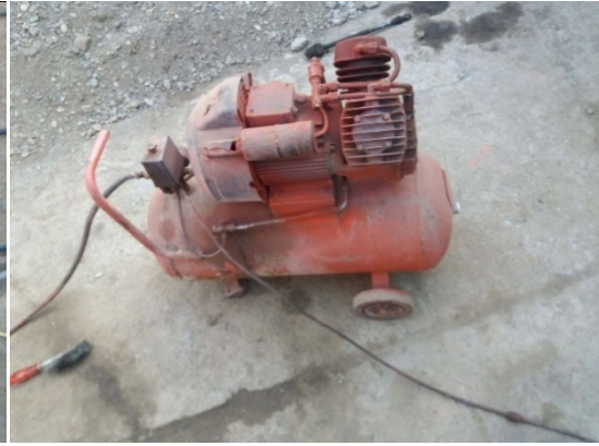
Slika 3. kompresor „Hobitool“