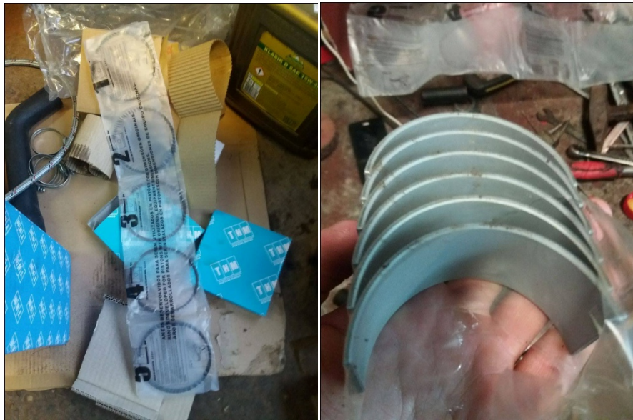
Slika 14. Novi leteći ležaji i klipni prsteni