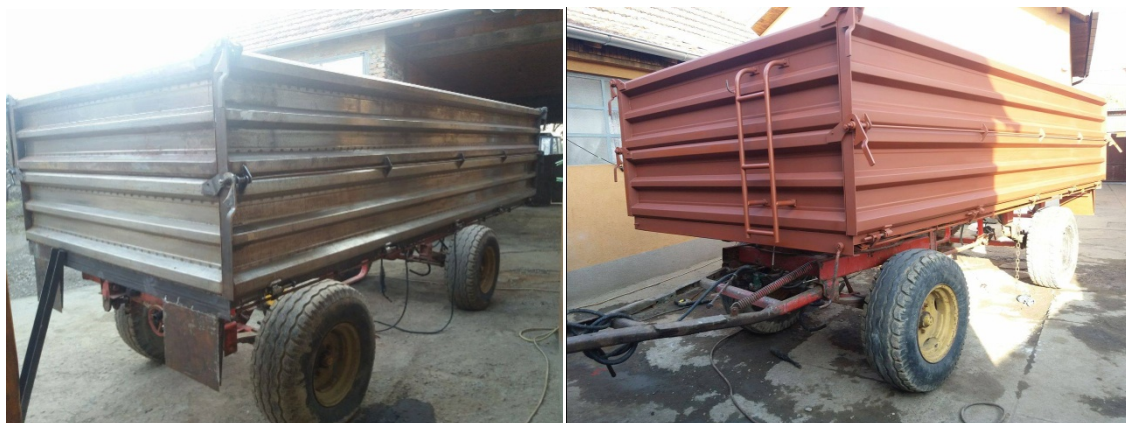
Slika 19. Prikolica „ZMAJ“ tijekom radova