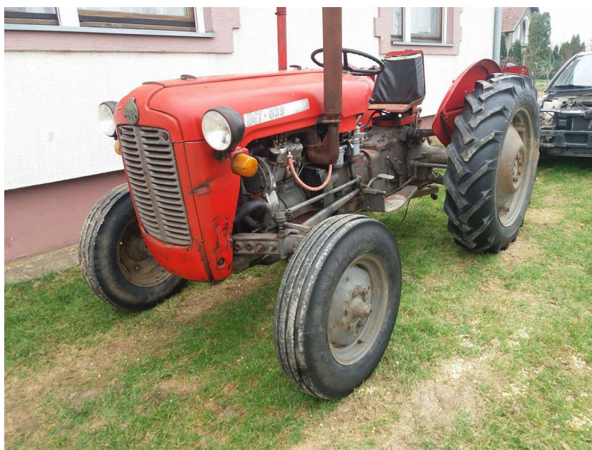
Slika 8. Traktor „IMT 539“

Traktor „IMT 539“ , slika 8., ima trocilindrični dizelski motor snage 28kW/39KS.