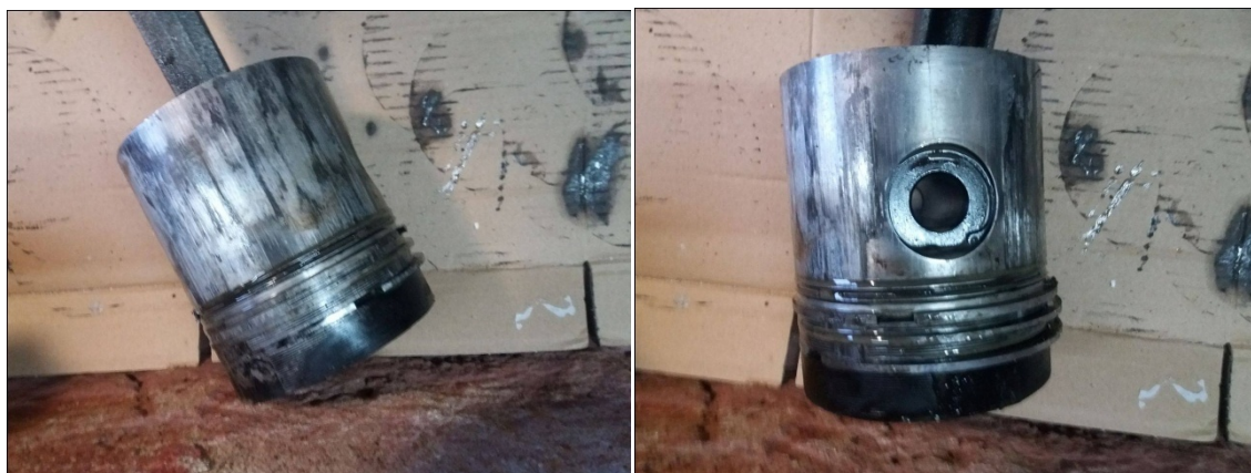
Slika 13. Oštećeni klipovi i klipni prsteni