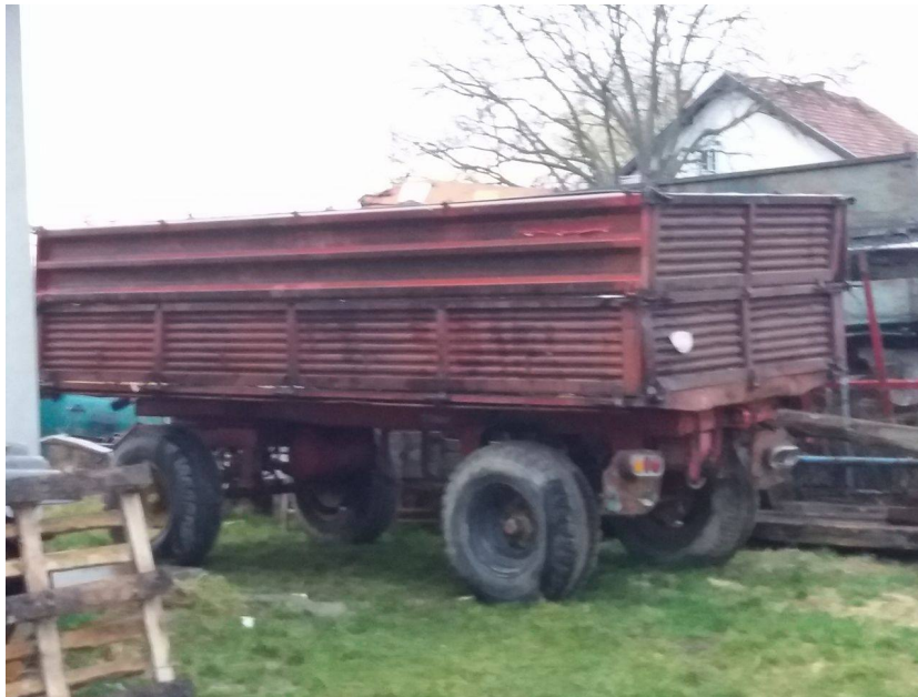
Slika 18. Prikolica „ZMAJ“ prije radova

Popravak prikolice „ZMAJ“ nosivosti 8 tona su obavili članovi gospodarstva u priručnoj radionici. Prikolica je kupljena u devastiranom stanju, korodirana, ispucala, nebojana, bez svjetlosne signalizacije i s lošim gumama, slika 18. Popravkom su na prikolicu stavljeni većinom novi dijelovi osim šasije (stavljene su nove stranice, grede, podnice, novi stupovi, naplatci i pneumatici bez zračnica koji su stabilniji na cesti, novi uređaj za kočenje, ruda i električna instalacija sa svjetlosnom signalizacijom) slika 19.