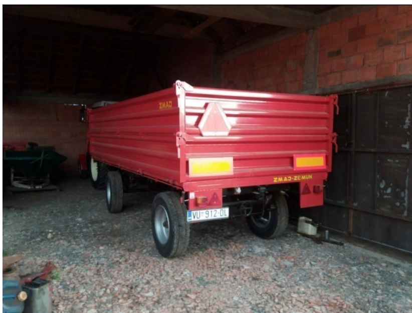
Slika 23. Garažiranje "ZMAJ"