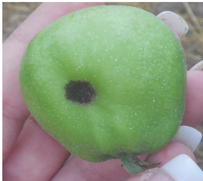
Slika 3. Krastavost i deformacija ploda