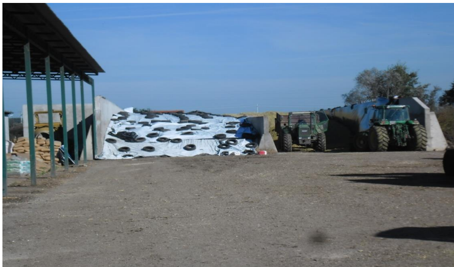
Slika 5. Silaža na poljoprivrednom gospodarstvu