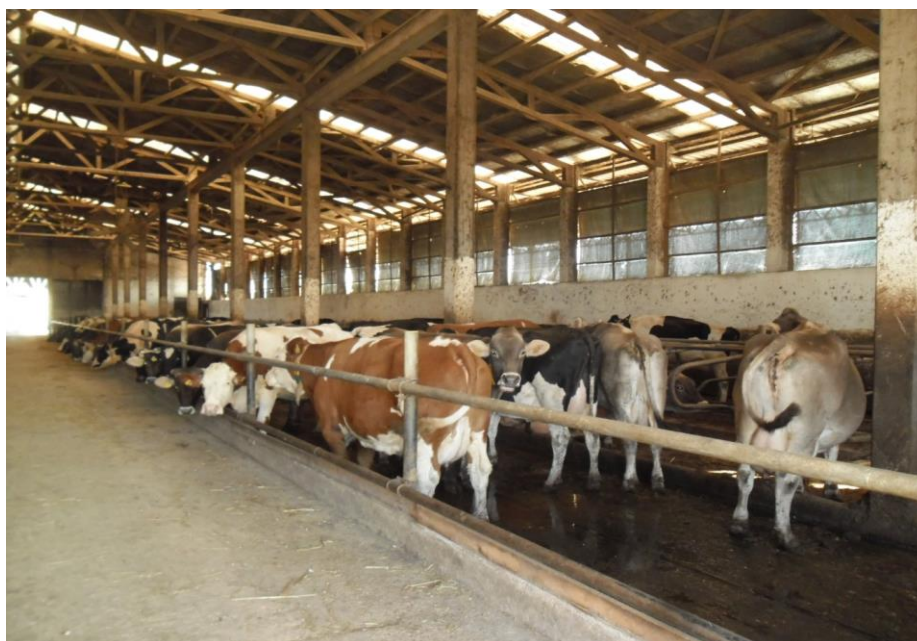
Slika 1. Slobodan način držanja krava