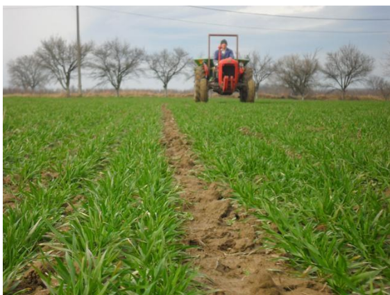
Slika 2. Prva prihrana pšenice