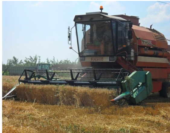
Slika 5. Žetva pšenice

Na Obiteljskom poljoprivrednom gospodarstvu Pero Barišić – Jaman 2014./2015. godine žetva je bila obavljena od 1. do 3. 7. 2015. godine. U narednoj vegetaciji, 2015./2016. godine, žetva je obavljena pomoću kombajna Deutz Fahr 1600 s klasičnim pšeničnim hederom 30. 6. 2016. godine (Slika 5.). Tijekom žetve na lijevoj strani hedera došlo je do osipanja zrna pšenice što svakako treba spriječiti kako bi se smanjili direktni gubici (Slika 6.). Odmah nakon žetve vlasnik gospodarstva je odvezio prikolice sa pšenicom i istovario u Žito d.o.o. Gorjani (Slika 7.).