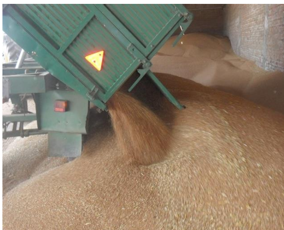
Slika 7. Istovar pšenice