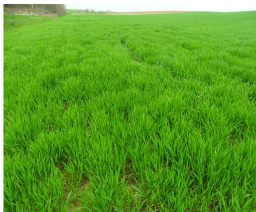
Slika 3. Druga prihrana pšenice