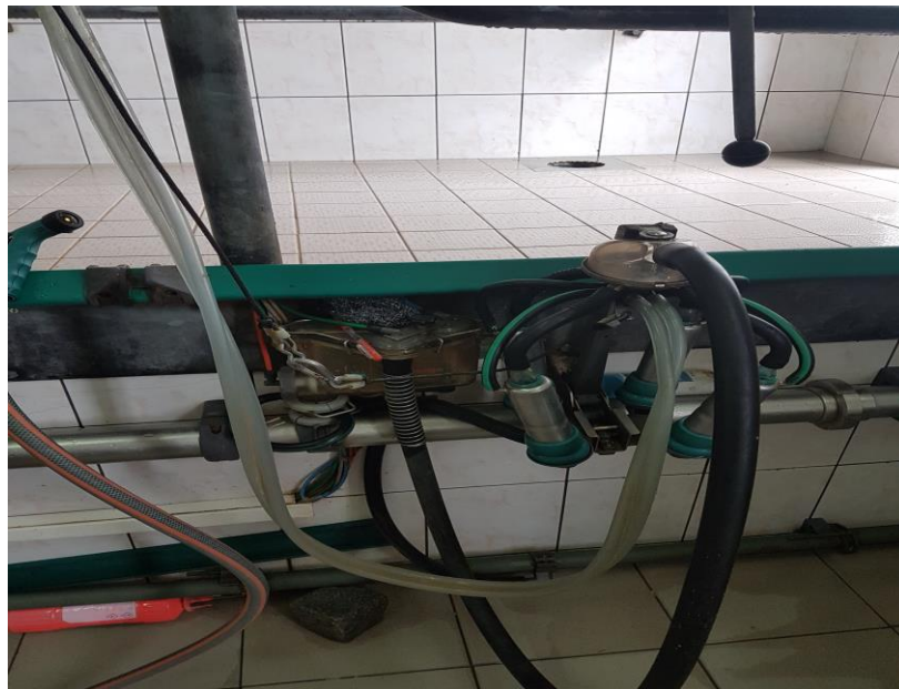
Slika 17. Prikaz sisaljki i sisnih guma