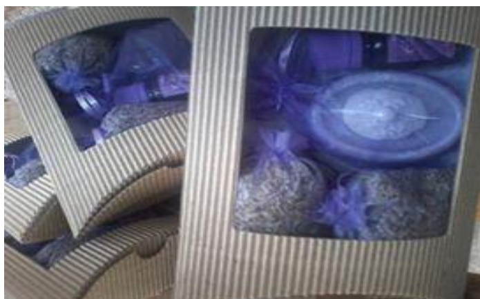
Slika 12. Poklon paket sa proizvodima sa OPG-a Sabadoš

U promociji proizvoda im je pomogla stranica na društvenoj mreži Facebook gdje redovno stavljaju slike svojih proizvoda, a redovno objavljuju zanimljive podatke o ljekovitim svojstvima lavande te zanimljivosti vezane uz nju. Za vrlo kratko vrijeme krajnji kupci, zapravo građani Vukovara i okoline saznali su za proizvode od lavande koja se proizvodi u okolini i bili su vrlo zainteresirani na samom početku proizvodnje te nije bilo potrebe za velikim aktivnostima pri promoviranju proizvoda na OPG-u Sabadoš.