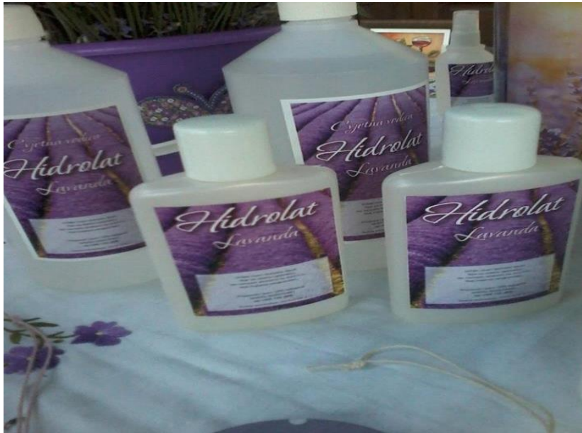
Slika 10. Cvjetna vodica ili hidrolat od lavande

Hidrolat od lavande je cvjetna vodica nastala kao nusprodukt destilacije lavandinog ulja. Ima slična svojstva kao ulje ali slabije djeluje od ulja. Razlog tome je to što ima manju količinu ulja. Najčešće se koristi kao tonik u kozmetici.