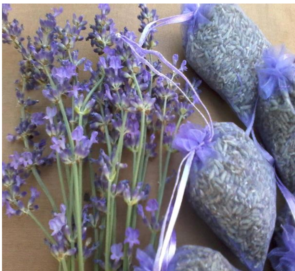
Slika 7 i 8. Suhi cvijet u vrećicama

Ulje ima također umirujuća svojstva, neke od "čudesnih" svojstava, osim umirujućeg djelovanja, su to da smanjuju probleme sa kožnim iritacijama, manjim opekotinama, opekotinama od sunca i . Također će pomoći kod ugriza kukaca i modrica te pomoći će tako i kod zacjeljenja te kod opuštanja napetih mišića.