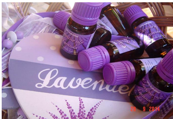
Slika 9. Ulja od lavande u pakiranju od 10 ml

Ulje ima također umirujuća svojstva, neke od "čudesnih" svojstava, osim umirujućeg djelovanja, su to da smanjuju probleme sa kožnim iritacijama, manjim opekotinama, opekotinama od sunca i . Također će pomoći kod ugriza kukaca i modrica te pomoći će tako i kod zacjeljenja te kod opuštanja napetih mišića.