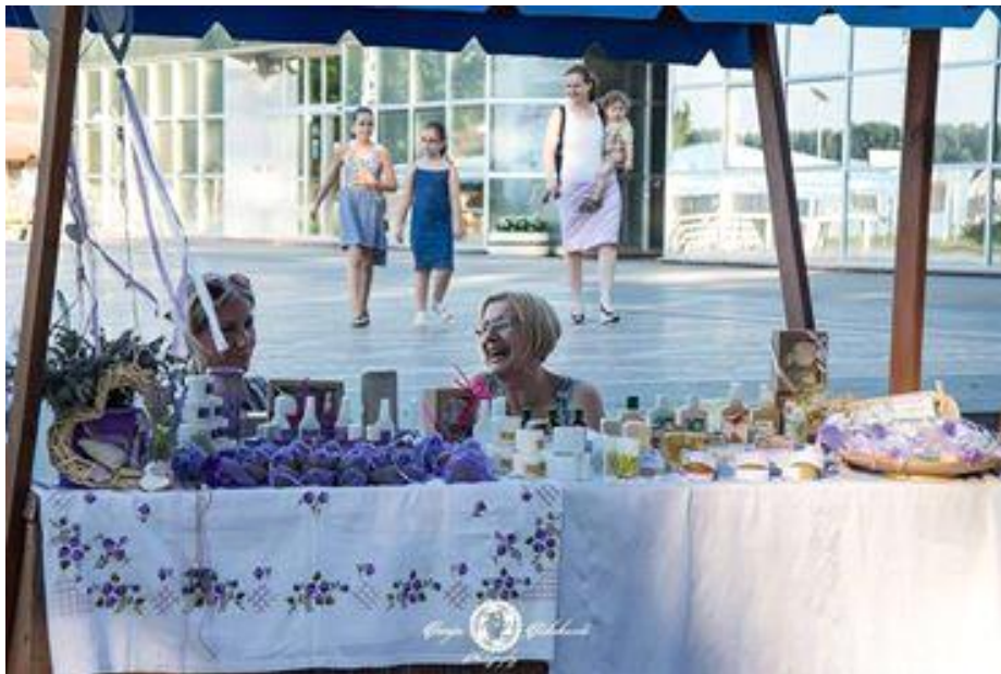
Slika 11. Događaj "Čekam te na korzu" u Vukovar