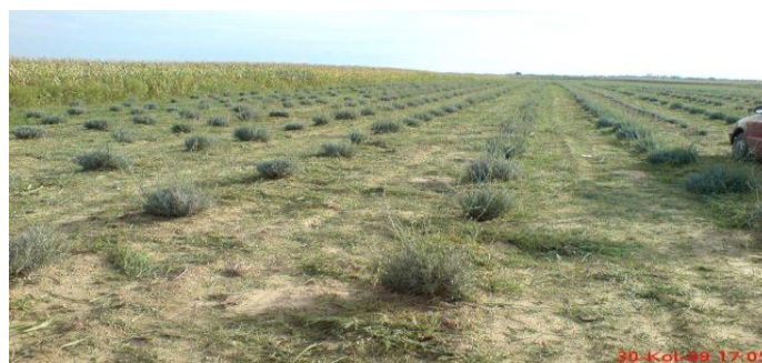
Slika 1. Lavanada godinu dana nakon sjetve

biljka veća, ima i veću cijenu. Presadnice lavandina za proljetnu sadnju imaju i do 30 % nižu cijenu u odnosu na one namijenjene za sadnju u jesen. Na OPG-u Sabadoš sadnice su nabavili su od OPG-u Vera Trampus iz Belišća koji se bavi uzgojem sadnica. Cijena presadnica je bila 5 kn po komadu (srednje razvijene sadnice). Hibridna lavanda se sadi na razmak među redovima 180 ili 200 cm, a unutar reda 50 – 60 cm, uz sklop 9.200 – 10.000 sadnica po hektaru.