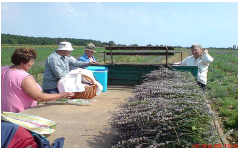
Slika 6. Slaganje ubranih cvjetova lavande na prikolicu

Glavni proizvodi lavande je ulje. Od jednog odrasli grm lavande (3 godine i više) ima prinos od 1 kg svježeg cvijeta. Prosječni prinos eteričnog ulja je 1,5% eteričnog ulja po grmu, to je oko 15 grama. Na jednom hektaru na kojem je posađena lavanda nalazi se oko 8.000 tisuća grmova.