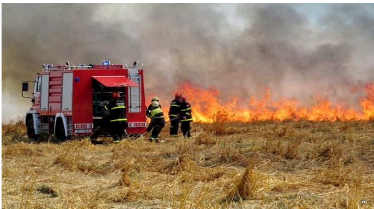
Slika 8. i 9 . Vatrogasci pozvani na teren zbog paljenja korova