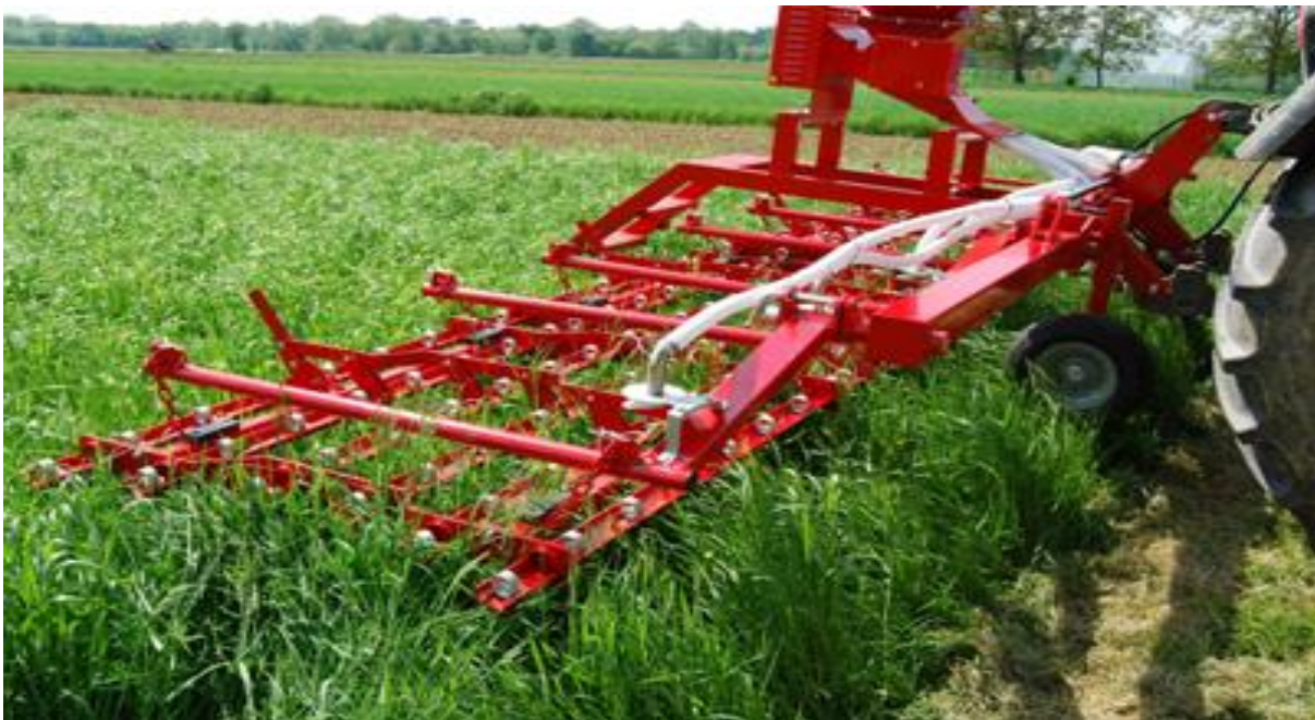
Slika 5. Drljača plijevilica

Tanjuračama možemo uništiti one korove koji se šire generativno, ali vegetativnim korovima ćemo omogućiti lakše širenje podzemnim dijelovima. Drljanjem perastim drljačama sa zupcima uništavamo korove zajedno s pokoricom (Slika 5.). Valjanjem možemo potaknuti rast i razvoj korova te ih poslije možemo lakše uništiti. Plijevljenjem korov čupamo iz tla bilo ručno ili strojno. Ručni način plijevljenja je težak i ekonomski neprihvatljiv posao, te tijekom njega dolazi do gaženja usjeva gustoga sklopa. Najbolje vrijeme plijevljenja je poslije kiše, jer se tada korov najlakše čupa iz tla. Iščupanu masu moramo izbaciti na površinu koja je udaljena od polja što dalje moguće, da se korov ne bi opet "primio". Prema raznim navodima smatra se da je plijevilica jedan od najvažnijih strojeva u ekološkoj proizvodnji, bez kojeg se ne može imati kvalitetna i uspješna obrana od korova (Kisić, 2014).