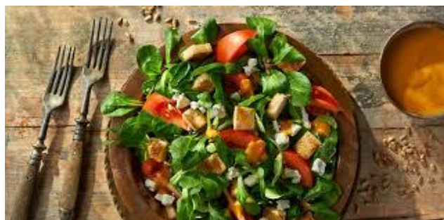
Slika 6. salata od matovilca i rajčice

Matovilac se bere u rano proljeće kao „prva“ salata. Vrlo je dobar izvor vitamina C i željeza, a može sadržavati i do deset puta više vitamina nego ostale salate glavatice. Najčešće se poslužuje uz jela od ribe i bijelog mesa te kao vrlo zanimljiv dodatak širokoj paleti miješanih salata i sendviča. Salata od matovilca, svježe rajčice i vlasca (slika 6.) odlično ide uz lasanje, a salata od rotkvice i matovilca ide odlično gotovo uz svako mesno jelo.