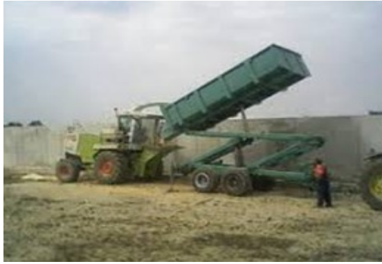
Slika 20. Usitnjavanje zrna VVK