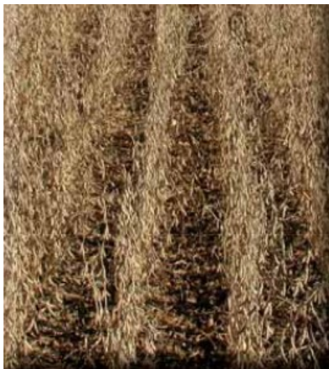
Slika 22. Sorta Ika