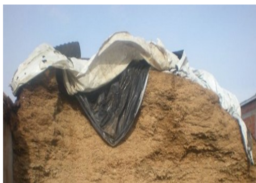
Slika 9. Horizontalni silos (foto: D. Banožić, 2015.)