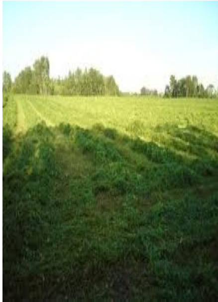
Slika 25. Pokošena lucerna