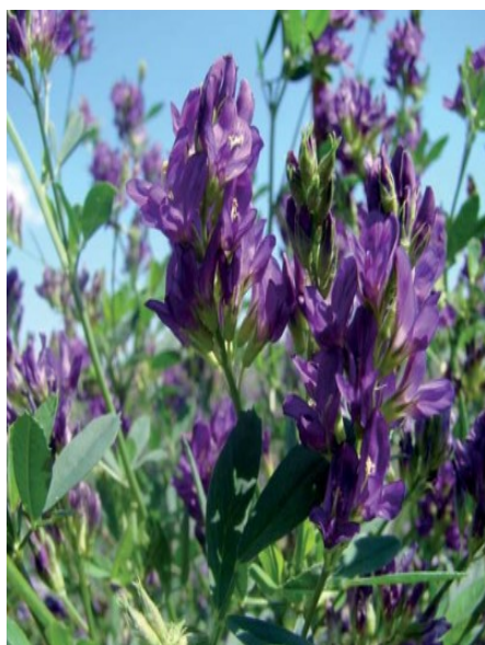
Slika 24.Lucerna OS66

Između pojedinih otkosa mora proći dovoljno vremena da se sintetiziraju dovoljne količine organske tvari za obnavljanje lucerne i ishranu korijena. Ovaj razmak između otkosa ne bi smio biti kraći od 35 dana. Visina košnje ovisi o pupovima na glavi korijena, a najčešće je 4 – 6 cm. Posljednji otkos, pred zimu kosimo nešto više na 10 – 12 cm, a za prezimljavanje i uspješno kretanje vegetacije nakon zime trebalo bi između posljednjeg otkosa u jesen do prvog mraza proći 50-ak dana. Lucernu treba kositi predvečer. Lucerna se na ovom OPG-u koristi kao sijeno. Gubici su pri ovakvom načinu spremanja veliki, jer tijekom preokretanja i skupljanja dolazi do opadanja lista. Za košnju lucerne (Slika 25.)koriste diskosnu kosačicu s gnječilicom čime se ubrzava prosušivanje za 1 – 2 dana i smanjuju gubici. Pri spremanju sijena pod djelovanjem topline sunca i vjetra smanjuje se sadržaj vlage sa 70 – 90% u pokošenoj masi na 15 – 20% u sijenu. Gubici tijekom sušenja i spremanja sijena variraju u širokom rasponu od 15 do 100% od početne suhe mase zelene krme. Sušenje u relativno dobrim uvjetima uzrokuje znatno manje gubitke koji iznose oko 15 – 18% , ali kiša povećava gubitak do 30% , a u izrazito lošim uvjetima sušenja može biti izgubljena sva hranjiva krme. Većina gubitka se dogodi za vrijeme skidanja, sušenja i transporta, a samo 5% za čuvanja sijena. Na polju sušeno sijeno balira se do 18% vlage u rolo bale (Slika 26.).