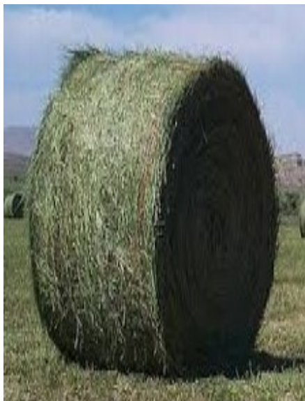
Slika 26. Rolo bala (foto:D.Banožić, 2015.)