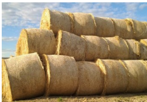
Slika 10. Valjkaste bale slame (foto: D. Banožić, 2015)