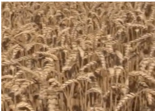
Slika 15. Sorta Apache