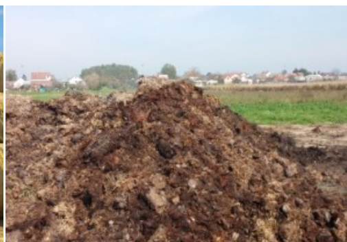
Slika 11. Stajnjak deponiran u polju