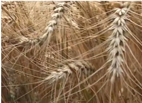
Slika 16. Sorta Sofru