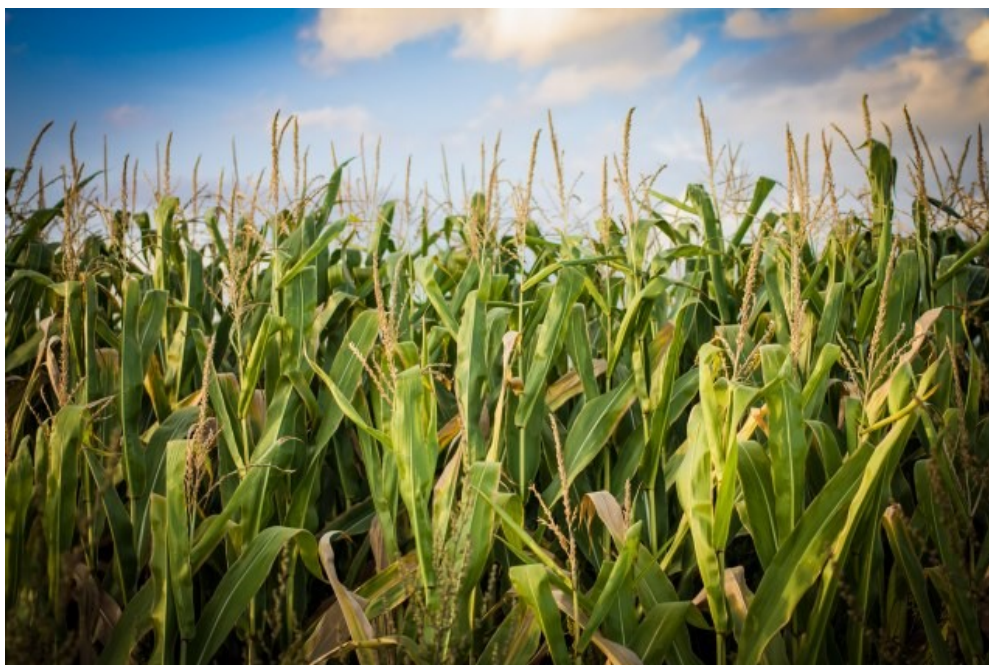
Slika 17. Kukuruz u polju (foto: D.Banožić, 2015.)