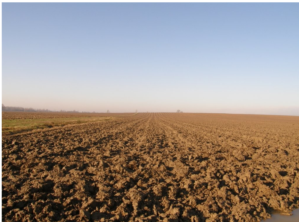
Slika 5. Poorano zemljište (foto: D. Banožić, 2015.)

OPG Ivan Pečić iz Cerne ( u daljem tekstu OPG) bavi se ratarskom proizvodnjom na ukupno 230 ha zemlje. Od toga je 180 ha vlastita (Slika 5.) a ostalih 50 ha je privatno zemljište u zakupu. Sjetvenim planom za 2014./ 2015. godinu zasijali su 75 ha pšenice ( 25 ha sjemenske i 50 ha merkantilne), 90 ha soje i 55 ha kukuruza. Posijana je i lucerna na 10 ha koja se planira koristiti naredne 4 godine. Prevladavajući tipovi tla na ovim površinama su černoze i eutrično smeđe tlo.