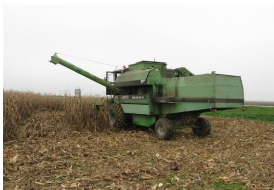
Slika18. Vršidba kukuruza