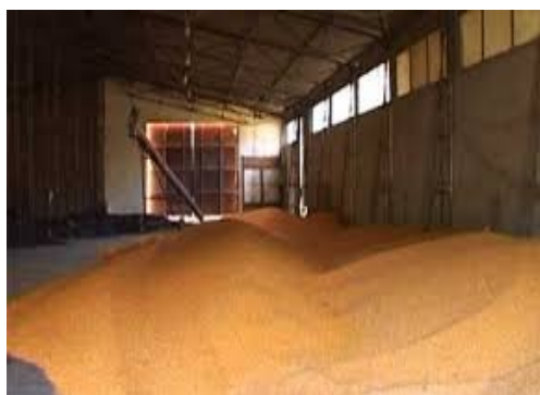
Slika 8. Podno skladište za kukuruz

otvorenom dijelu dvorišta, i nakon toga prekrivaju najlonima koji ih štite od nepovoljnih vremenskih prilika sve do njihovog korištenja. Ovakvim načinom čuvanja se smanjuje propadanje i gubitak slame koja služi kao stelja tijekom čitave godine. Stajnjak (Slika 11.) se nakon čišćenja staje odvozi na polje gdje se deponira na betonsku pistu ili se odmah razbacuje ukoliko je polje slobodno. Kapacitet površine za deponiranje je dovoljan za čitavu godinu, odnosno njihovo pražnjenje se obavlja jednom godišnje. Traktori kao i ostala potrebna mehanizacija parkirana je ispod natkrivenih garaža.