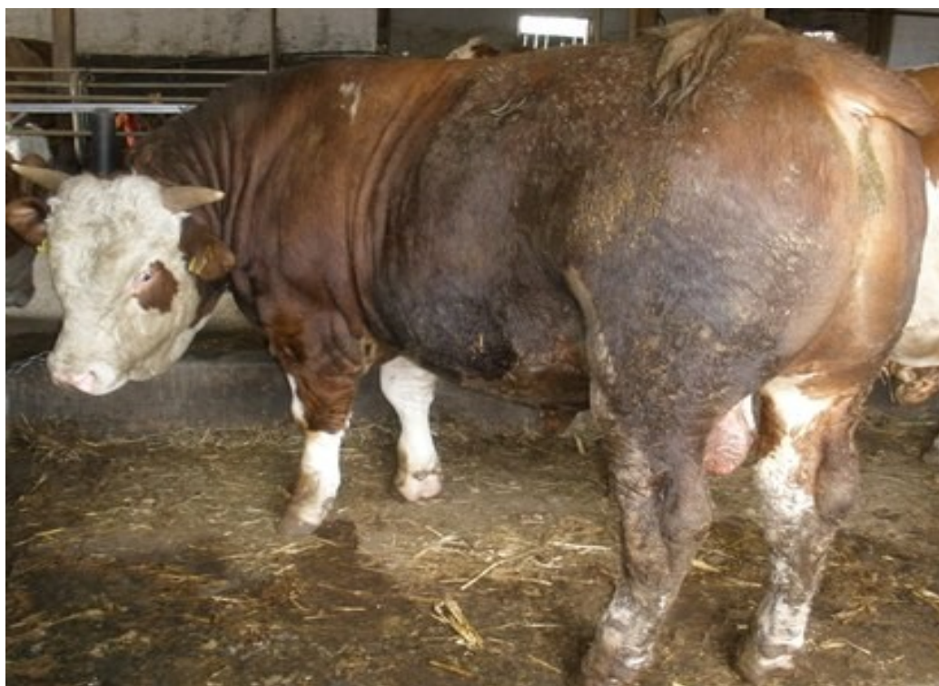
Slika 2. Govedo simentalске pasmine težine oko 500 kg