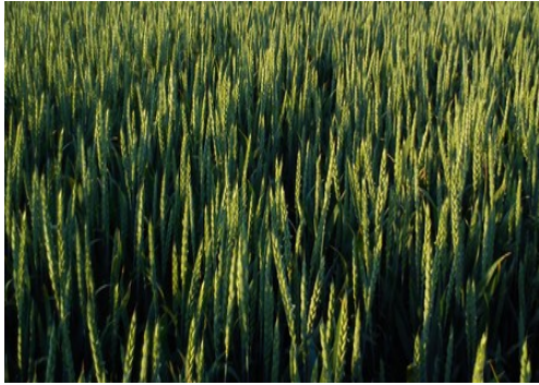
Slika 14. Sorta Graindor (foto: D.Banožić, 2015.)