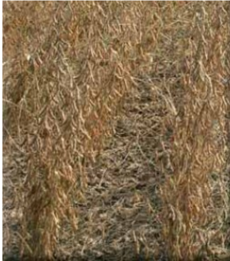
Slika21.Sorta Korana