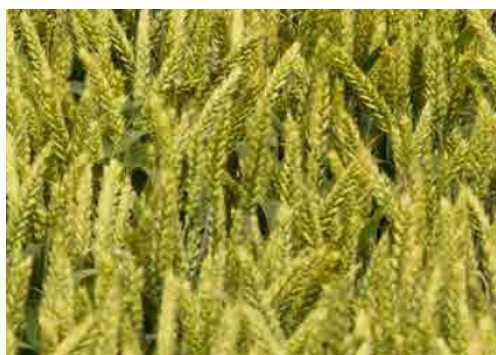
Slika 13. Sorta Katarina