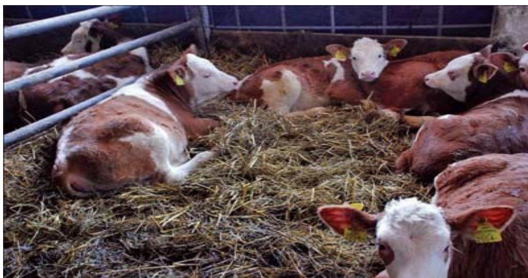
Slika 7. Držanje junadi na dubokoj prostirci