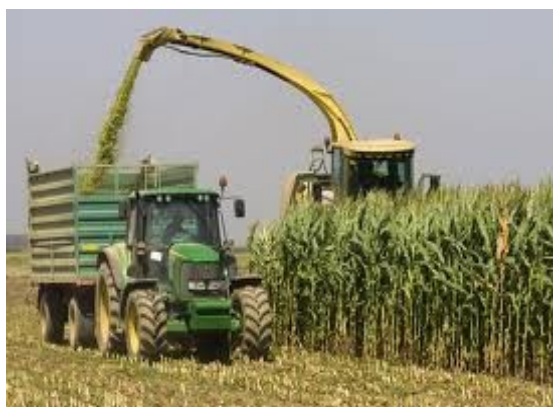
Slika 19. Siliranje kukuruza