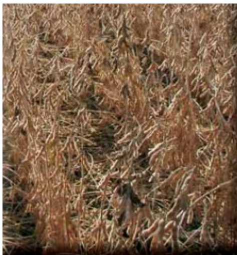
Slika 23. Sorta Podravka 95