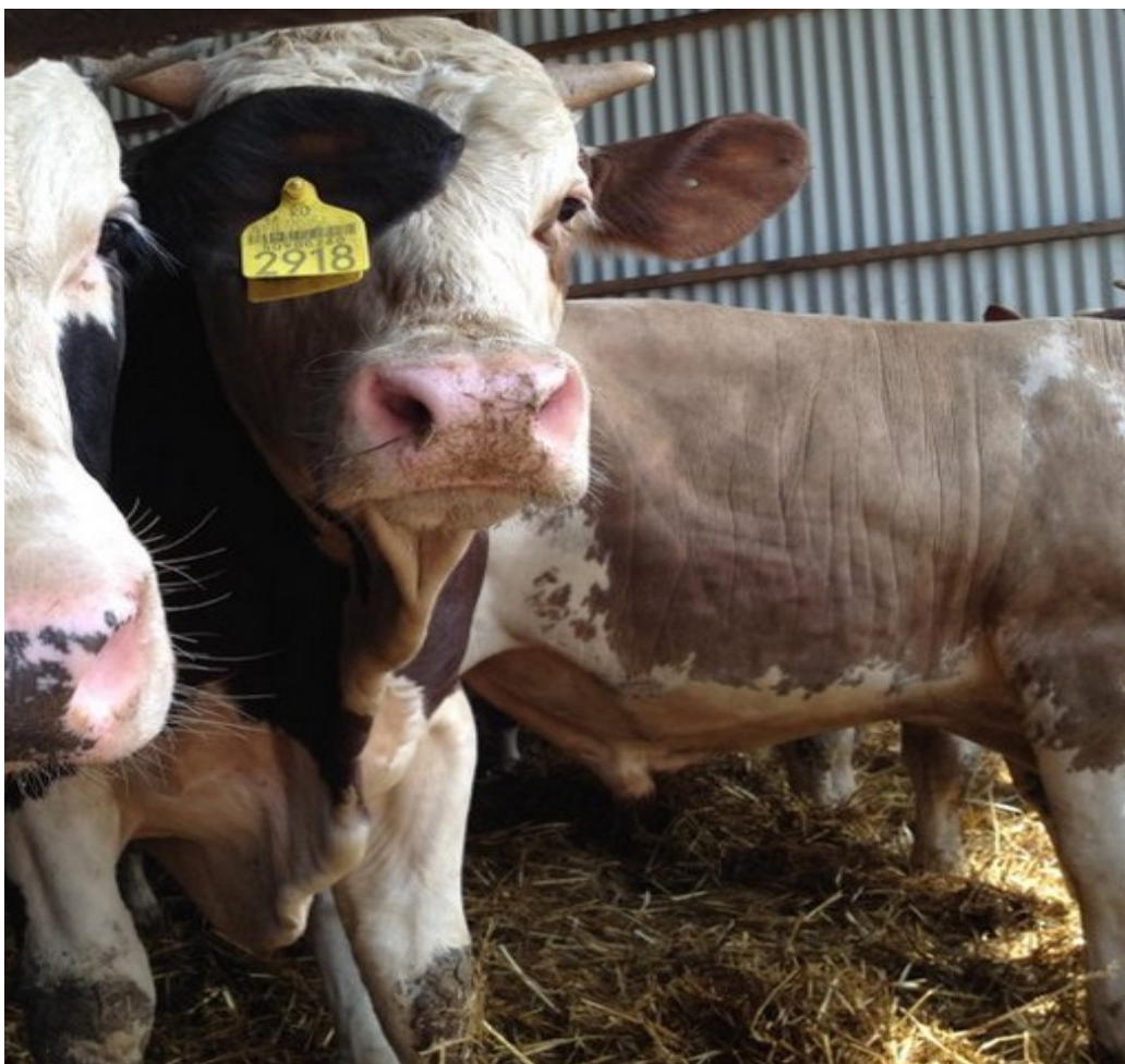
Slika 1. Govedo simentalčke pasmine na farmi